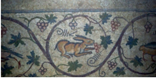
Resim 2: Asma dalları arasında üzümü yemekte olan hayvan figürleri.

Ortaya çıkarılan Germanicia mozaiklerinin konularında yer alan figürleri Kahramanmaraş florasının oluşturduğu görülmektedir. Mozaiklerde Germanicia'nın gündelik yaşamı tasvir edilmiştir. Germanicia mozaiklerinin üzerinde genellikle gündelik hayata ait konuların yer aldığını ifade eden Şahin "Baktığımız zaman villalar var, villalarda yaşanan hayatlar var. Bu bize sahiplerinin kim olduklarını ve sosyal statülerini gösteriyor." (Şahin, 2011) demektedir. Bu gündelik yaşam içerisinde av sahneleri, çeşitli hayvanların otlamaları ve asma bağından üzüm yemeleri yer almaktadır. Zeugma, Antakya, Halepli Bahçe gibi yakın çevre kentlerindeki mozaiklerinin büyük bir çoğunluğunun konusunu Antik Yunan ve Roma mitolojisi oluşturmuştur. Germanicia mozaiklerinin konusunu ise yerel yaşantının oluşturması dikkatleri çekmektedir. Yakın bölgelerden farklı konular ele alınmasında birkaç farklı görüş ortaya konulabilir. Eraslan'a göre bunun nedeni Antioch, Zeugma ve Haleplibahçe mozaiklerinden sonra Helen Stili'nin bozulmasından kaynaklanmaktadır ve bu etkiler M.S. 5. Yüzyıl mozaiklerinde yaygınlaşmaktadır (2013: 230).