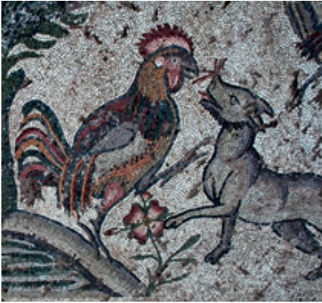
Resim 5: Horoz ile Tilki

Anadolu'da ortaya çıkarılan mozaiklerin en önemli özelliği yaşamsal durumun, hayata ait gündelik sahnelerin yansıtılmasıdır. Özellikle K. Maraş Germenicia mozaikleri Roma döneminin yaşamını anlatmaktadır. Bu mozaikler bazen şaşırtıcı konularıyla da dikkati çekmektedir. Bunların en güzel örneklerinden birisi herkesin dikkatini çeken, Avcı Mozaığı'nda konu olarak sahnelenen horoz ile tilkidir. Şahin (2011) bu kompozisyonda horoz ile tilki muhabbet ettiğini söyleyerek kompozisyonu yorumlamıştır. Kompozisyonu görünce La Fontaine'nin meşhur karga ile tilki hikayesini anımsadığımızı veburada La Fontaine'nin bin 500 yıl öncesine ait belge olduğunu düşünmeyi gerektiriyor. Kompozisyonda karga yerine horoz mu vardı acaba diyerek hikayenin kaynağının bir ihtimal Kahramanmaraş olabileceğini öne sürmektedir.