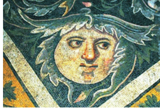
Resim 6:Germenicia Güzeli.