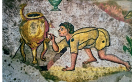
Resim 7:Ressam Figürü.

Germenicia mozaiklerinde yer alan en ilginç, hatta daha önce hiç görülmemiş bir ressam figürü bulunmaktadır. Sarı giysisiyle yere çömelerek dizi üzerine uzanmış vaziyette kaide üzerinde duran bir amforayı resimleyen elinde fırçasıyla genç bir ressam betimlenmiştir. Sarı elbisesini siyah bordürlerle çevrelenmiş ressam figürünün ayakları çıplaktır. Bakışını amforadaki ayrıntıya odaklayan ressam titizlikle çalışmasını yapmaktadır.