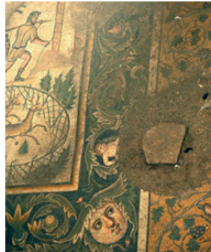
Resim 4: Geyik Avcısı Mozaïği. Eni 3.5 m. Boyu 3.7 m. M.Ö. 100- M.S. 300. (Koç, 2009).

Mitolojide Adonis efsanesi toprak ve bereket hikayesidir. Efsaneye göre Adonis çok yakışıklı bir genç olarak aşk ve güzellik tanrıçası Venüs tarafından sahiplenilmeye çalışılır. Adonis yılın dört ayını yer altında Persephone (Yer altı Tanrıçası) ile geçirmektedir. Baharla birlikte yeryüzüne çıkıp Venüs'le yaşamaya başlar. Adonis ve Venüs'ün yeryüzündeki yaşamı baharı sembolize etmektedir. Toprağın her yere bereket getirmesi sebebiyle bu olay Güney Akdeniz çevresindeki halklar için büyük bir şenliktir. Bu bakımdan burada zengin bitkisel motifler, ormanlık alan ve av hayvanlarıyla beraber toprağın bereketini anlatma amacını taşıyan, bir bahar şenliği sahnesi işlenmiştir. Bu mozaïğin ortasındaki av sahnesi Adonis efsanesinde anlatılan bir bölümdür. Av sahnesinin sağ üst tarafında ormanlık alanda genç ve yakışıklı Adonis, alt tarafta ise bir çitin içerisinde Adonis tarafından yakalanan hayvanlar betimlenmiştir. En içte yer alan bordür içinde bitkisel motifler içerisinde anlamlı bakışlarıyla tanrıça Venüs vardır. Bunun karşısında ise Adonis'e av sırasında yardım eden kanatsız Cupido (Eros) karşısından kendine saldıran aslana ok atar durumdadır. (Cupidolar antik mitolojide tanrıçaların çeşitli konularda yardımcıları olarak işlenmişlerdir. Burada da Cupido tanrıça Venüs ün isteği doğrultusunda, ava giden Adonis'e yardım eder şekilde anlatılmıştır (Koç, 2009).