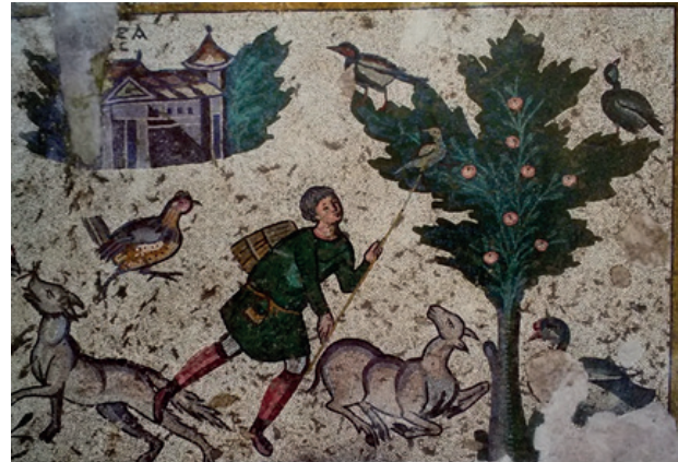
Resim 3: Avcı Mozaiği

Avcı mozaiği M.S. 4.-5. Yüzyıl Geç Roma Dönemine aittir. Bu mozaik bir villanın büyük bir odasının zemin döşemesi olarak yapılmıştır. Avcı mozaiğinin merkez panosunda üç satır şeklinde tasvirler yapılmıştır. Bu tasvirlerde insan, hayvan, ağaç figürleri bulunmaktadır. Merkez panelin kenarında geometrik şekiller, bunun dışını çevreleyen fazla kalın olmayan bir bordür vardır. Bu bordürün dışında mozaik paneli dört bir taraftan çevreleyen, asma dallarından oluşan helezonik dairesel hareketler içerisinde çeşitli hayvanlara ait betimlemeler yer almaktadır. Mozaik panelin en dış kısmı yine bir bordürle çevrelenmektedir. Hachlili asma dalları arasında hayvan figürlerinin betimlenmesi ve koşan hayvan temsillerinin Roma mozaiklerinde popüler olduğunu söyler (Hachlili, 2009: 157).