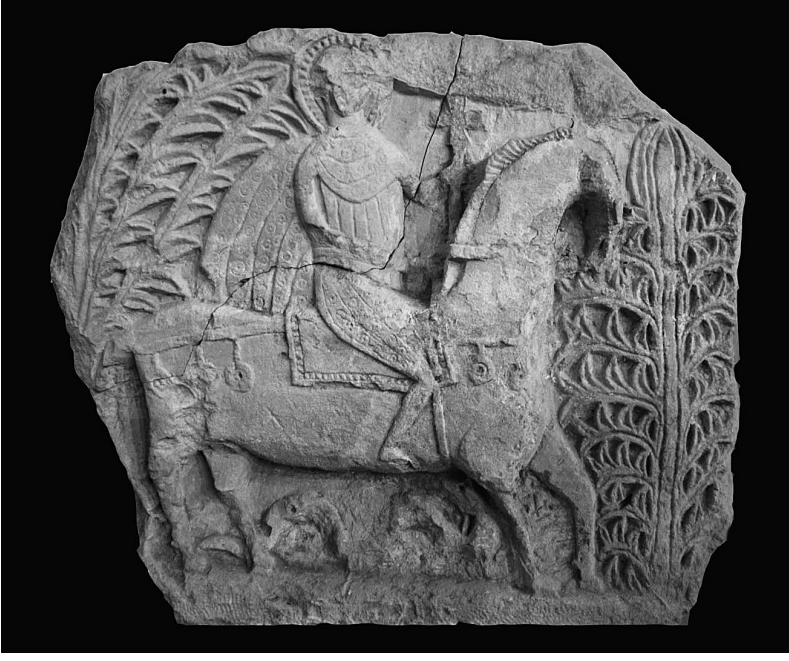
Fig. 1 Tarsus Müzesi'ndeki Aziz Georgios Kabartması