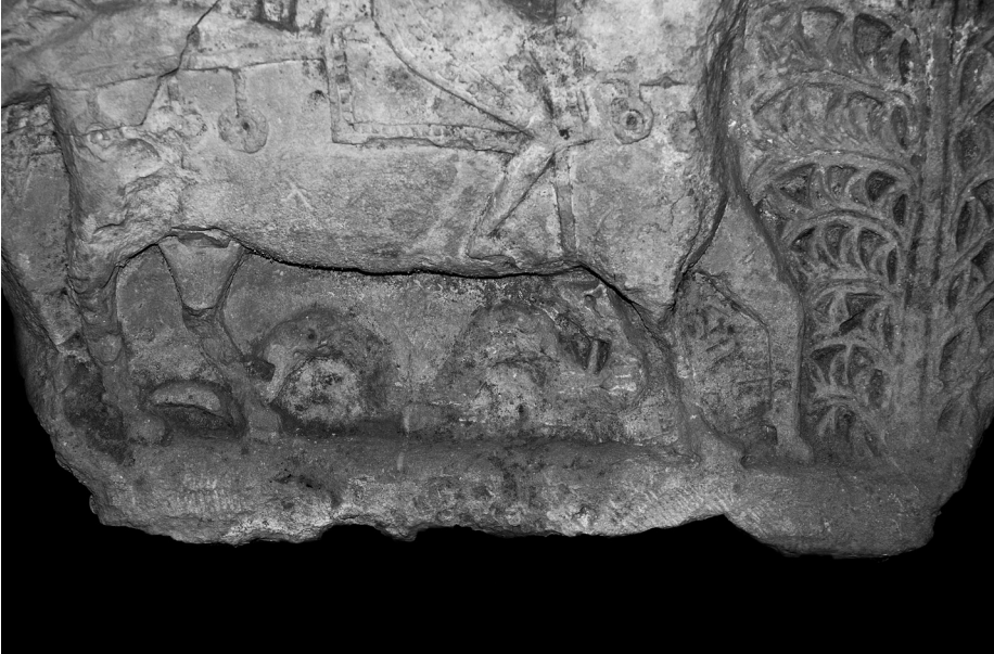
Fig. 4 Tarsus Müzesi'ndeki Aziz Georgios Kabartması, yılan