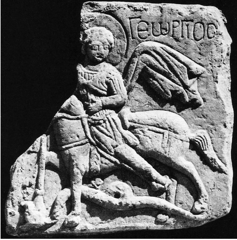
Fig. 5 Sakız Adası'ndaki Aziz Georgios Kabartması (Lange 1964, 134 Nr. 64, fig. 64)