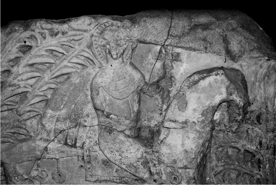
Fig. 3 Tarsus Müzesi'ndeki Aziz Georgios Kabartması, detay