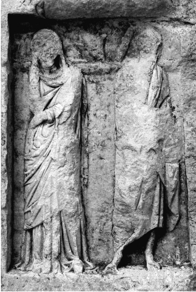
Fig. 2 Tire Mzesi Ge Hellenistik Dnem mezar steli, detay.