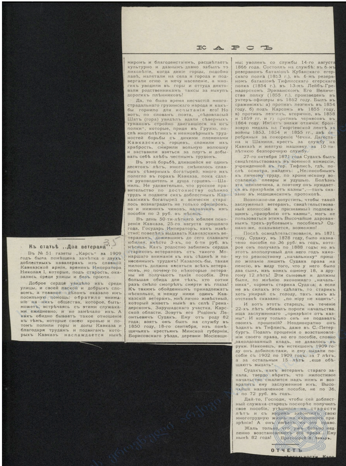
Belge 3: Kars Gazetesindeki "İki Gazi hakkında" Başlıklı Makale