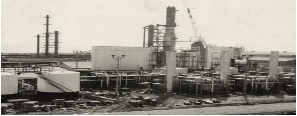
Aliğa Petrol Rafinerisi inşaatından bir görüntü