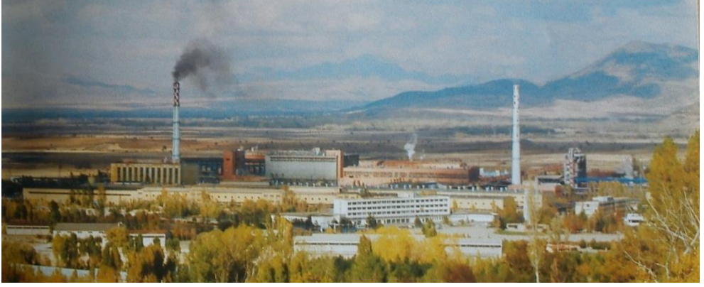
Seydişehir alüminyum tesislerinin uzaktan bir görüntüsü

Alüminyum, alümina ve hadde 78 bölümlerinden oluşan ve 4.137.000 m 2 alan üzerine inşa edilen tesisin alümina fabrikası ve yardımcı ünitelerindeki ilk tecrübe üretimi 29 Mayıs 1972’de yapıldı. Türkiye’de ilk alümina üretimi 4 Mayıs 1973’te gerçekleştirildi. Tesisin alüminyum kısmı ise 14 Ekim 1974’te üretime geçti. 79 Böylece Türkiye’de ilk kez 1974’te alüminyum imal edildi. Fabrikada yılda 200.000 ton alümina, 60.000 ton alüminyum, 2.500 ton hadde ve diğer alüminyum ürünleri üretilmekteydi. Fabrika, kapasite bakımından dönemi itibariyle Orta Doğu’nun en büyük alüminyum tesisi özelliğine sahipti. 80 İşletmenin faaliyete geçmesi ile ülkeye yıllık 55.000.000 dolar döviz tasarrufu ve gayri safi milli hasılaya 700.000.000 lira katkı sağlanacaktı. 81