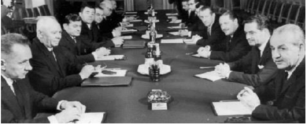
Türk ve Rus heyetinin 1965'te SSCB'de yaptıkları toplantıdan bir görüntü

bulundu. 41 Yapılan görüşmelerde İBYKP sonucu kurulacak sanayi tesisleri de değerlendirildi. Buna göre tesisler için SSCB'den %2.5 faizli on yıllık bir kredi alınacaktı. Kredi, Türkiye'de üretilen mallar ile ödenecekti. Sanayi tesislerinin inşaat masraflarının %40'ını Türkiye ve %60'ını SSCB karşılayacaktı. 42