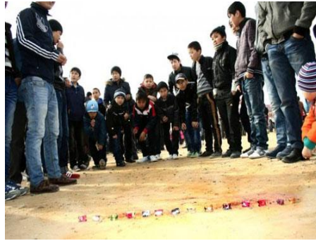
Resim 3. Aşık oyunu

Orta Asya’da bazı bölgelerde hala benzer adlarla oynanmaya devam eden “aşık oyunu” ,Türk tarihinin eski dönemlerinden günümüze kadar taşınan milli bir oyundur. Bu oyunun ismi; küçükbaş hayvanların arka bacaklarındaki diz eklemine bulunan aşık kemiğinden gelmektedir. Aşık kemiğinin dört köşesi vardır, oldukça dayanıklı olup eski zamanlardan beri oyun aracı olarak kullanılmıştır. Aşık oyunu, ilk haliyle hala Kırgızistan ve Kazakistan gibi Orta Asya Türk Cumhuriyetlerinde oynandığı bilinmektedir.