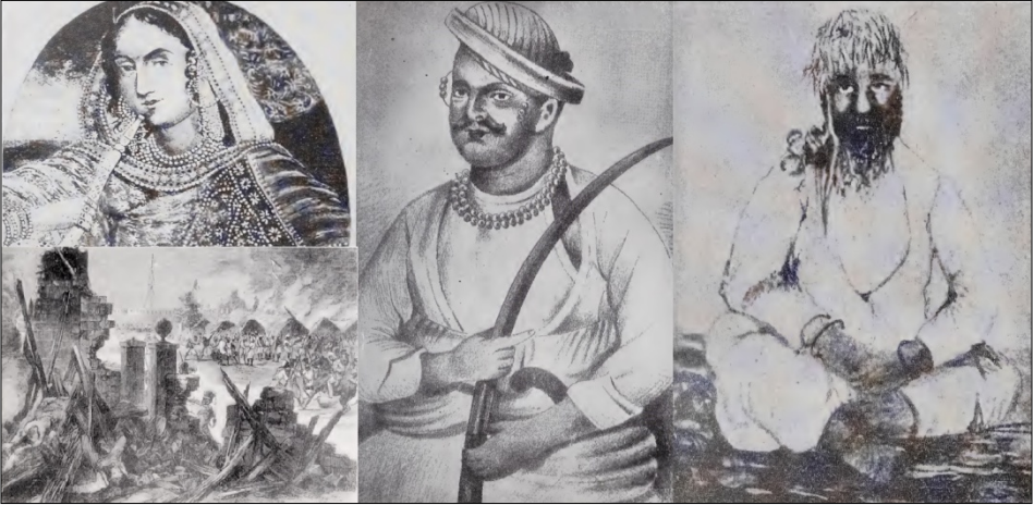
Resim 4: Soldan Sağa; Begüm Hazrat Mahal, Nana Sahib, Tatya Tope. Begüm Hazrat Mahal’in resminin altında Meerut’taki ayaklanma resmedilmiştir.” THE PUBLICATIONS DIVISION, 1857: A Pictorial Presentation , Government of India, Patiala House, New Delhi, 1957, s. 7, 32, 44, 66.