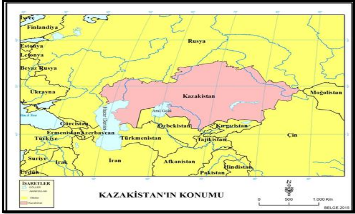
Şekil 1. Kazakistan'ın Coğrafi Konumu

Kazakistan ovası daha yüksek olup Balkaş istikametinde alçalır ve güneydoğu istikametinde Tiyen-Şan (Tanrı Dağları veya Han Tengri)'a kadar uzanır. 30