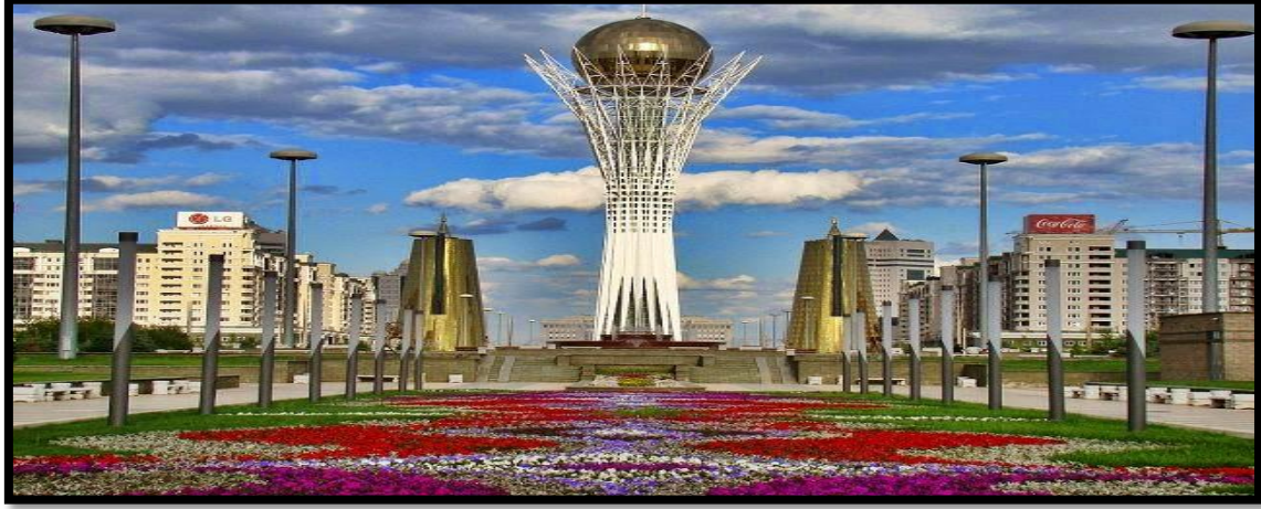
Şekil 2. Kazakistan'ın Astana Şehrinde Bulunan Bayterek Anıt

heykellerde can bulmuştur. Kazakistan'da şehrin önemli merkezlerinde mit heykellerin halkın gözünün önünde olması sağlanmıştır. Örneğin, Kazakistan'ın başkenti Astana'da birçok meydana Nazarbayev heykeli yer almaktadır. Aynı zamanda yine başkent Astana'da bulunan Bayterek anıtında Nazarbayev'in sağ eli resmedilmiş ve bu ele dokunulduğunda milli marş çalmaktadır. 67