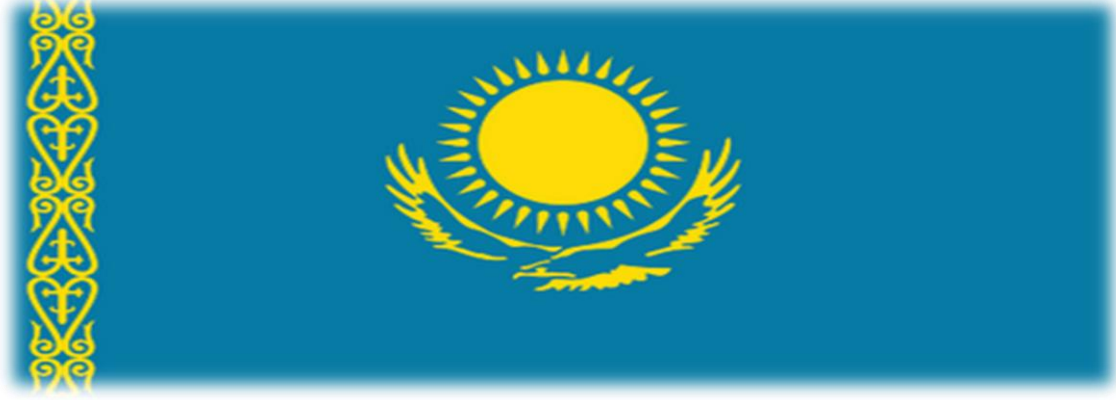
Şekil 3. Kazakistan Ulusal Bayrağı