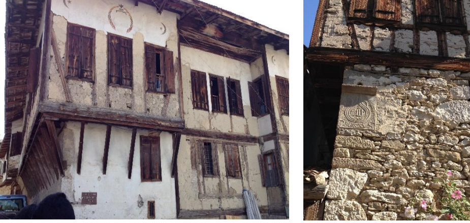
Foto 1-2: Yörük Köyü sakinlerinin yerleşik yaşama geçtikten sonra yaptıkları dış duvar süslemeli iki mesken (İki Kutsal Değer: kabartma Ay-Yıldız ve taşla işlenmiş Allah lafzı).