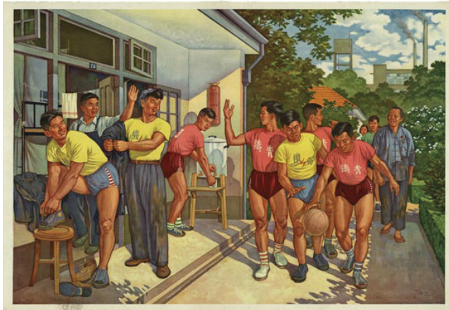
Resim 1. “Fabrika” Konulu Poster

ÇHC'nin kuruluşundan itibaren Mao yönetimi ülke genelinde önemli sanayileşme hamleleri gerçekleştirilmiştir. Mao, 1950'li yıllardan itibaren Çin'de 5 yıllık kalkınma planlarını yürürlüğe sokmuştu. Bu aşamada Çin'deki kitle iletişim araçlarından Çin'in gelişen ekonomisinin vurgusu sıklıkla yapılmaya başlanmıştır. Çin'de sanayileşmenin artması, tarımda çalışan nüfusun önemli bir kısmının fabrikalara yönelmesine yol açmıştır. Bu süreçte Çin mediasında, ülkede işçiler sıklıkla yer almaya başlamıştı. “Fabrika” konulu poster, Ding Hao tarafından 1954 yılında yapılmıştır. Poster düzenlam açısından incelendiğinde, posterde Çin'deki bir fabrikadaki işçilerin konu edildiği görülmektedir. Görsel kodlar içerisinde işçilerin, tulumlarını çıkardıkları ve spor kıyafetlerini giydikleri aktarılmaktadır. İşçilerden birinin spor kıyafetlerinin tulumunun hemen altında olduğu gösterilmektedir. Posterdeki sunum kodlarında tüm işçilerin mutlu olduğu aktarılmaktadır. Posterde “İşten Sonra” yazılı kodu bulunmaktadır.