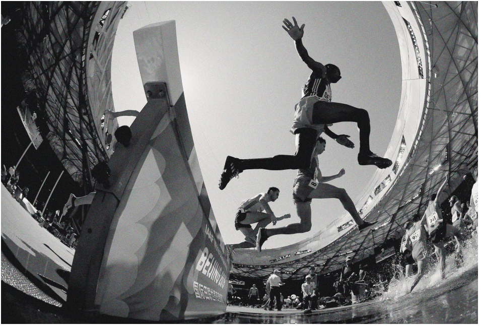
15. IAAF Dünya Atletizm Şampiyonası Pekin 2015