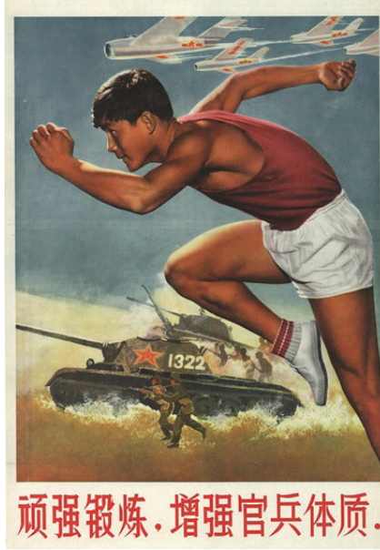
Resim 2. “Asker” Konulu Poster

mamaktadır. Posterde koşmakta olan bir erkeğin görseline yer verilmiştir. Erkeğin hemen arkasında da Çin ordusuna ait olduğu görülen asker, tank ve savaş uçağı görselleri yansıtılmaktadır. Posterin altında “Subayların ve askerlerin fiziğini güçlendirmek için antrenmanlarda inatçı olun” yazılı kodu bulunmaktadır.