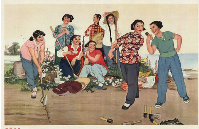
Resim 3. “Tarla” Konulu Poster

Mao yönetimdeki ÇKP'deki siviller, gerek Japon işgalcilere gerekse Çan Kay Şek ordusuna karşı savaşlarda önemli görevler üstlenmiştir. Bu süreçte Mao, sivilleri silahlandırarak düşmanlarına karşı devasa büyüklükte bir ordu meydana getirmişti. İç savaşın bitmesinden sonra da Mao, sivil halkın her daim savaşa hazır olmasına önem vermiş ve bu amaçla Çin medyasında Çinli siviller ile Çin ordusu sık sık aynı karede yer almıştır. “Tarla” konulu poster 1964 yılında yapılmıştır. Posterin yapımcısı hakkında bilgi bulunmamaktadır. Poster düzanlam açısından analiz edildiğinde, posterde tarlada bulunan Çinli genç kızların resmedildiği görülmektedir. Görsel kodlar içerisinde Çinli kadınların ellerinde çapaların ve silahların olduğu yansıtılmaktadır. Posterin sağ tarafında yer alan iki genç kızın ellerinde ise saplı el bombalarının olduğu aktarılmaktadır. Posterdeki sunum kodları içerisinde de tüm Çinli genç kızların neşeli olduğu yansıtılmaktadır. Posterde “Tarlalar arasında dinlenme” yazılı kodu bulunmaktadır.