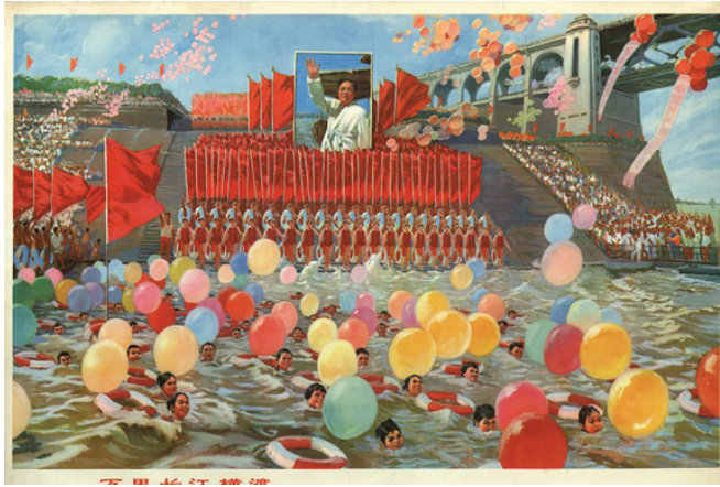
Resim 5. “Yüzme” Konulu Poster

Mao, çeyrek asrı aşan iktidarı döneminde dünyanın en etkili kült liderlerinden biri haline gelmiştir. Mao'nun kült liderliğinin inşasında da, Çin medyası sıklıkla Çin halkının Mao'ya olan sevgisini yansıtmaktaydı. Çin yönetimi ülke genelinde Çin halkının, Mao'yu çok sevdiğine ve ona sadakat ile bağlı olduğuna yönelik mitler inşa etmeye çalışmaktaydı. Bu aşamada Mao'nun ünlü Wuhan yakınlarındaki Yangzi nehrinde yüzmesinin anısına Çinli vatandaşların yüzmesi, Mao'nun kült liderliğinin önemli bir yansıması olarak ortaya çıkmaktadır. “Yüzme” konulu poster, WeiYang tarafından 1976 yılında yapılmıştır. Poster yananlam açısından incelendiğinde, posterde nehirde yüzmekte olan Çinlilerin resmedildiği görülmektedir. Nehir kıyısında da kızıl bayraklar içerisinde bekleyen Çinli insanlar yer almaktadır. Posterin merkezinde Mao'nun bornozlu bir resminin bulunduğu aktarılmaktadır. Nehirde yüzenlerin çevresinde de can simitleri ve balonların olduğu belirtilmektedir. Posterin altında “Yangzi Nehri'ni geçmek” yazılı kodu bulunmaktadır.