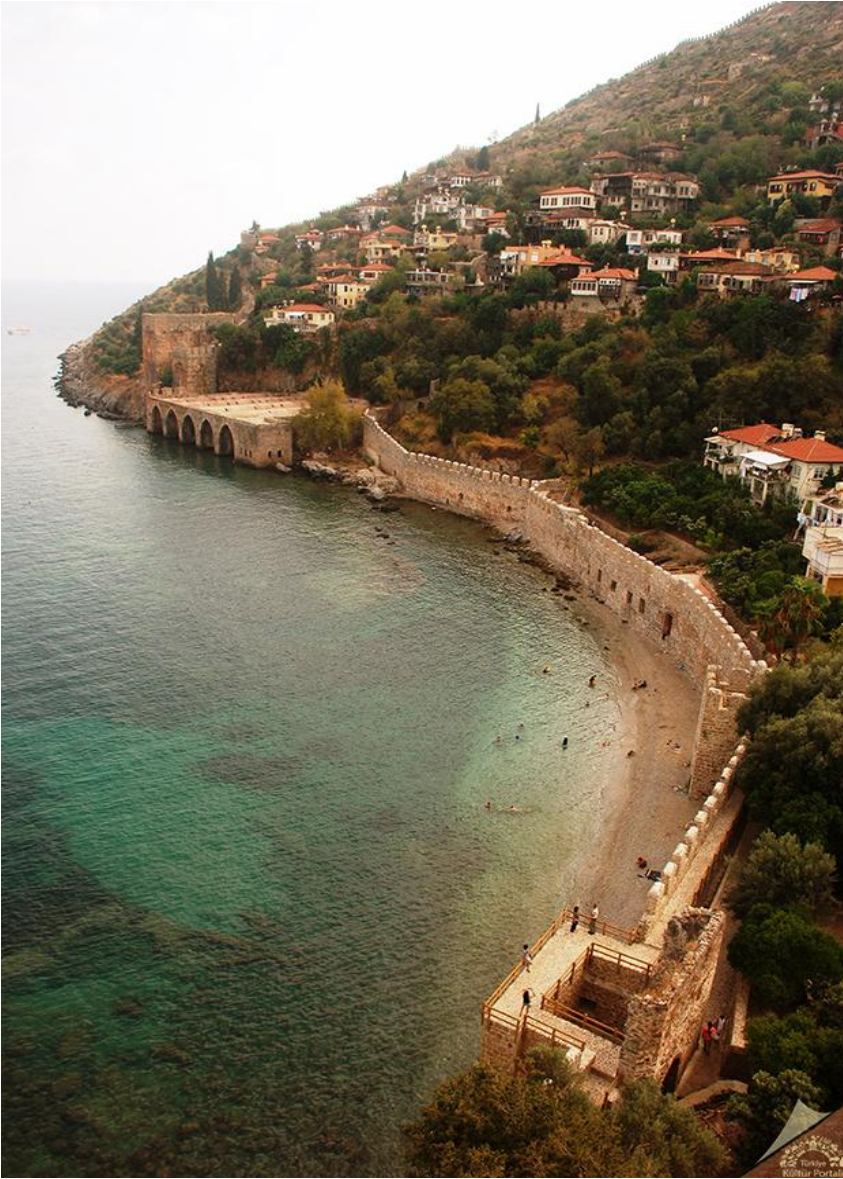
Resim 3: Alanya Tersanesi

[ https://www.kulturportali.gov.tr/turkiye/antalya/gezilecekyer/alanya-kalesi (13.02.2019)]