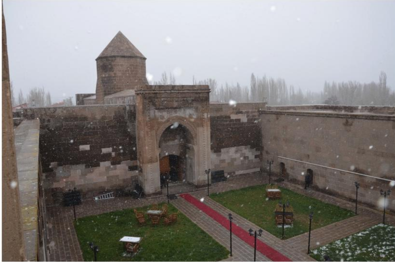
Resim 5: Bir Han Örneđi (Kayseri Karatay Hanı)