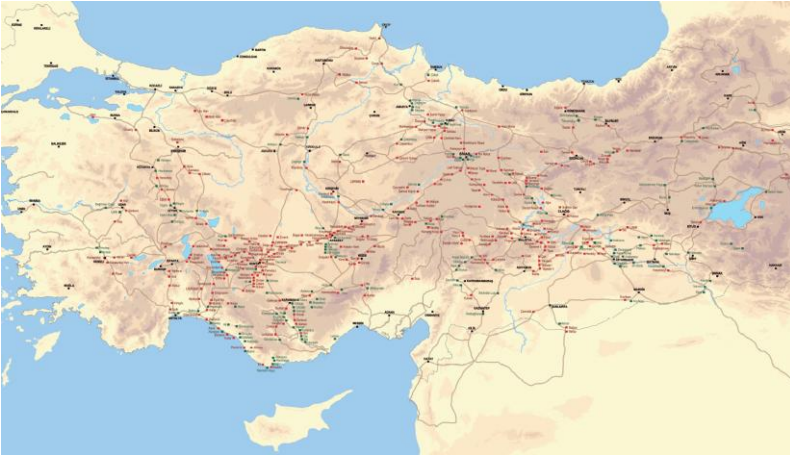
Resim 2: Ortaçağ Anadolu Kervan Yolları, Kervansaraylar ve Köprüler [İpek Yolu – Kültür Yolu: Anadolu’da Ortaçağ’da Kervan Yolları, Kervansaraylar ve Köprüler, ÇEKÜL (Çevre ve Kültür Değerlerini Koruma ve Tanıtma) Vakfı, İstanbul, 2012]