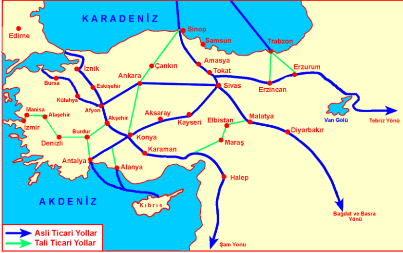
Resim 4: Türkiye Selçuklularını Dönemi Genel Hatları İle Ticari Yol Haritası