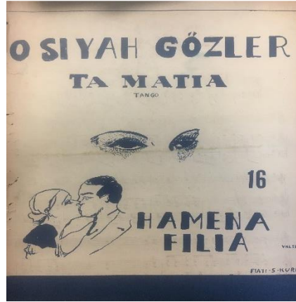
Resim 3: Sözler Türkçe, müzik Yunanca bir tango örneği.

1920'li yılların sonlarına doğru söz ve müziği Türk besteciler tarafından yazılan tangolar ortaya çıkmaktadır. Bu açıdan Türk tangosunun üç temel taşı; Necip Celal Andel, Fehmi Ege ve Necdet Koyutürk olarak bilinmektedir. İlk Türkçe sözlü tango ise 1928 yılında Necip Celal Andel tarafından yazılan Mazi'dir. "Sözlerini Necdet Rüstü Efe'nin yazdığı Mazi, 1930-31 yıllarında, o günlerde bir konservatuvar öğrencisi olan Seyyan Hanım (Oskay) tarafından plağa kayıt edilmiş, ardından Fehmi Ege tarafından bestelenen Mehtaplı Bir Gecede isimli bir tango da yine Seyyan Hanım tarafından plağa kayıt edilmiştir. Neticede Seyyan Hanım, Türkçe tangoları ilk seslendiren kadın solist olarak tarihte yerini almıştır" (Erağan, 1994: 86). "Viyolonist, orkestra şefi ve besteci kimliğiyle Fehmi Ege (1902-1978), gerek tangoları, gerekse tango dışı besteleriyle, Ankara ve İstanbul radyolarında kurduğu tango orkestralarıyla yaptığı bant kayıtlarıyla, Türkiye'de Batı müziğinin yerleşmesinde önemli rol oynamıştır" (Narter, 2016: 203).