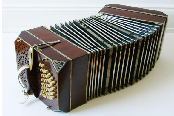
Resim 1: Bandoneon (Akgün, 2002).

Çalgısal olarak bakıldığında ilk tango topluluklarının başlangıçta üçlü çalgı topluluğundan oluştuğu görülmektedir. Bu üçlüde öncelikle arp ya da gitar, keman ve flüt bulunmaktadır. Zamanla başta bandoneon olmak üzere, piyano, keman, kontrbas ve bazen klarinetin yer aldığı tango orkestraları oluşturulmuştur. Bu orkestraların oluşturulmasıyla tango, Arjantin'in seçkin kesimi ile tanışmıştır. Ancak tangonun vazgeçilmez çalgısı bandoneon olarak bilinmektedir.