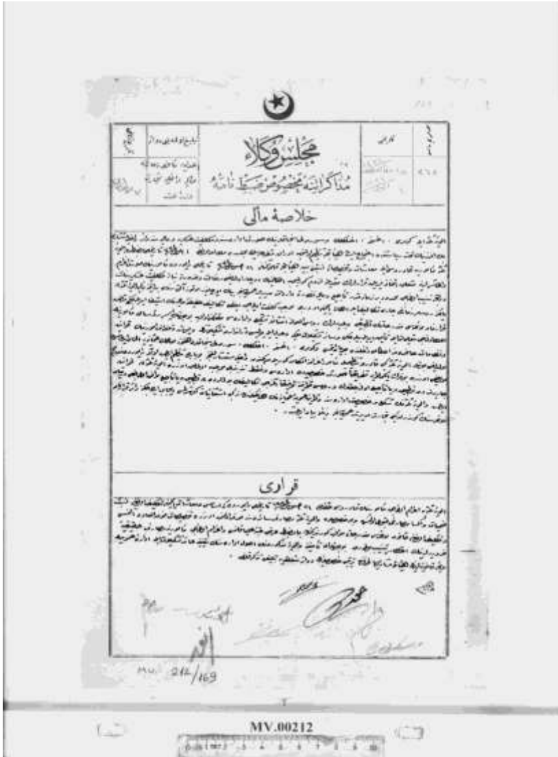
EK 3- Elviye-i Selase (Kars, Ardahan ve Batum) Ahıska, Ahılkelek ve Sürmeli sancaklarının Ruslar tarafından boşaltılması ile buralarda yeniden kurulacak mülki ve adli teşkilat kadrolarının hazırlanması için kurulan komisyonun gerekli çalışmalarına başlanmasına dair.