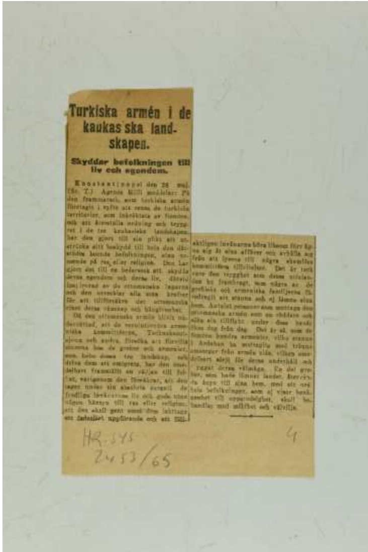
EK 4- İsveç basınına yansıyan “Türk Ordusu Ahalinin Mal ve Canını Himaye Ediyor” başlıklı haberlere dair.