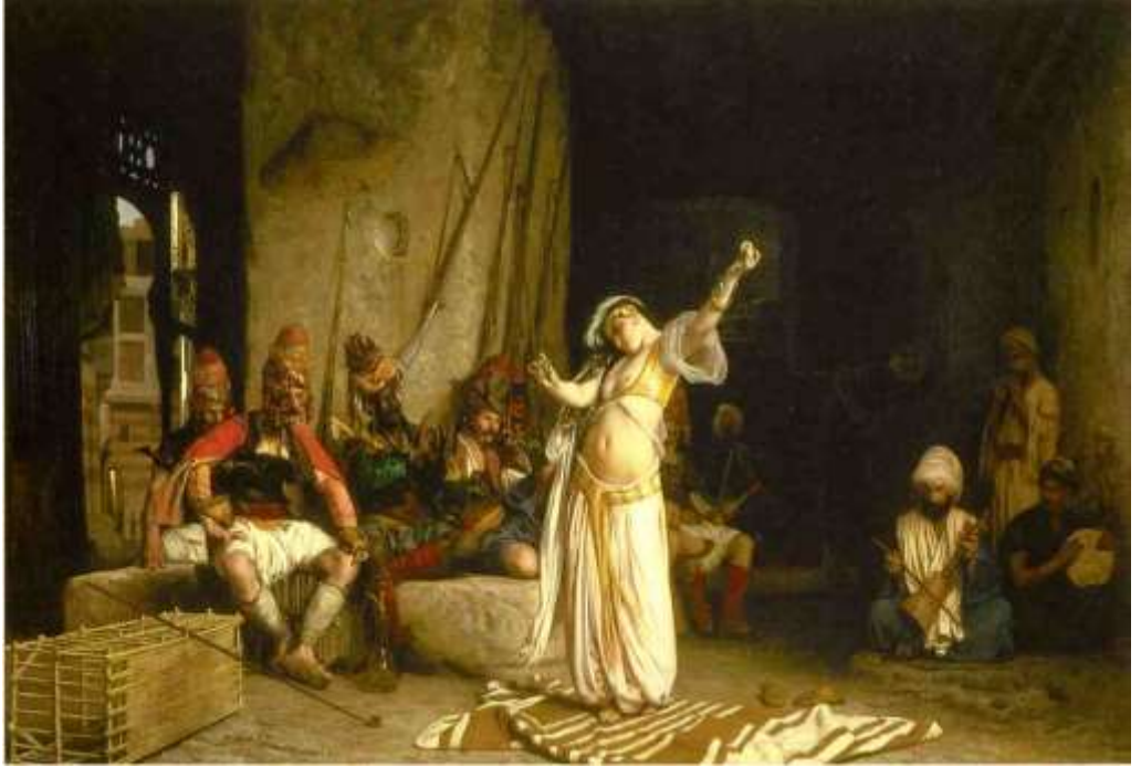
Görsel 2: Jean-Leon Gerome (1824-1904) - The Dance of the Almeh.