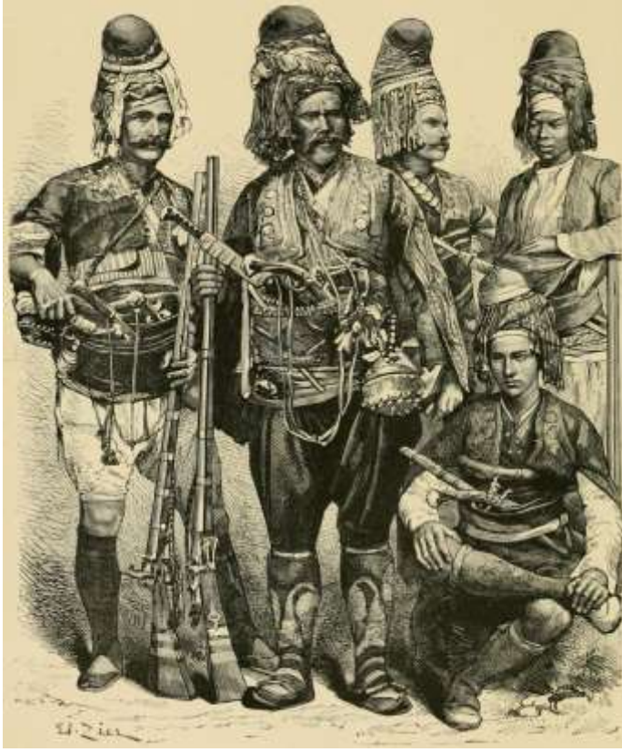
Görse1 3: Edouard François Zier, Nouvelle Geographie Universelle. Tome IX L'Asie Anterieure, Paris, 1884.