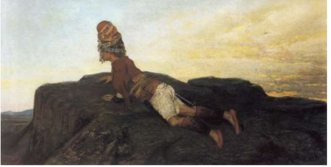
Görsel 5: Osman Hamdi (1842-1910) Pusuda Zeybek .