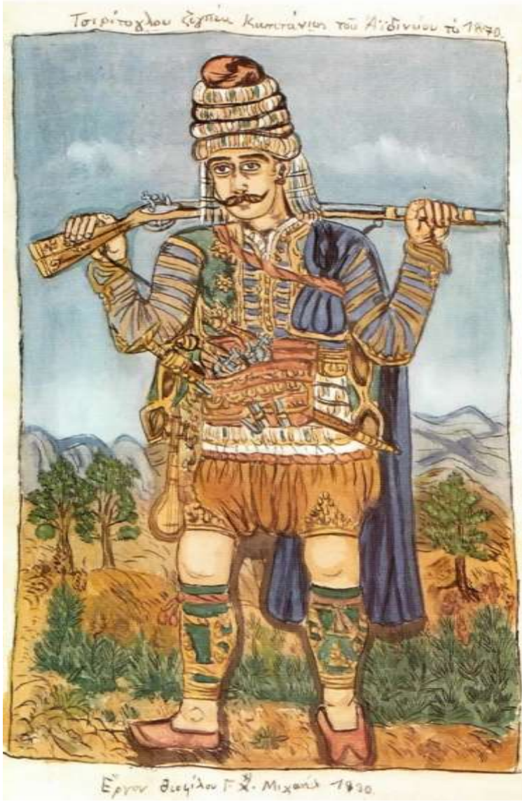
Görsel 4: Midillili ressam Theophilos'un "Zeybek Ceritoğlu, Aydınlı Kaptan 1870" adlı eseri.