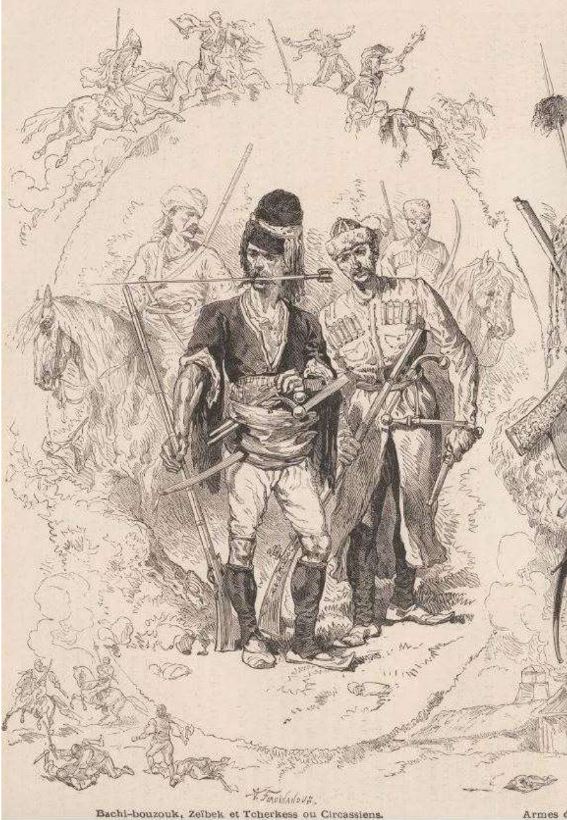
Görsel 1: 1857 tarihli Le Monde gazetesinde yer alan zeybek çizimi. Kırım Savaşı'ndaki başıbozuk müfreze mensubu zeybekleri betimleyen bu görselde, bir başka savaşçı millet olan Çerkesler de yer almıştır. Görseli kıymetli kılan unsurlardan birisi de karakterleri bir daire şeklinde saran ve zeybek çetelerinin saldırı tarzını bize gösteren küçük çizimlerdir.