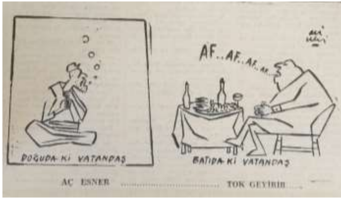
Cumhuriyet, 20 Ocak 1962