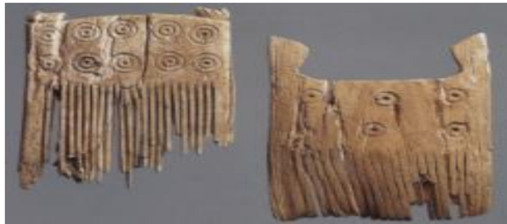
Resim-15: Tell Abraq'ta bulunan daire motifli taraklar (Collins, 2003, s. 315).