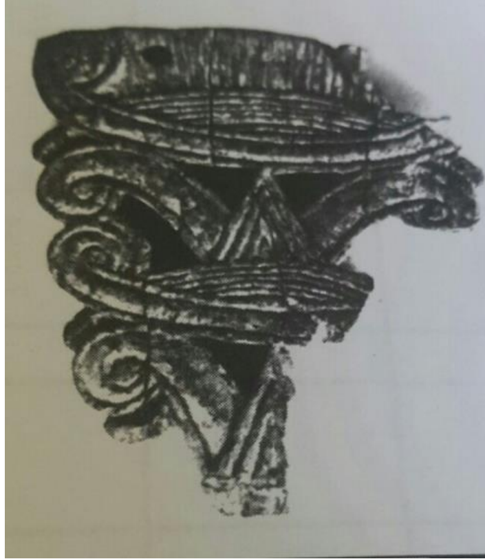
Resim-17: Gimnavaz Höyük'te bulunmuş olan ayna parçası (Erkanal-Öktü, a.g.m. , s. 353).