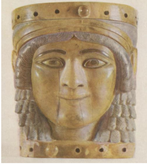
Resim-18: “Mona Lisa” adı verilen kadın başı (Mallowan, 1963, Plate 1).