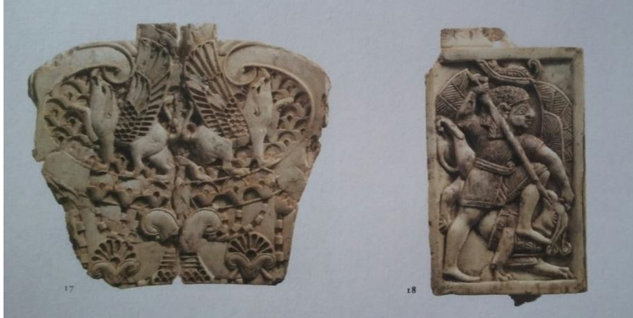
Resim-2: "Fort Shalmaneser" fildii plakaları (Aruz, a.g.m. , s. 18).