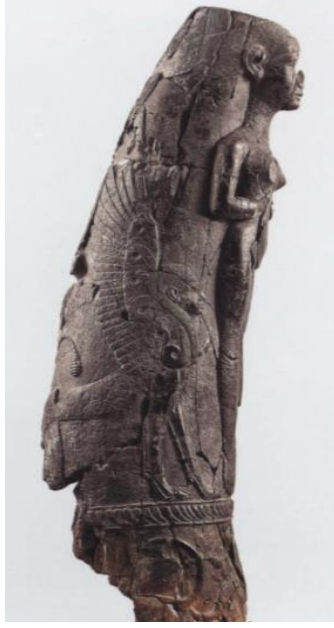
Resim-1: Ugarit'te bulunan mzik aleti (Caubet, a.g.m. , s. 407).