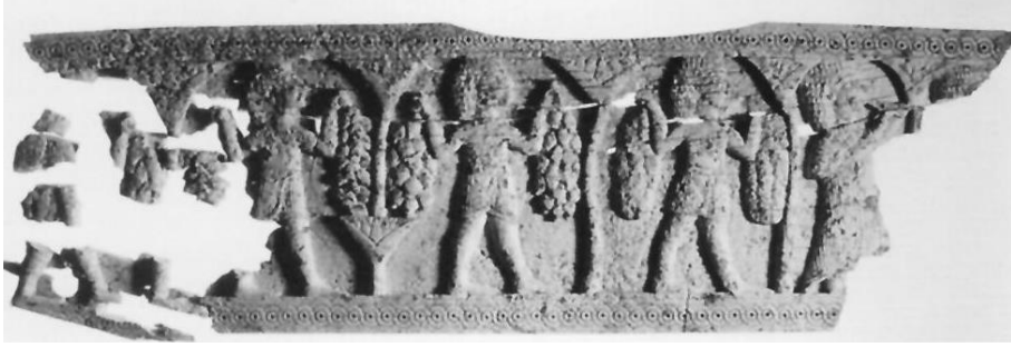
Resim-3: Til Barsip'te bulunmuş olan fildişi plaka (Bunnens, a.g.m. , s. 441).