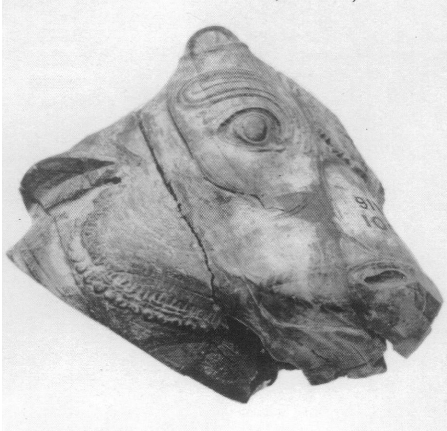
Resim-4: Sippar'da bulunmuş olan fildişi boğa başı (Hanfmann, a.g.m. , Plate XX-1)