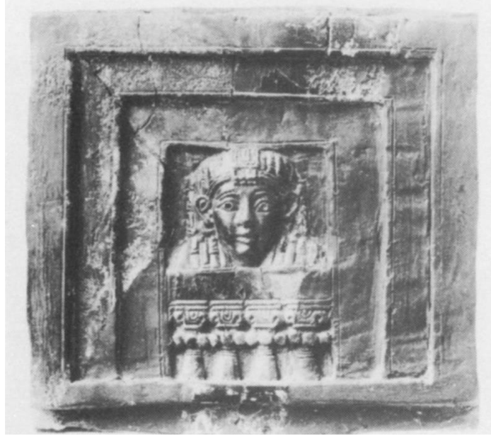
Resim-6: "Pencerede Kadın" betimlemesi (Reader, a.g.m. , Plate XIII-d).