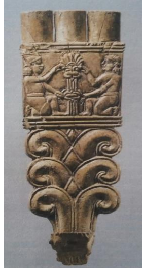
Resim-13: Yelpaze parçası (Collins, 2009, s. 10).