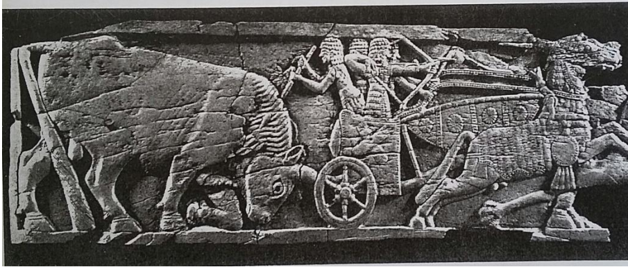
Resim-8: Fort Shalmeneser'de ele geçen yatak başlığı (Mallowan, 1966, s. 491).