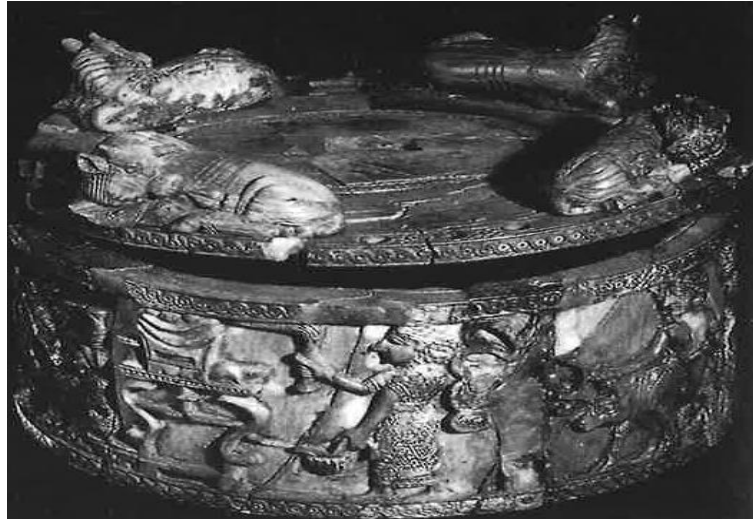
Resim-10: Nimrud'da bulunmuş olan fildişi makyaj kutusu (Oates-Oates, a.g.e. , s. 94).