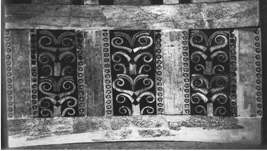
Resim-7: Nimrud'da bulunmuş olan sandalye arkılığı (Oates-Oates, a.g.e. , s. 167).