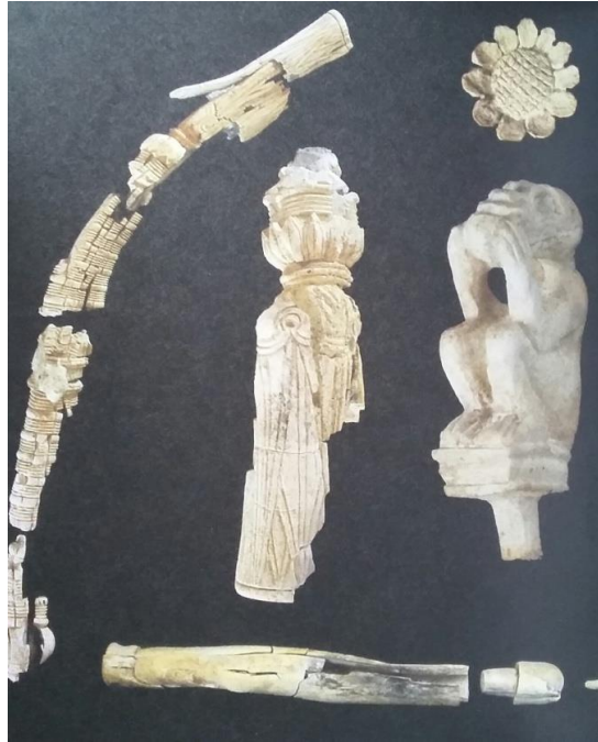
Resim-19: Ziyaret Tepe’de kremasyon mezarda bulunan fildiřleri (Mathey vd., a.g.e. , s. 104).