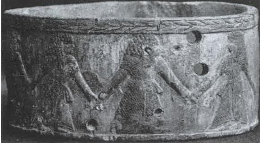
Resim-9: Ur'da bulunmuş olan fildişi makyaj kutusu (Woolley, a.g.e. , Plate 31-b).