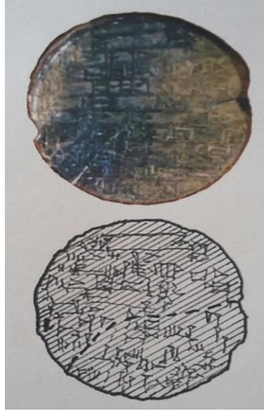
Resim-12: Yeni Asur kraliçelerinin mezarında bulunmuş olan, üzerinde Sin-iddinam'ın yazıtı bulunan kutu kapağı (Hussein, a.g.e. , Plate 210-b).