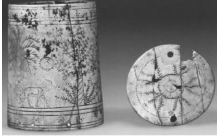
Resim-11: Asur'da bulunmuş olan Orta Asur Dönemi'ne ait silindir kutu a.g.m. , s. 208).