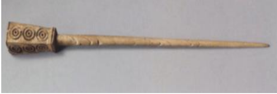
Resim16: Tell Abraq'ta bulunan saç tokası (Collins, 2003, s. 316).