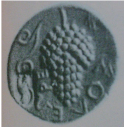
Resim 4: Üzüm salkımlı sikke