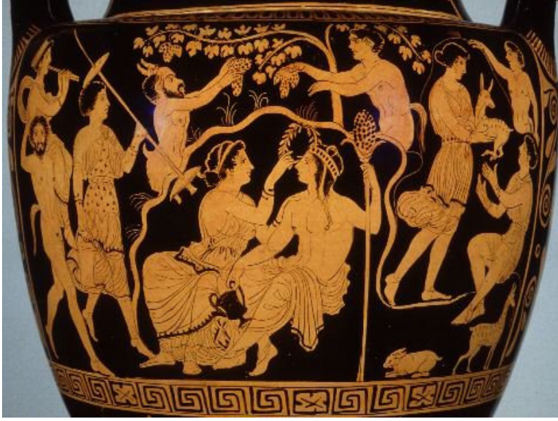
Resim 3: Bir toprak kapt a asma, üzüm ve Dionysos tasviri