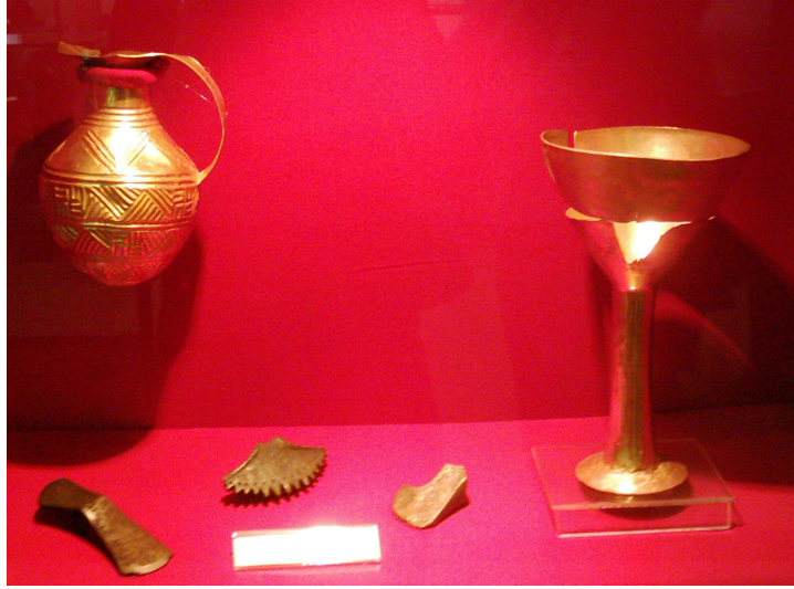
Resim 1: Anadolu Medeniyetleri Müzesi-Hititler (M.Ö. 3000) som altından yapılmış şarap sürahisi ve ayaklı şarap kadehi