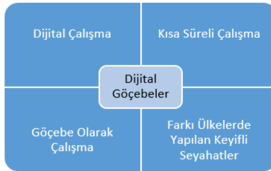
Şekil-1: Dijital Göçebeler Kavramını Oluşturan Temel Kavramlar (URL,1)

Dijital göçebeler kavramının tam anlamı ile anlamlandırılabilmesi için bu dört temel kavram bireylerin yaşantılarında yer alması gerekmektedir. Dijital göçebelik bu dört temel kavramın kesiştiği noktada ortaya çıkmaktadır.