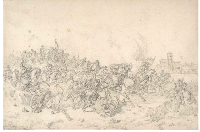
16a Stanislaw Chlebowski, Savaş Sahnesi , Ulusal Müze, Env. Rys. Pol. 7769, Varşova.

sultanın isteğiyle yapılan eserlerini değerlendirek şöyle yazmıştır: “Chlebowski gerçekten yetenekli; ancak gitmeye zorlandığı yolun onun için doğru bir yol olduğundan emin değiliz... O hiçbir zaman savaşların ve koskoca tabloların ressamı olmamıştır. Bir köşede sessizce düşüncelere dalmayı seven bir sanatçısıdır... Ama ne yapmalı, insanların