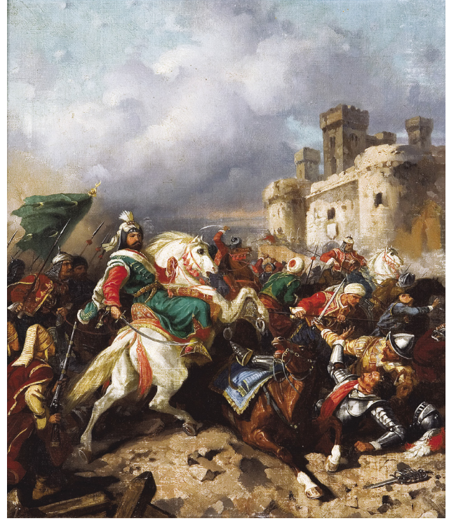
14 Stanisław Chlebowski, Sultan IV. Murad'ın Bağdat Seferi , tuval üzerine yağlıboya, 38.5 x 46.5 cm, Env. No. 11/1499.

Chlebowski'nin savaş tablolarında, karakterlerin ve atların çok sayıda tekrar eden şematik tasvirleri de vardır. Bir padişah veya kumandanın,