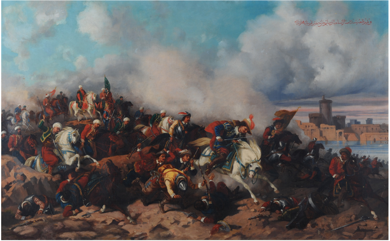
16b Stanislaw Chlebowski, Vidin Kalesi , 19. yüzyıl sonu, tuval üzerine yağlıboya, 78 x 126 cm, Env. No. 125. (Harbiye Askeri Müzesi Resim Koleksiyonu)

sultanın isteğiyle yapılan eserlerini değerlendirek şöyle yazmıştır: “Chlebowski gerçekten yetenekli; ancak gitmeye zorlandığı yolun onun için doğru bir yol olduğundan emin değiliz... O hiçbir zaman savaşların ve koskoca tabloların ressamı olmamıştır. Bir köşede sessizce düşüncelere dalmayı seven bir sanatçısıdır... Ama ne yapmalı, insanların