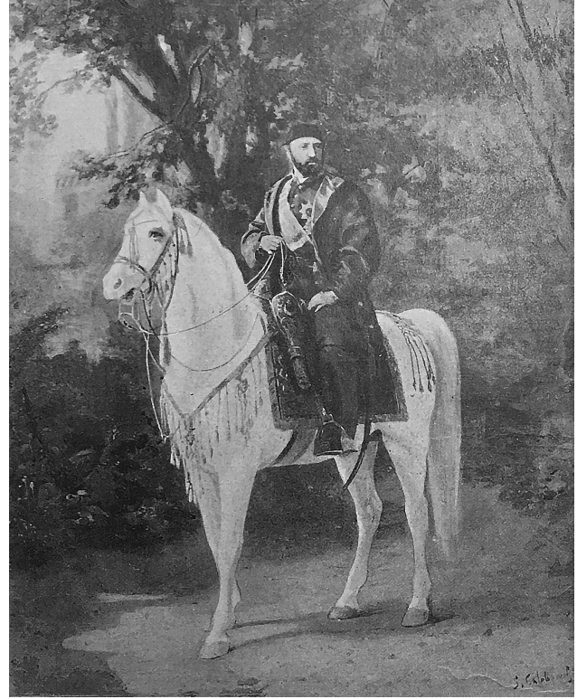
11 Sultan Abdülaziz, Tygodnik Ilustrowany , reproduksiyon, Ulusal Müze, Varşova.

Chlebowski'nin yaptığı sultan portreleri içinde bilinen en eskisi 1865 yılında çizdiği, Le Monde