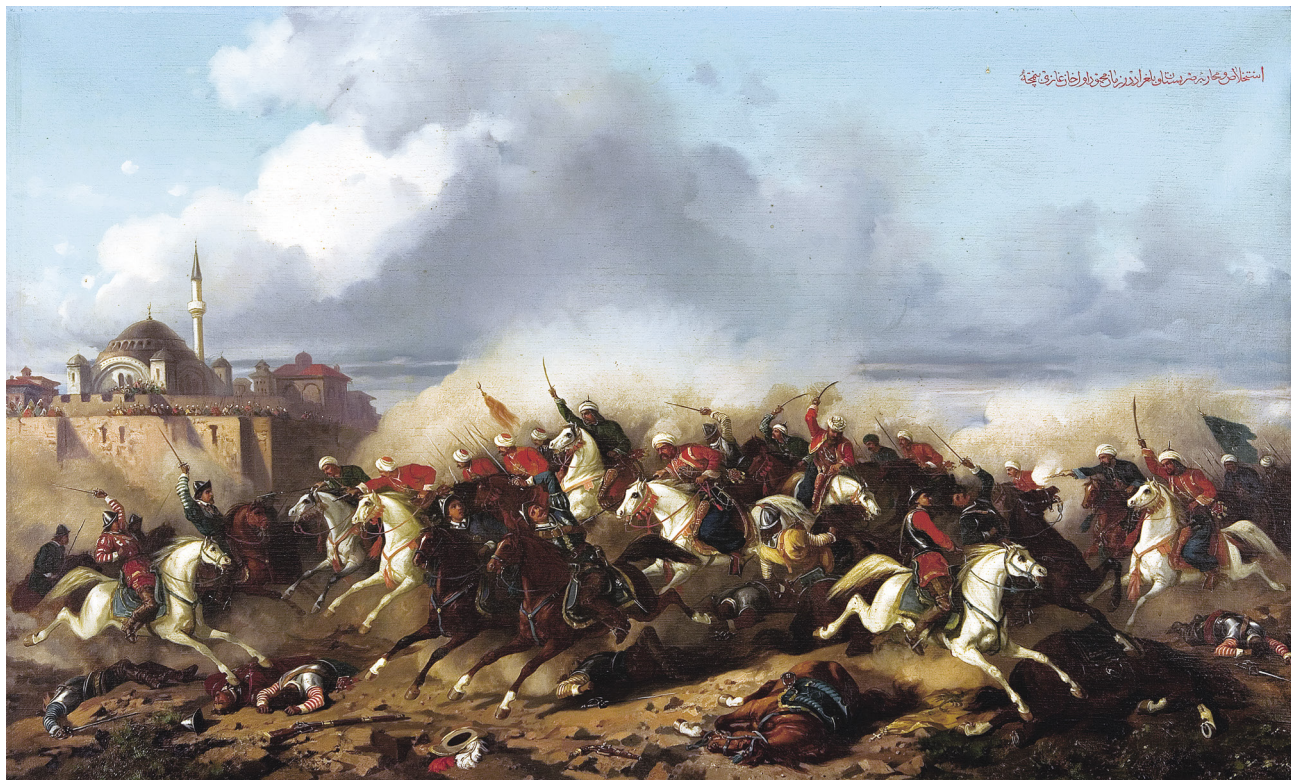
13 Stanislaw Chlebowski, Sultan I. Mahmud Devri'nde Belgrad Kalesi'ne Hücum , tuval üzerine yağlıboya, 75 x 124.3 cm, Env. No. 11/1496. "İstihlas ve Muharebe-i Sırbistan ve Belgrad ve Zaman-ı Mahmud-ı Evvel Han Gazi Binemcetu."

Padişahın kuşatma altındaki bir kaleye dair başka bir taslağı, Chlebowski'nin I. Mahmud Devri'nde Belgrad Kuşatması 82 tablosunda görülebilir. Eskiz defterinin sayfaları, diğer çizimlerin yanı sıra, Varna Savaşı 83 tablosunu hatırlatan, kırmızı mürekkeple çizilmiş, savaştan iki süvari figürü; Türk Ordusunun Hücumu ya da Türk-Yunan Savaşı 84 tablolarını hatırlatan, dumanlar altında asker figürleri; veya Mohaç Savaşı 85 ya da Türk-Avusturya Muharebesi 86 tablolarını anımsatan, taarruza geçmiş süvari figürleriyle doludur.