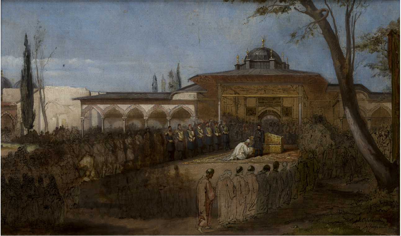
10 Stanisław Chlebowski, Sultan Abdülaziz Topkapı Sarayı Avlusunda / Sultan ile Sahne , tuval üzerine yağlıboya, 23.5x 39.5 cm., Ulusal Müze, Env. No. MNK II-a-1121, Krakov.

Osmanlı Askerlerinin Geçit Töreninde Sultan Abdülaziz başlıklı ilk reproduksiyon, sipariş edilen tabloların ilki için yapılmış bir çalışma olup sultanı, maiyeti, generaller ve askerlerle çevrili bir halde resmetmiştir. 49