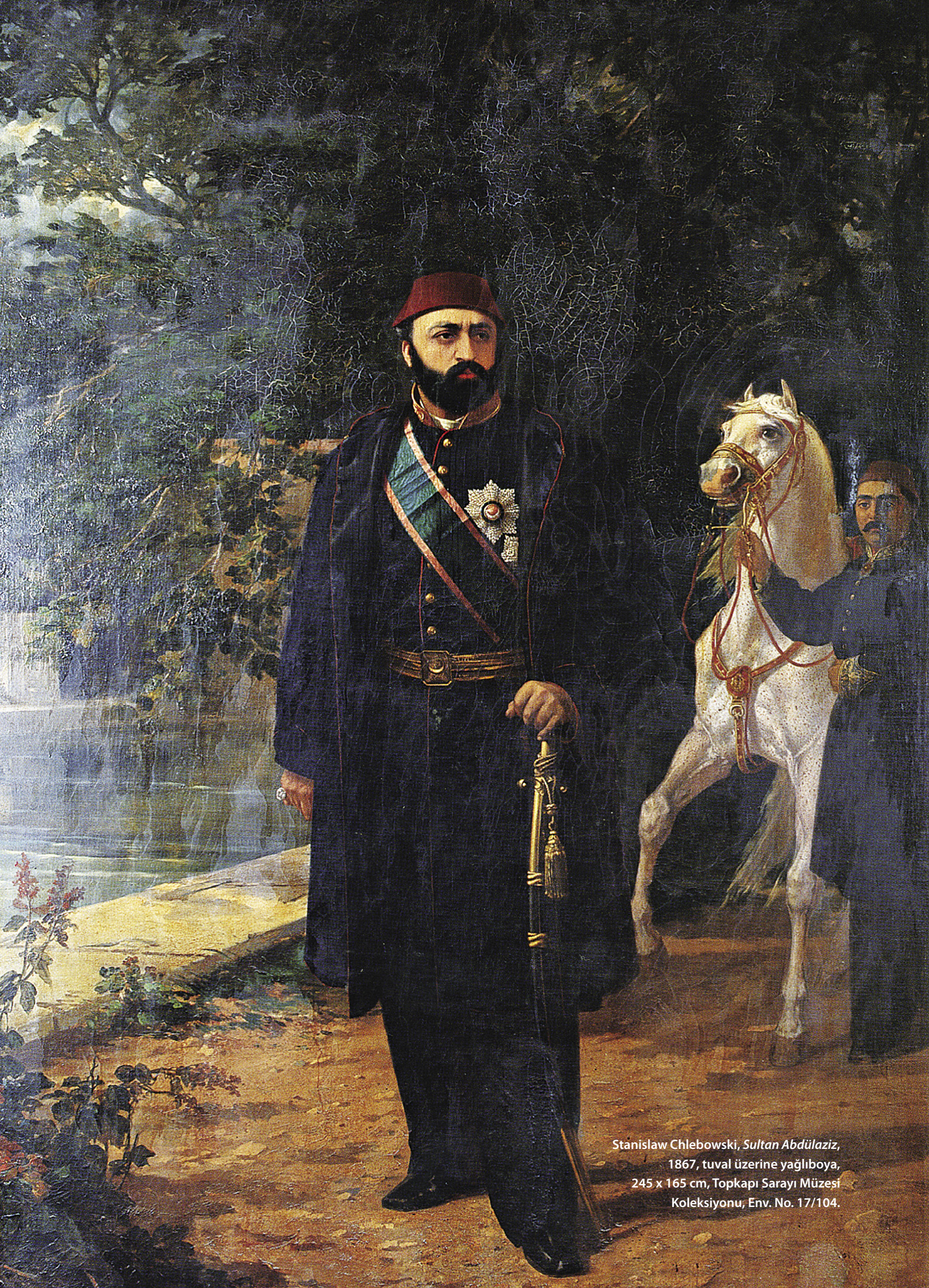
Stanislaw Chlebowski, Sultan Abdülaziz , 1867, tuval üzerine yağlıboya, 245 x 165 cm, Topkapı Sarayı Müzesi Koleksiyonu, Env. No. 17/104.