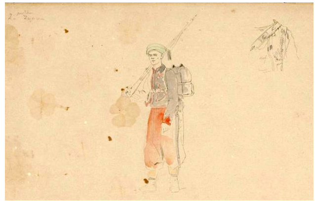
7 Stanisław Chlebowski, İkinci Alaydan Türk Piyadeleri, yak. 1865-1875, kâğıt üstüne karakalem ve suluboya, 22 x 29.3 cm, Ulusal Müze, Env. Rys. Pol. 13005/ 8, Varşova.