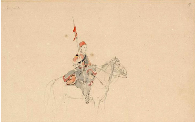
3 Stanisław Chlebowski, Türk Atlısı, yak. 1865-1875, kâğıt üstüne karakalem ve suluboya, 22 x 29.6 cm, Ulusal Müze, Env. Rys. Pol. 13005/ 4, Varşova.