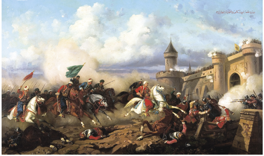
15 Stanislaw Chlebowski, Semendire Kalesi'nin Kuşatılması , tuval üzerine yağlıboya, 75.6 x 124.6 cm, Env. No. 11/1491. "Semendire Kalesi Pişgahında Ahmed Paşa Muharebesi."

Türk Ordusunun Hücumu ve Türk-Avusturya Muharebesi 'nde, yine ön planda, yüzü yere dönük halde ölmüş bir asker figürü vardır. Türklerin Semendire Kalesi'ne Taarruzu ve Türk-Yunan Savaşı tablolarında atların altında ezilen asker figürü birebir aynıdır. Sıçrayan ve boynunu öne doğru uzatan kır at figürü de sıkça görülür: Türk-Yunan Savaşı , Mohaç Savaşı , I. Mahmud Devri'nde Belgrad Kuşatması , Türk Ordusunun Hücumu , Türk-Avusturya Muharebesi , Varna Savaşı . Varna Savaşı 'nın iki versiyonunda da sanatçı düşmanı çarpışırken onu atından deviren Türk figürünü kullanmıştır. Neredeyse tüm tablolarında, arka planda dalgalı bulutlarla kaplı mavi gökyüzü, köşelerde ise savaşın tozu dumanı arasında belli belirsiz görülen bir kale vardır.