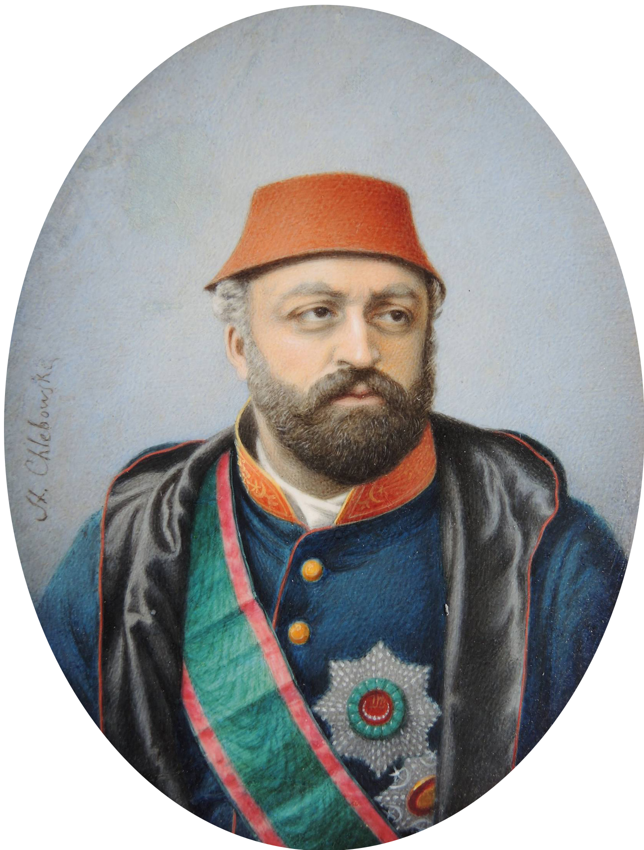
18 Stanislaw Chlebowski, Sultan Abdülaziz , kemik üzerine guaj, 10.9 x 8.5 cm., Ulusal Müze, Env. No. Min.546, Varşova.