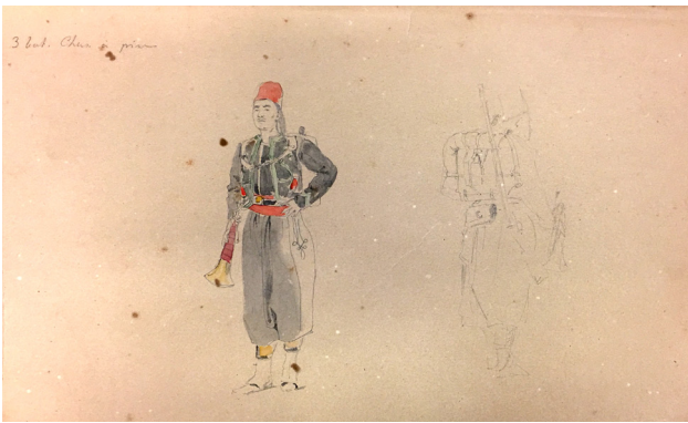
4 Stanisław Chlebowski, Üçüncü Müfrezeden Türk Borazancı, yak. 1865-1875, kâğıt üstüne karakalem ve suluboya, 22 x 29.6 cm, Ulusal Müze, Env. Rys. Pol. 13005-5, Varşova.