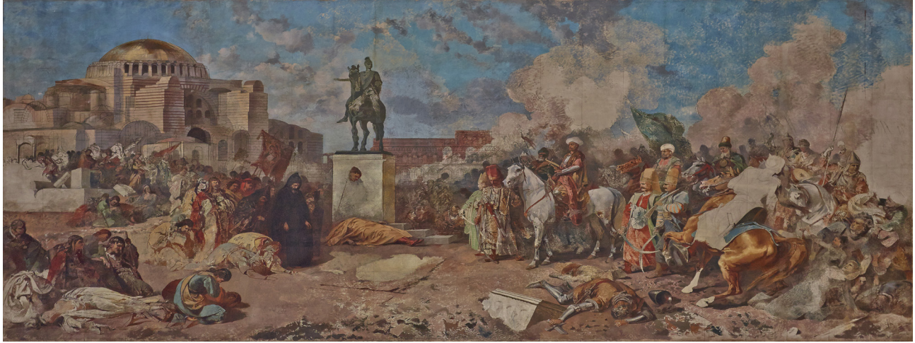
17 Stanisław Chlebowski, Fatih Sultan Mehmed'in İstanbul'a Girişi , tuval üzerine yağlıboya, 500 x 1100 cm., Ulusal Müze, Env. No. MNK II-a-72, Krakov.

resmini yapamıyorsan atların resmini yapmak zorundasın... Ne kadar yazık! 107