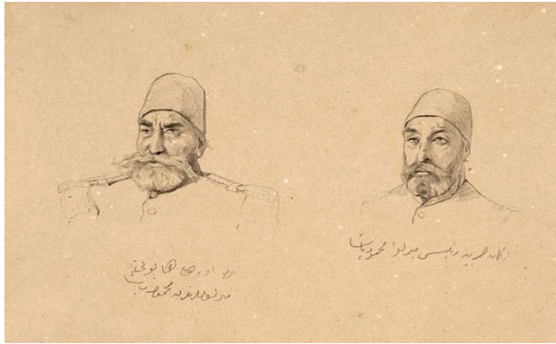
9 Stanisław Chlebowski, İki Tugay Generali, yak. 1865-1875, kâğıt üstüne karakalem, 22 x 29.6 cm, Ulusal Müze, Env. Rys. Pol. 13005/ 16, Varşova.