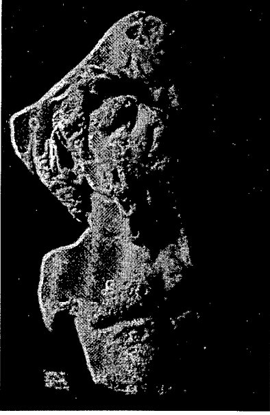
Resim 3. MARBURG Archäol. Seminar Inv. 154. Aus Dorylaion