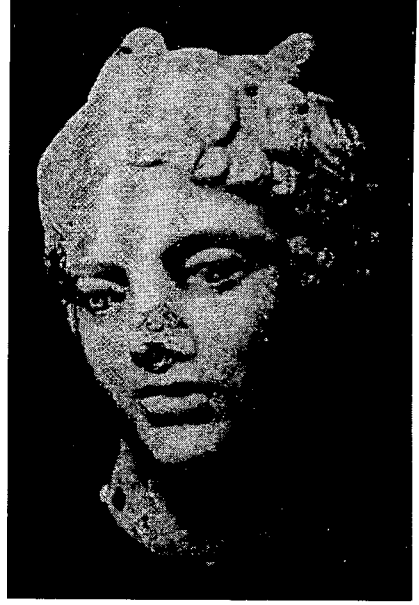
Resim 4. AFYONKARAHISAR Museum Inv. 4460. Aus Çavdarlıhisar