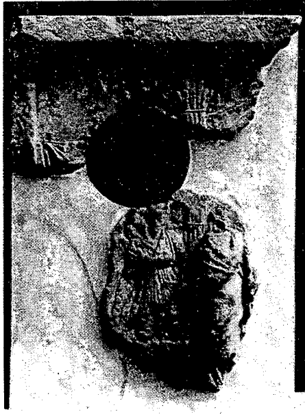
Resim 1. LONDON Britisches Museum 1344. Aus Knidos