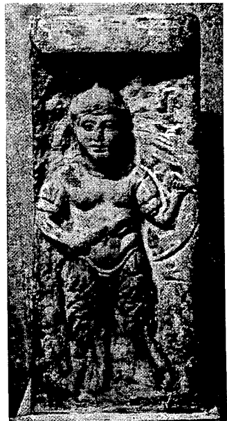
Resim 9. LONDON Britisches Museum 1369. Aus Ephesos