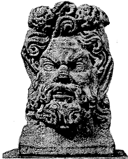
Resim 6. BERGAMA Museum Inv. 431. Aus Pergamon