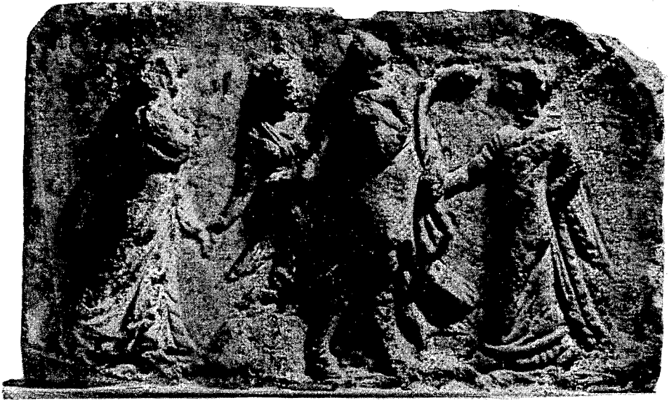
Resim 7. OXFORD Ashmolean Museum 1929. 161