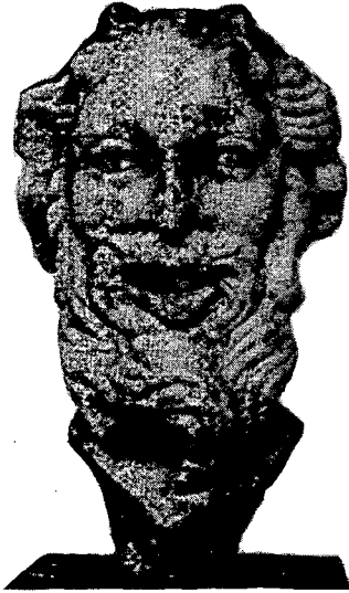
Resim 5. BERGAMA Museum Inv. 129. Aus Pergamon