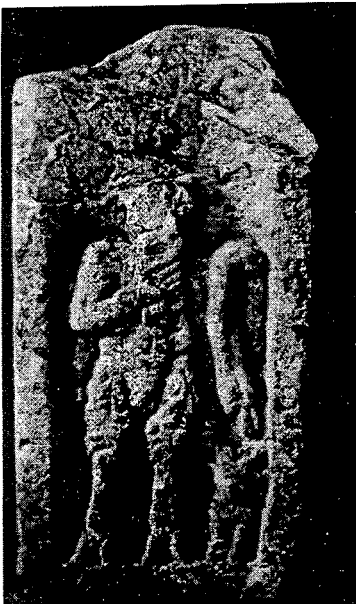
Resim 8. IZMIR Museum Inv. 208