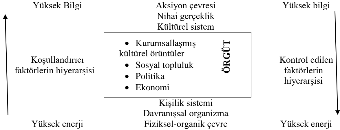
Şekil 1. Sosyal Sistemin Örgüt anlayışı 4

Genel anlamda örgütün normatif düzeni, normlar ve değerler tarafından sağlanmaktadır (Parsons ve Smelser, 1956). Normlar sosyaldır; sosyal süreçler ve ilişkiler için düzenleyici öneme sahiptir. Norm, bir davranış ya da uygulamadan beklenen bir düzey olarak tanımlanmaktadır (Baltacı, 2017). Fakat normlar, sosyal örgütlenme dışında ve özel bir sosyal sisteme uygulanabilen ilkeleri ifade etmez (Landsberger, 1961). Değerler, normlar, örüntü anlamında sosyal ve kültürel sistemlerin bağlantı ögesidir. Ayrıca örgütlenmiş nüfus yönünde birliktelik, sosyal yapının iç kategorisidir; rol ise sınır-yapı kategorisidir (Parsons, 1954).