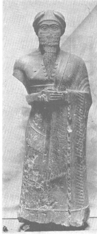
Resim : 1 Mari řakkanakı Tura - Dağan ođlu Puzur - İřtar. (İstanbul Müzesinde).

Gerçekten İstanbul arkeoloji müzesinde 7814 numarada kayıtlı bu ikinci heykelin de başı yoktu. Fakat Berlin müzesinde Babil eserleri arasındaki bir başın bu heykele ait olduđu keřfedilmiş ve böylece Puzur -İřtar heykeli tamamlanmıştı (Resim : 1). Bu heykelin üzerindeki kitabede: "Puzur-İřtar, Mari řakkanakku'su, biraderi rahip