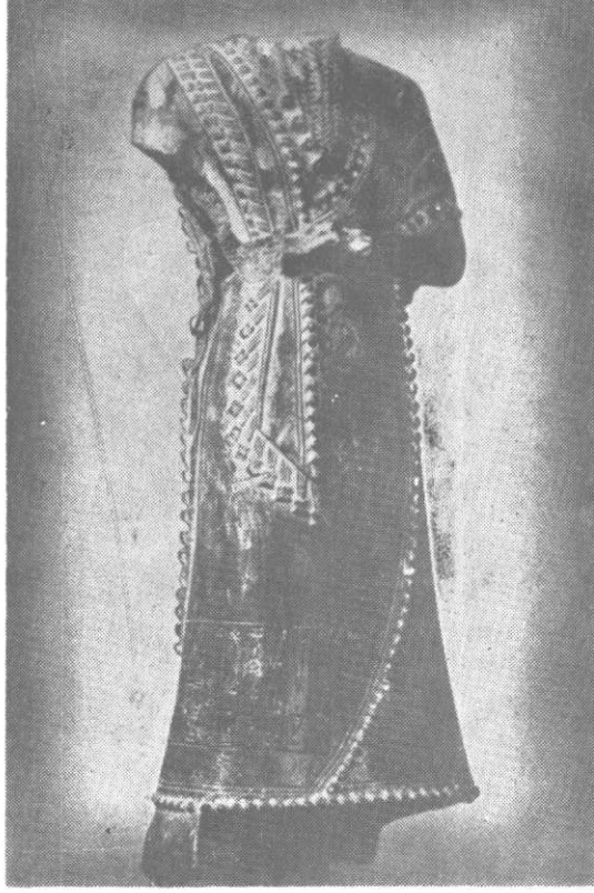
Resim : 2 İdi - Ilum, Mari Şakkanakı( Loure Müzesinde).

Dagan metinleri arasında Tura-Dagan ve Puzur-İştar adları geçmektedir 6 . Bunlardan Bur-Sin'in 5. senesine ait olan iki vesikada Tura-Dagan ve Puzur-Eştar zikredilmektedir. Gerçi vesikalarda bu şahısların Mari ile ilgili olduklarına dair bir kayıt yoktur, fakat bu vesikalar Mari valilerine ait olmasa dahi, Mari valilerinin III. Ur sülalesinden başka bir devirde Mari'de yaşamış olmalarına imkân yoktur. Çünkü III. Ur sülalesinin çökmesinden sonraki Mezopotamya tarihi olaylarını hatırlarsak, müteakip İsin-Larsa devrinde Mari de