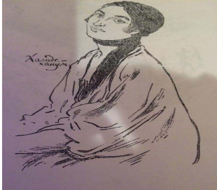
Figür 6. Lansere. Halide Edip Adivar,1922.

Başka önemli bir görüşme de Halide Edip Adivar ile gerçekleşir. Y. Lansere’nin de belirttiği gibi Büyükelçi S.İ. Aralov’un önerisi üzerine, “çok önemli bir yazar, Avrupai eğitim almış, ancak şimdi Milli Mücadele’nin savunucusu olan Halide hanımın resmini” çizmek üzere kendisiyle görüşür (Lansere 1925: 30). Çalışmasında Halide Hanım’ı, Arapça ve Farsça konuşma kalıpları ile ağırlaştırılmış geleneksel edebi dilden uzaklaşan, yalın bir Türkçe kullanan roman yazarı olarak tanıtır. Bu yazar hanımla çok kolay iletişim kurduğunu anlatan ressam, onun aslında orduda çavuş rütbesine sahip olduğunu da açıklar. Halide hanımın eşi Meclis-i Mebussan ikinci başkanı Adnan Bey’le şehir dışında bir konakta oturduklarını anlatan ressam, evlerini de ziyaret eder. Evlerinde ortamın sade, ancak kitapların, minyatürlerin ve tabloların bol olduğu bir düzenden söz eder. Böylece ressamın her ortamdaki bir evin tasvirini yaptığı anlaşılır.