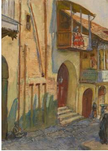
Figür 1. Lansere, Ankara Evleri, 1922.

Sanatçı notlarında “ahşap işleri, ahşap oymalar, korniş ve tavanlarda gördüğü işçiliğin mükemmel olduğunu” da vurgular (Lansere 1925: 26). Hat sanatının estetiğini ve hat ustalarının yaratıcılığını da övgü dolu sözlerle anlatır. Y. Lansere’nin Ankara’da esnaf çarşısında gördüğü yün eğirme işlerinden, yine burada kervan yolculuklarına hazırlan eyerlerden, silah dökümhanelerinden, gümüş kaplı takunyalar ve dokuma atölyelerini de anlatmış ve resmetmiş olması bu dönemde, Ankara halkının geçim kaynakları konusunda bize bilgi vermektedir. Bunların yanı sıra Lansere, Türk halkının çalışma azmini övgüyle vurgularken “cuma günleri de çalışmaların devam ettiğini” belirtir (Lansere 1925: 18). Ancak “Timurlenk’ten bu yana düşman saldırısına neredeyse hiç uğramamış olan bu şehirde sevimli süs eşyalarına, süslü mobilyalara, lüks binalara rastlamak neredeyse olanaksızdır, her şey çok sade ve masrafsızdır” (Lansere 1925: 18). (Figür 2)