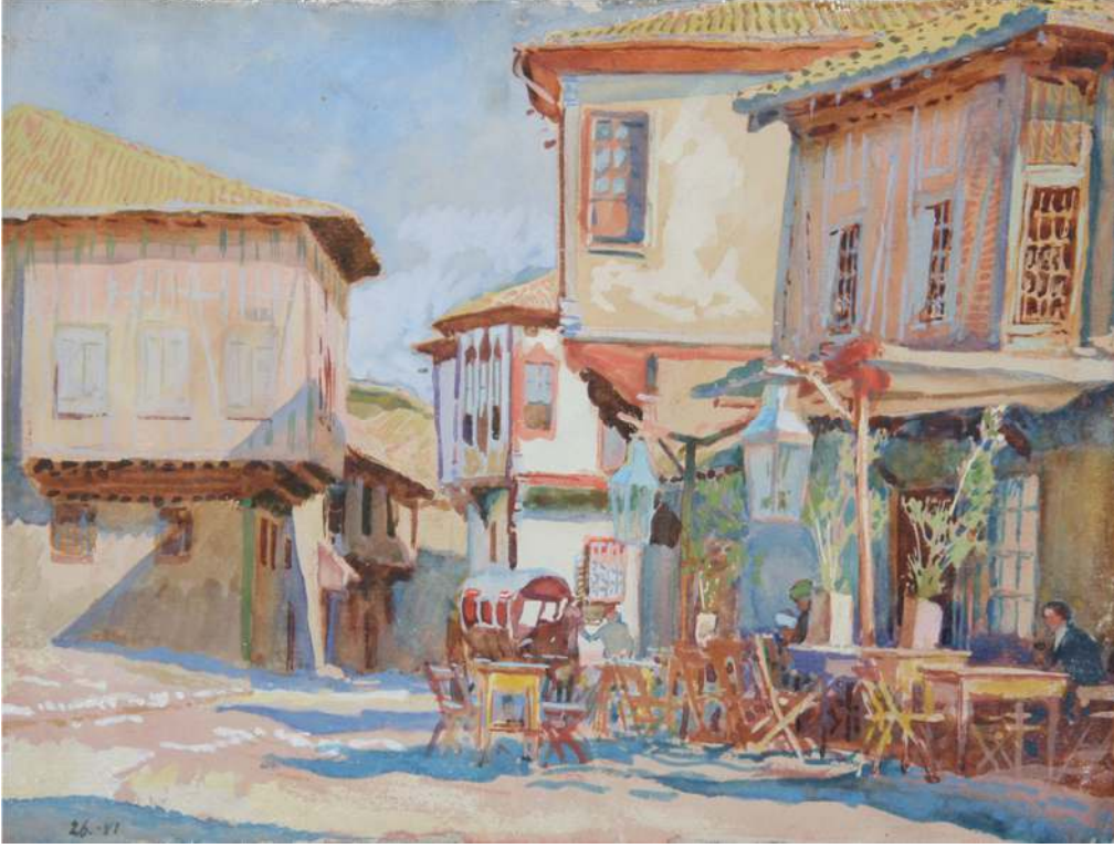
Figür 4. Lansere, Ankara. Sefaret Önünde Bir Çayhane, 1922.

Lansere resimlerinde olduğu gibi notlarında da çayhane (“Çay-hana”) olarak geçen kahvehanelerde çay içme geleneğini, mekânın ziyaretçilerini en ince ayrıntılarıyla tasvir eder. Ayrıca nargile köşesinden ve Türk kahvesi ikramının özelliğinden de söz ederek, şöyle bir sonuca varır: “Çayhanelerde bu ufacık masaların etrafında Türk geleneklerinin sade ve içtenlikli eşitliğini görürsünüz: köylü ve paşa yan yana otururlar”(Lansere 1925: 23). (Figür 4)