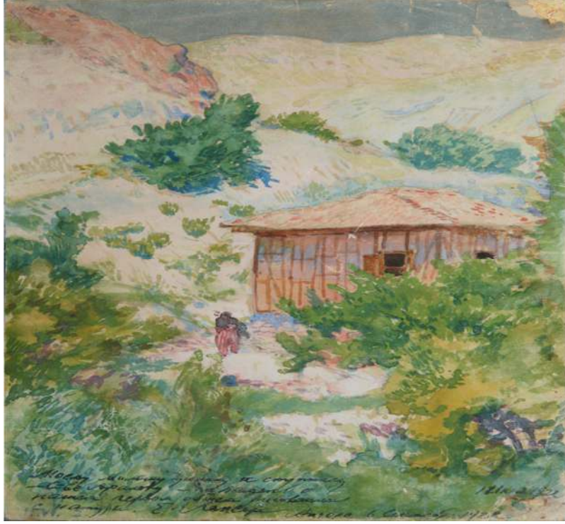
Figür 3. Lansere, Ankara Yakınlarında Bir Ev, 1922.

Toplantıların, tartışmaların yapılmadığını, dernek ve kulüplerin burada olmadığını, son sinema yerinin ise yangında yok olduğunu açıklayan sanatçı, “Avrupalı tarzda bir toplumsal yaşamın” henüz Ankara’ya yerleşmediği sonucuna varır (Lansere 1925: 18). Adeta köy sessizliğinin hâkim oldu bu şehirde, Lansere’yi hayrete düşüren olay, sinema ve tiyatro gösterilerinin gece saat 22.00 ya da 23.00 gibi geç bir saate başlayıp gece yarısı bitmesidir. Kadınların bu tür sosyal etkinliklerde yer almamaları da onu şaşırtmıştır. Lansere’nin Ankara’nın o sıcak, sade, huzurlu ve hala yeniçağın o yoğun gidişatına ayak uydurmamış olan havasından çok etkilendiği anlaşılır. (Figür 3)