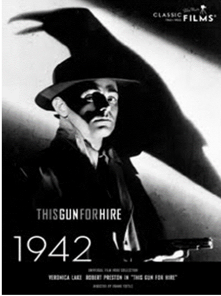
Şekil 1. THISGUNFORHIRE Film Afışı