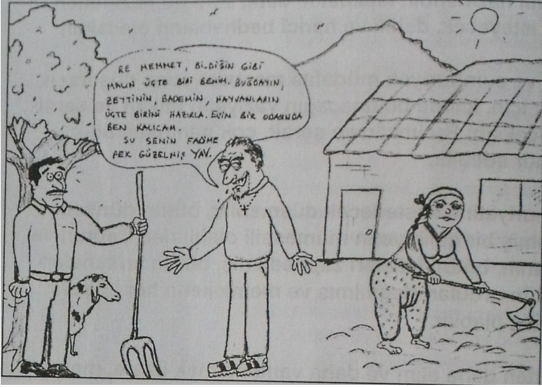
Volkan, 20 Nisan (12. sayfa)

Yukarıdaki karikatürde gündelik hayatın rutinleri içerisinde ev içi görevlerini yerine getirirken gösterilen kadın, aşağıdaki karikatürde de bu rolüne referu vurgu ile temsil edilmektedir. Farklı ideolojik yönelimleri olan her iki gazete de, bu karikatürlerde, referandumda 'evet' ya da 'hayır'ın desteklediği farklı söylemsel bağlamlardan kadını, özel alana hapseden ve gündelik rolleri içinde tanımlayan eril bir üslupta birleşmektedir.