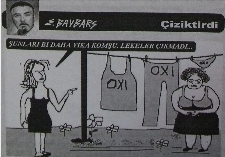
Afrika, 28 Nisan (2. sayfa)

Yukarıdaki karikatürde gündelik hayatın rutinleri içerisinde ev içi görevlerini yerine getirirken gösterilen kadın, aşağıdaki karikatürde de bu rolüne referu vurgu ile temsil edilmektedir. Farklı ideolojik yönelimleri olan her iki gazete de, bu karikatürlerde, referandumda 'evet' ya da 'hayır'ın desteklediği farklı söylemsel bağlamlardan kadını, özel alana hapseden ve gündelik rolleri içinde tanımlayan eril bir üslupta birleşmektedir.