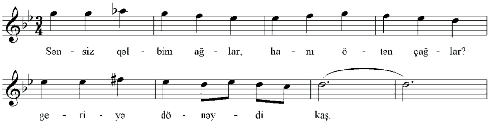
Nota 5: Tamamlayıcı tonda gerarlaşma