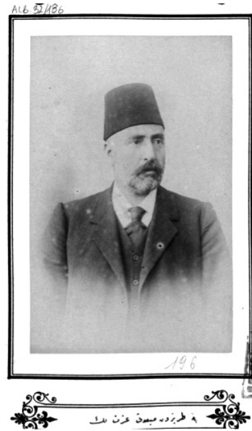
Resim 2: Trabzon Mebusu İzzet Bey. İBB Atatürk Kitaplığı Albümler, ALB. 32/186