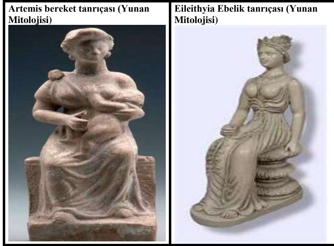
Resim 4-03/04: Yunan Tanrıçaları: a) Artemis, b) Eileithya

Her işlev için sorumlu Tanrıçalar tanımlanmıştır