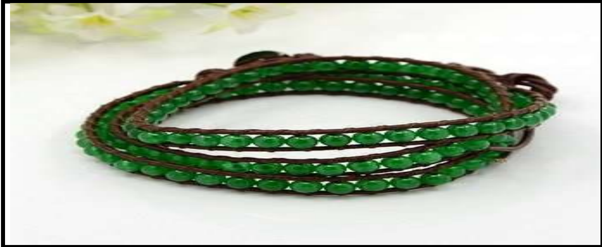
Resim 4-02: Yeşim taşı bileklik Tanrıların merhamet ve adaletinin simgesi

Yeşim Taşının önemli simgesi; merhamet ve adalettir