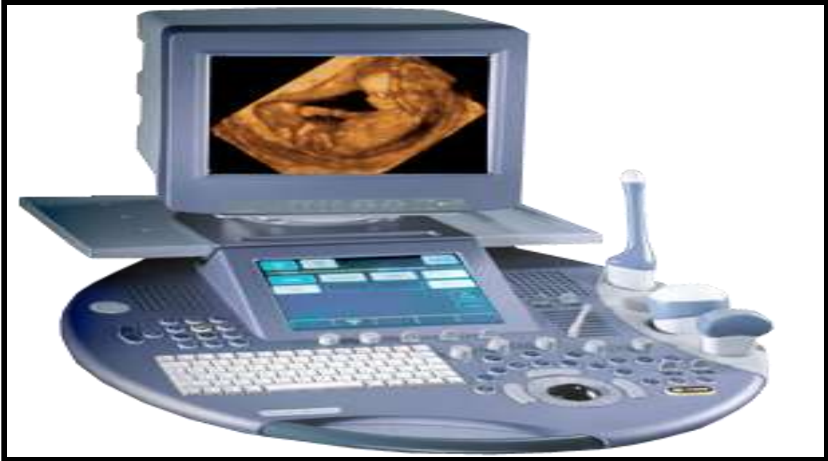
Resim 4-09: Obstetrik ultrasonografide günümüz 3D-4D cihazlar