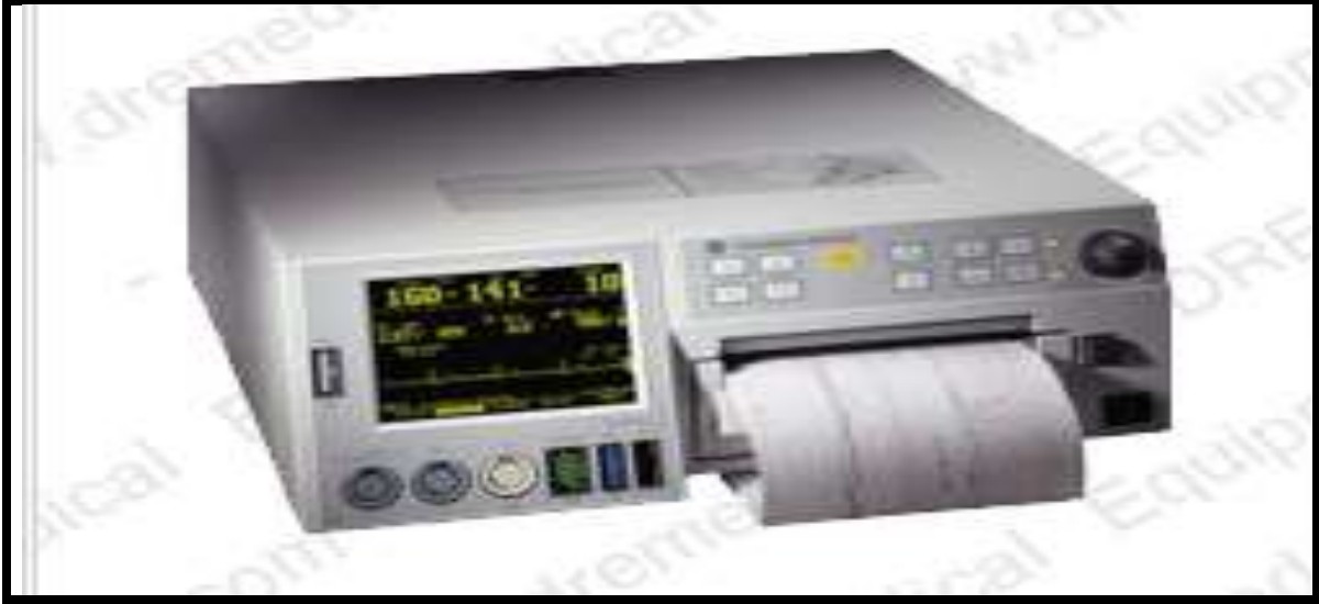
Resim 4-08: Fetal monitör