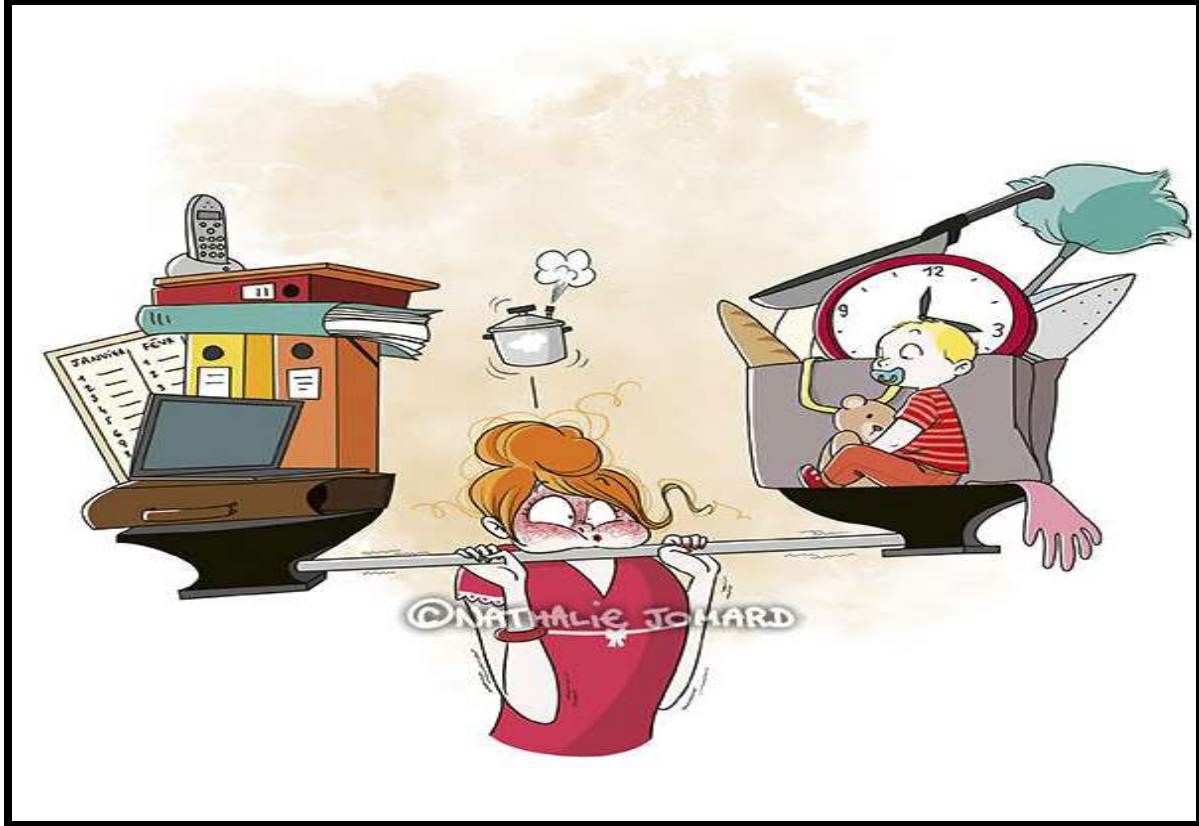
Resim 4-10: Milenyum savaşçı annesi