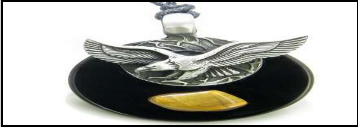
Resim 4-01: Kartal amulet yeniden doğuşun simgesi

Kartal amulet simgesi; yeniden doğuş anlamındadır