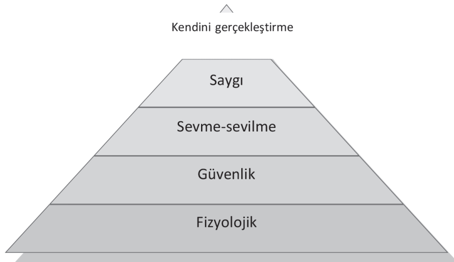
Şekil 1. Maslow'un ihtiyaçlar hiyerarşisi piramidi

önemini yaşlılık döneminde de korumaktadır. Ancak yaş ile birlikte bu ihtiyaçlar şekil ve yer değiştirebilmektedir. Biyolojik yaşlanma ile birlikte ortaya çıkan fizyolojik değişimler, bu farklılaşmanın temelinde yatan belirgin bir unsur olmaktadır. Zira bu dönemde vücut organlarında ve sistemlerinde yapısal ve işlevsel değişimler oluşmakta, kas hücrelerinde kayıplar meydana gelmekte ve yağsız vücut kütlesi azalmaktadır (Danış, 2004; Yapıcıoğlu, 2009). Birçok eklemde meydana gelen dejeneratif değişiklikler ve kas kütlesi kaybı nedeniyle yaşlılar yavaş hareket etmeye başlayabilmekte ve yürüme zorlukları yaşayabilmektedirler (Boss ve Seegmiller, 1981; Güler ve diğ., 2009). Bu nedenlerle yaşlılıkta sağlık ihtiyaçları ön plana çıkmaktadır. Beslenme, uyuma, dinlenme ve güven içinde olma gibi temel ihtiyaçlarının karşılanması biçimi de yaşlı bireyin koşullarına bağlı olarak değişiklik göstermektedir. Bu noktada sağlık hizmetlerine erişim, uygun barınma koşulları ve yaşam alanlarının yaşlı bireyin yaşamını kolaylaştırıcı bir biçimde düzenlenmiş olması önemli bir