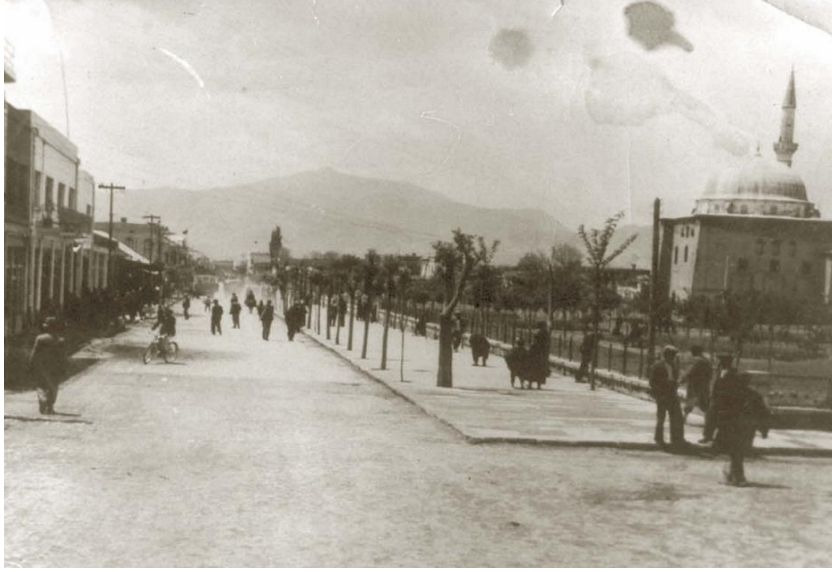
Şekil 3. Vali-Belediye Başkanı Nazmi Toker'in Genişlettiği İstanbul Caddesi (Karakaya, 2006).

İkinci ağırlık verdiği imar uygulaması ise meydanların düzenlenmesi olmuştur. Bu amaçla Cumhuriyet Meydanı'nın (Şekil 6) çevresindeki yapıları yıktırılmış ve meydanı oldukça genişletmiştir. Bu meydana 1 Mart 1935 tarihinde bir Atatürk heykeli diktirmiştir (Şekil 4). Kentin sinema ve toplantı salonu gereksinimini karşılamak üzere 1934 yılında meydana Tan Sineması'nı inşa ettirmiştir. Meydanda halkın oturması için sinemanın etrafında Tan Bahçesi'ni yaptırmıştır. Ayrıca Kurşunlu Camisi'ni de ortaya çıkaracak şekilde, Cumhuriyet