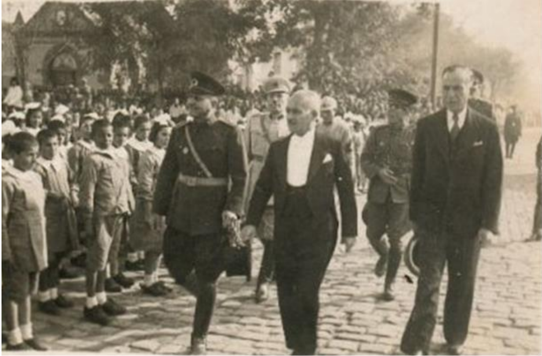
Şekil 1. Bastonlu Vali-Belediye Başkanı Nazmi Tokar Bir Tören Sırasında (Karakaya, 2006).

Belediye yönetiminde bir buçuk yıldır yaşanan sorunu gidermek ve Kayseri kamuoyunun imar beklentisini ivedi olarak çözüme kavuşturmak üzere Dâhiliye Vekâleti belediye başkanlığı görevini 28 Mayıs 1933 tarihinde Vali Nazmi Bey'in uhdesine vermiştir (Şekil 1). Nitekim valilik ve belediye başkanlığı yetkilerinin aynı kişide toplanması, Ankara'da ve İstanbul'da başarı ile denenen bir yönetim şekliydi.