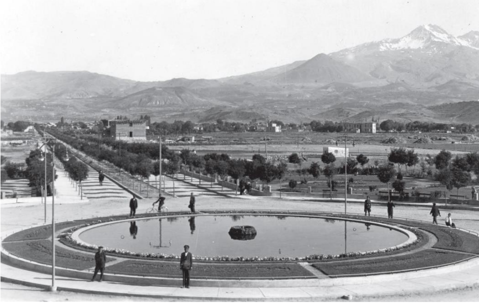
Şekil 5. İstasyon Meydanı ve Atatürk Bulvarı 1938 (Karakaya, 2006).

Nazmi Toker'in imar uygulamalarının üçüncü dikkat çeken yönü modern binalar yapılması için imar parselleri oluşturmasıdır. Kayseri Belediyesi 1933 tarihli 2290 sayılı "Belediyeler Yapı ve Yollar Kanunu" ile 4 Haziran 1934 tarihli 2497 sayılı "Belediyeler İstimlak Kanunu"nun özellikle 17. maddesinin sağlamış olduğu geniş haklardan yararlanmıştır. Bu kanunlar çerçevesinde, yeni açtığı yolların üzerindeki adalarda ve parsellerde yirmişer metreye kadar binalı ve binasız yerleri kamulaştırmaya gitmiştir. Kamulaştırılan yerlerde planda belirtilen geometrik şekle göre yeni imar parselleri meydana getirilmiş ve bu parseller satılarak belediye kasasına önemli miktarda gelir sağlanmıştır.