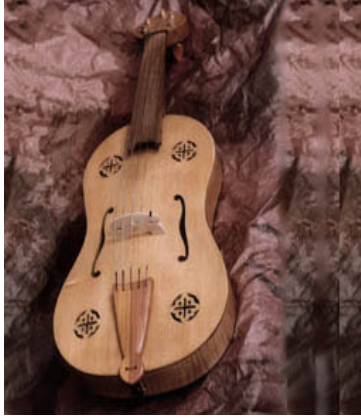
Resim 4- Fidel

yakındır. Armuda benzer bedeni, kabarık kapakları vardır. 3 teli olan gudokun akordu söyle idi: tonik, kvinta ve düodesima. Bir kural olarak tema yukarı telde çalınmaktadır. O zaman aşağı tel eşlikçilik görevi yapıyordu.