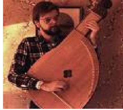
Resim 2- Bandura Çalan Müzisyen