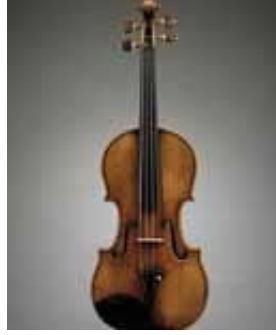
Resim 6- A. Stradivarius kemanı.

İlk keman bestecileri Venedikli Giovanni Gabrieli “Sonat”, Karlo Farina , “Kapricio”, Giovanni Legrensi , “Trio Sonat” bestecileriydi. Diğer ünlü besteciler Bolonyalı Giovanni Battista Vitali, “Chacona” eseri, Giuseppe Torelli ilk keman konçertoları ve Antonio Korelli “ Foliya” eseri ile tanınmaktadır.