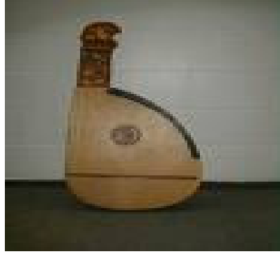
Resim 1- Bandura