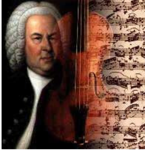
Resim 7- Ünlü Alman Besteci J.S. Bach (1685-1750)