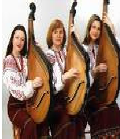
Resim 3- Bandura Çalan Kadınlar

Avrupalılar ilk defa 9. ve 11. yüzyılda yaylı aletler ile tanışmışlardır. Bunun ardından Avrupa müziği, Doğu Arap müzik aletlerini kapsayarak kendi parmakla çalınan telli aletlerinde yayla ses tarzı, ses yorumu kullanmaya başlamışlardır. 1100'lü yıllara doğru telli yaylı aletler Avrupa'da çok yaygınlaşmıştır. Değişik ölçüleri olan telli-yaylı çalgılar değişik isimler altında tanınmaya başlamıştır. İtalya ve Fransa'da "viyola", Almanya'da "geygel" Polonya da "gensle", Rusya'da "smık-gudok" isimli çalgılar oluşmuştur. Bunun ardından viyola keman ailesinden olan Fidel ve rebek meydana çıkmıştır. Fidel 5 telli, iri delikleri olan viyola tipli alettir. Rebek ise armuda benzer bedeni, salyangoz kafası, 3 teli vardır. Rus gudok'u eski yaylı alettir, rebeğe daha