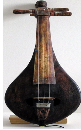
Resim 5- Rebek

13. yüzyılda viyola sanatı daha da gelişmiştir. Saraylarda saray Fidelleri orkestrası önemli rol oynamaya başlamıştır. O kadar ünlenmişti ki, özel Fidel okulları açılmıştır. Yay tutuşu biraz farklıydı, genel olarak yayı avucun içinde çok sıkı tutuyorlardı. Bu yüzden çok kaba ses çıkıyordu.