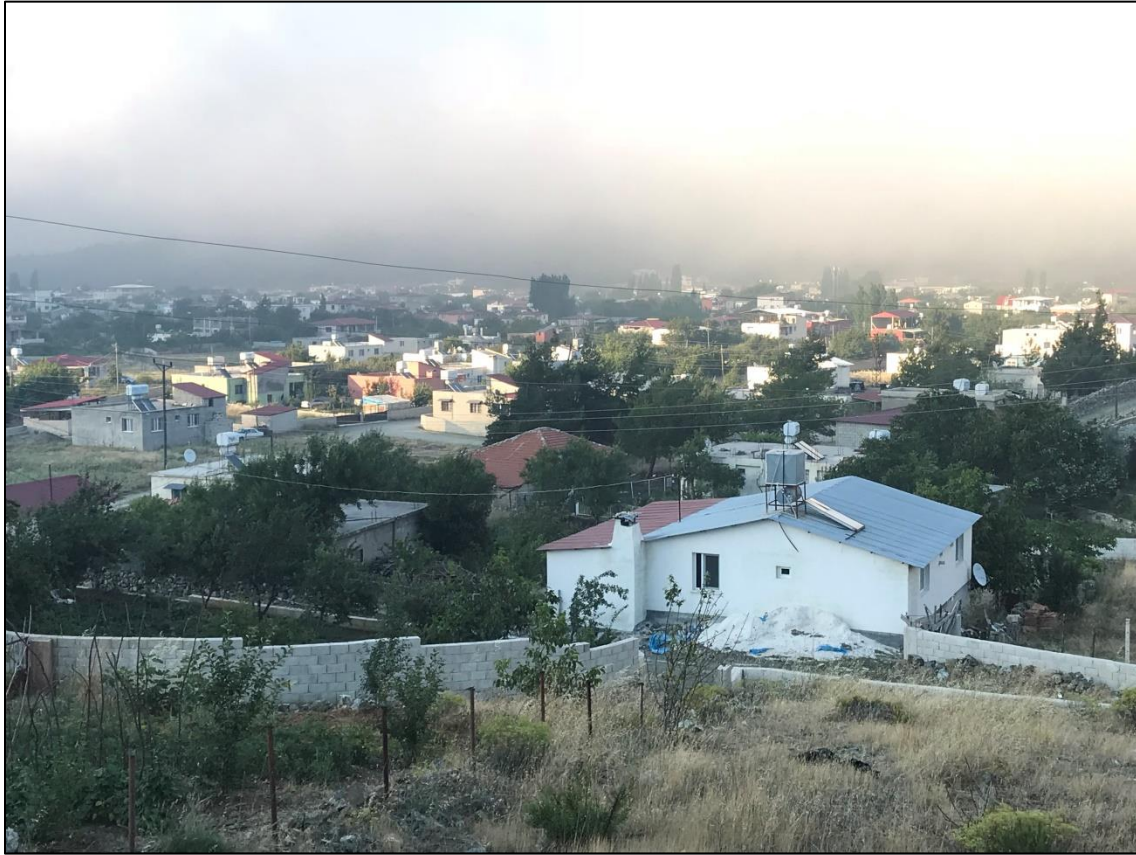
Fotoğraf 3. Kırıkhan İlçesi'nde En Önemli Yayla Sahası Olan Alan Yaylası'ndan Bir Görünüm.

günümüzde hayvancılık faaliyetlerinin yanı sıra turizm açısından değerlendirilebilecek ölçüde potansiyeli olan alanların başında gelmektedir. Sahada turizm amacıyla değerlendirilen yayların başında Alan gelir. Alan Yaylası yöre insanı tarafından sık kullanılan bir yerdir. Yaz aylarında bunaltıcı sıcağın kurtulmak isteyen yöre halkı bu yaylada bulunan konutlara yerleşmektedir. Yöre halkı dışında turistler için yaylada geçici konaklama alanları oluşturulmuştur. Turistlerin konaklama şekli daha çok kamping şeklindedir. Yaylada yaz aylarında artan nüfusun ihtiyaçlarının karşılanması için küçük dükkanlar da bulunmaktadır.