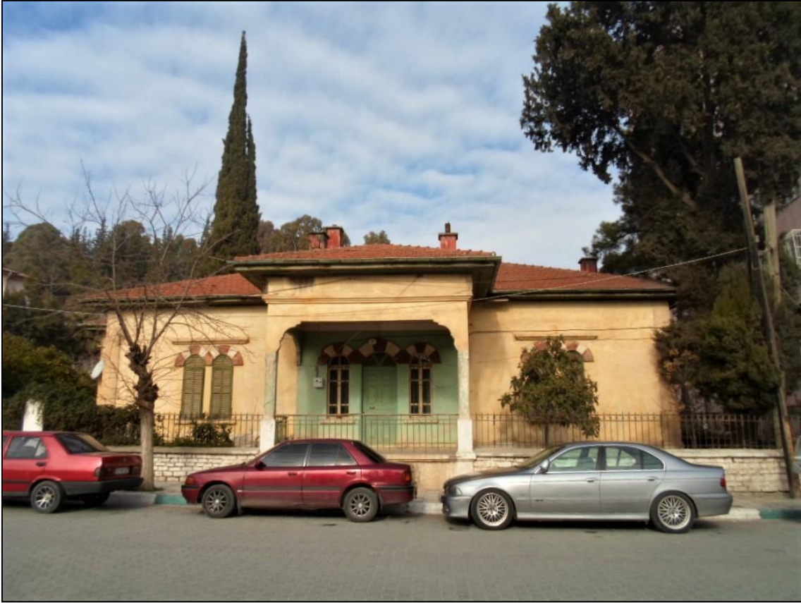
Fotoğraf 9. Kırıkhan Kentinde Taş Örgü Duvarlı ve Tek Katlı Olan Arife Reşaoğlu Konağından Bir Görünüm.

pencere üzerleri kesme taşlarla kemer oluşturularak örülmüştür. Alt katın ön cephesinde dört, üst katta ise iki pencere yer almaktadır. Binanın dış cephesi sarı renk ile boyalıdır. Turhan Vural Konağı iki katlı betonarme, ahşap çatı örtüsü üzerine kiremit kaplıdır. Alt kat iş yeri üst kat ise konut olarak kullanılmaktadır. Ön cephede bulunan giriş ahşap bir kapı ile sağlanmaktadır. İkinci katın ön cephesinde bir adet balkon ve dışa bakan dört adet penceresi bulunmaktadır. Binanın yan cephelerinde küçük pencereler yer alır.