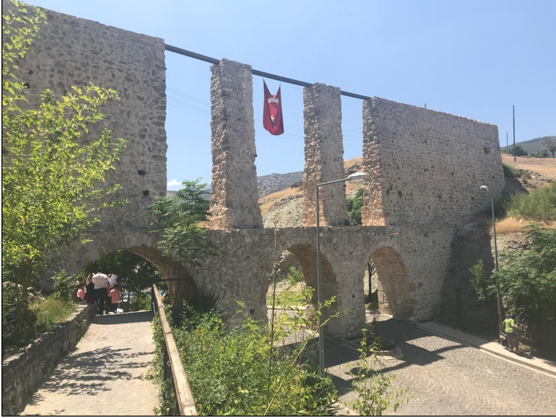
Fotoğraf 7. Alaybeyli Köyü'nde Yontma Taştan Yapılan Su Kemerlerinden Bir Görünüm.