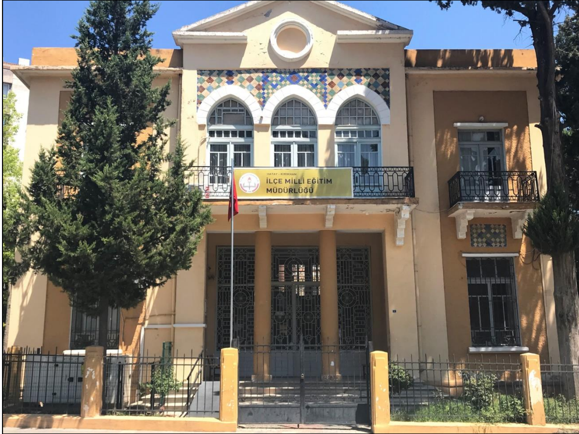
Fotoğraf 10. İlçe Milli Eğitim Müdürlüğü'nün Kurtuluş Mahallesi'nde Bulunan Tarihi Binasından Bir Görünüm.

olup taştan yapılmış kare planlıdır. Yuvarlak iki sütün antreye girişi sağlamaktadır. Alt kata dört basamaklı merdivenlerle çıkılırken, üst katta sofanın üzerindeki balkona kemerli üç kapıyla çıkılmaktadır. Kemerli kapıların üzerinde üçgen alınlık, ortada yuvarlak bir pencere, balkonun iki yanında kapılar ve küçük balkonlar vardır. Alınlığın altında mavi, sarı, yeşil kahverengi karo süslemeler vardır.