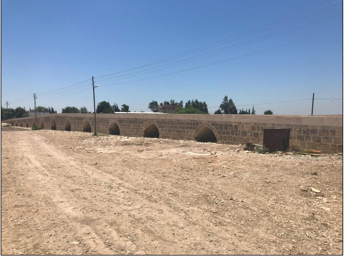
Fotoğraf 8. Kırıkhan-Reyhanlı Yolu Üzerinde Bulunan Muratpaşa Köprüsü'nden Bir Görünüm.