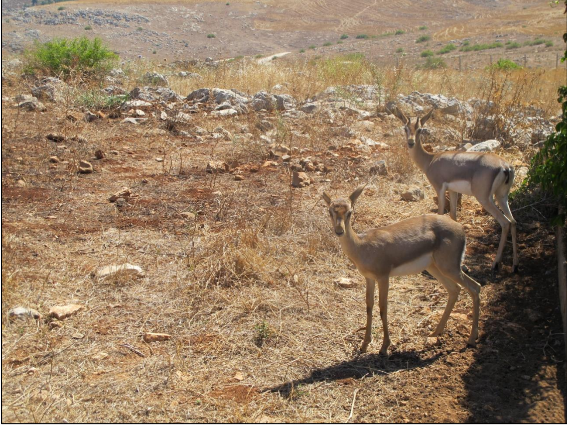
Fotoğraf 4. İncirli Köyü Beşikli Tepe Mevkiindeki Hatay Dağ Ceylanı Üretim İstasyonunda Bulunan Gazella Gazellalardan Bir Görünüm.

mevkiinde 160 dekarlık alan üzerinde Hatay Dağ Ceylanı Üretim İstasyonu Orman ve Su İşleri Bakanlığı Doğa Koruma ve Milli Parklar Genel Müdürlüğü tarafından kurulmuştur. İstasyon içerisinde 3 adet su yatağı, yem deposu, bekçi kulübesi bulunmaktadır. İstasyonda üretilen ceylanlar tekrar doğal ortamlarına salınarak nesillerinin devam etmesi sağlanmaktadır.