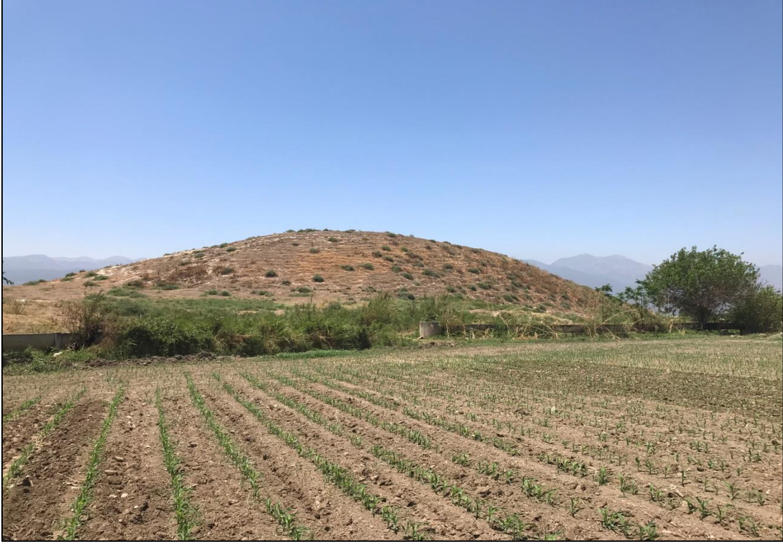
Fotoğraf 5. Çamsarı Köyü'nün Yusuflu Mezrasında Yer Alan Yusuflu Höyüğünden Bir Görünüm.

ilçesinde 26 höyük 1. Derece arkeolojik sit alanı statüsünde değerlendirilerek koruma altına alınmıştır. Ancak bazı höyüklerin çevresinde defineciler tarafından kazı çalışmaları (Ambar Höyüğü), bazılarında ise tarımsal ve hayvancılık faaliyetleri yapılmaktadır (Arpalı Höyüğü). Yusuflu Höyüğü , Çamsarı köyü Yusuflu Mezrasında yer almaktadır. Tepe Kısmında metruk bir binanın bulunduğu höyük 10 m. yüksekliktedir.