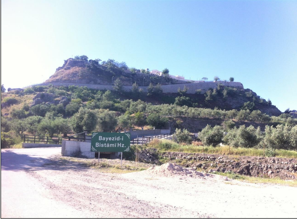
Fotoğraf 6. Bayezid-i Bistami Hz. Türbesinin de Bulunduğu Darb-ı Sak Kalesi'nden Bir Görünüm.

Darb-ı Sak Kalesine kuzey-batı istikametinden su getirmek için su kemerleri yapılmıştır. İki katlı olarak yapılan kemerlerin birinci katının yüksekliği 4 m. genişliği ise 2 m. Su kemerlerinin ikinci katı 6-7 m. arasında değişen yüksekliği sahipken genişliği 3 m.dir. Yontma taştan yapılan kemerlerin birinci katı tamamen sağlam ve korunmuşken, ikinci katın olduğu bölümde çeşitli tahribatlar bulunmaktadır. Araştırma sahasında turizm değeri olan Gözetleme Kulesi ve Nekropol Alanı Bozkayalar Tepesi'nin doğusunda yer alır. Roma Dönemine ait olan yapı moloz taş örgülü, kireç harçlı yaklaşık 1 m. kalınlığındaki sur duvarları kuzey ve güney yönünde uzanmaktadır. Duvar kalınlığı 120 cm. olan yapının giriş bölümü güneydoğuya bakmaktadır. Nekropol alanının içinde Roma Döneminden kalma bir mezar da bulunmaktadır. Sahada bir diğer turistik değere sahip olan beşerî unsurda kaya mezarlarıdır.