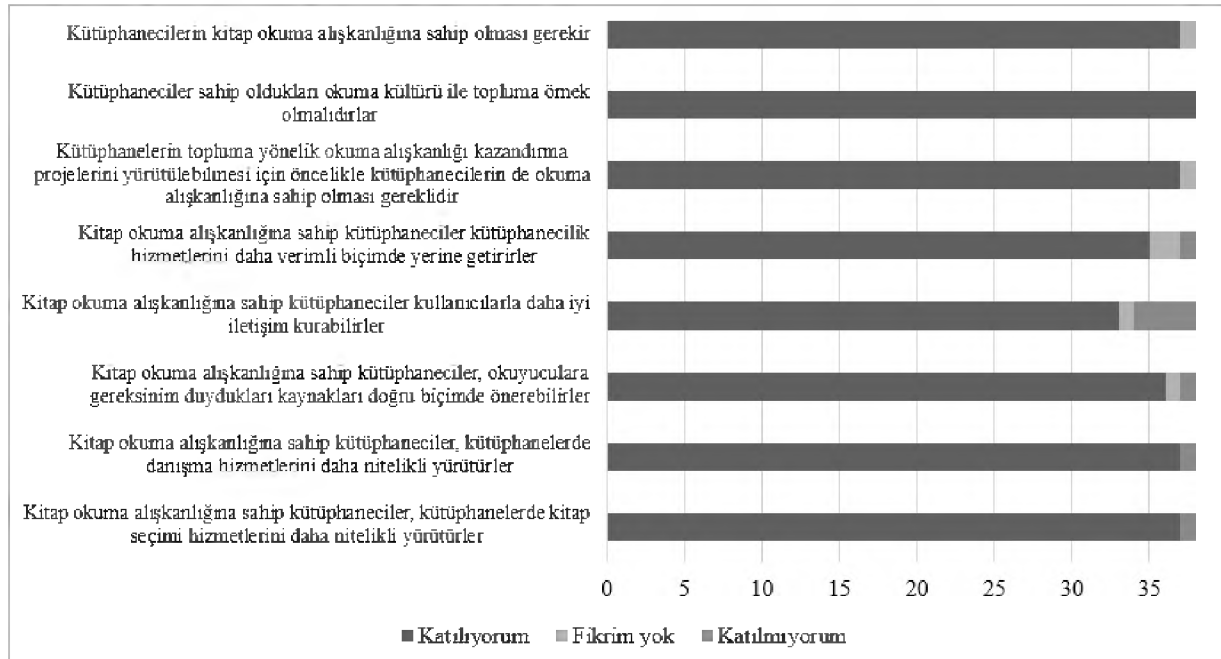
Şekil 3. Okuma Alışkanlığının Mesleğe Katkısı