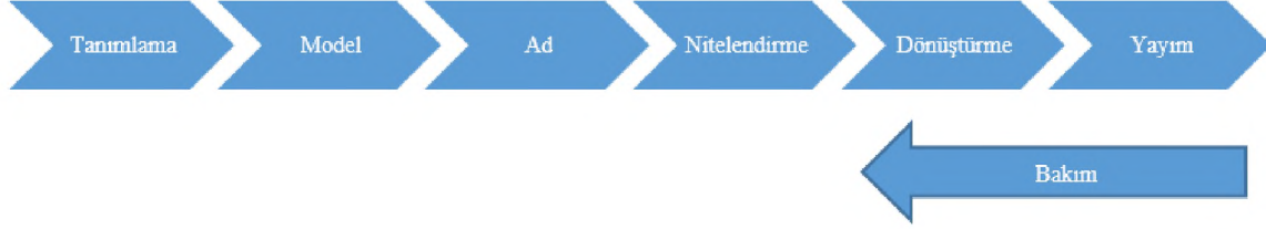
Şekil 2. Tipik Bir Bağlı Veri Üretim Süreci (Hyland ve Wood, 2011, s.11)

Öte yandan 2011’de W3C Kamusal Bağlı Veri Çalışma Grubu (The W3C Government Linked Data Working Group), ülkelerin ellerindeki bilgiyi W3 tarafından geliştirilen bağlı veri yapılarını kullanarak yayımlayabilmelerini desteklemek amacıyla kurulmuştur (World Wide Web Consortium, 2011). Çalışma grubu web tabanlı ortak tanımlama kriterleri geliştirme faaliyetlerini sürdürmektedir. Bu kapsamda elektronik ortamda bilgi içerikli kültür mirası niteliğindeki içeriğin web tabanlı sistemlerde tanımlanmasında yukarıda yer alan adımların takip edilmesi ve ortak standartlara uyumlu platformlar geliştirilmesi önemli görülmektedir.