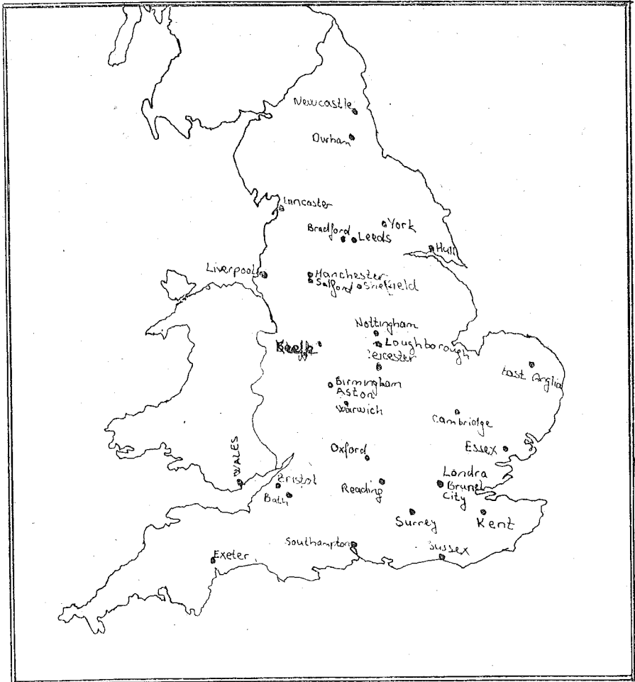
İngiltere ve Galler Bölgesindeki Üniversitelerin Dağılımı