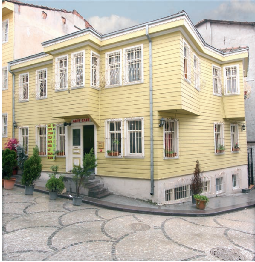
Kayserili Ahmet Paşa Sokağı'nda betonarme rekonstrüksiyonu yapılmış olan bir SMÖ

Kurulu'ndan onaylı restorasyon projesi bulunan ve bu proje doğrultusunda (veya projesine aykırı da olsa), yerinde 660 sayılı İlke Kararı'nda tanımlanan rekonstrüksiyon prensiplerine aykırı olarak, betonarme uygulama yapılmış bu-