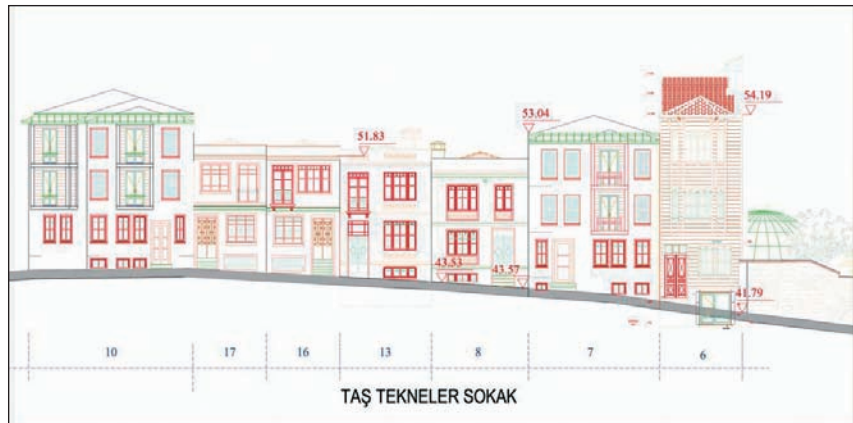
Avan proje kapsamında Taş Tekneler Sokağı Silueti