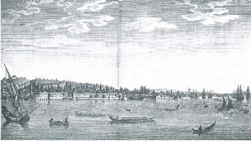
Resim 2. Aynalıkavak (Voyage Pittoresque de Constantinople, 1969)

çizilmesi, tasvirlerinin çıkarılması uygun bulunmuştur. Tersane binasının boyutları çok büyük olacağından, sonradan “şurası şöyle olmalıydı” denmemesi için, her bir alan ve mekânın denetlenmesi sözlü olarak reis efendiye tembih edilmiştir. Resmin hazırlattırılması görevi nazıra verilmiş olduğundan, nazır resmi çizdirerek tamamlatmıştır (BOA., HAT., Dosya no:113, Gömlek no:4538). Tersane'nin Hasköy'e doğru genişletilmesi için yıktırılan Aynalıkavak Sarayı, eskisinden daha küçük boyutlarda dönemin moda mimarlık üslubu olan Rokoko tarzında yeniden inşa edilmiş 18 ve adı Hasbahçe köşkü olarak anılmıştır (Koçu 1960: 1615) (Resim 2). Küçük Hüseyin Paşa'nın girişimleriyle Tersane'yi çevreleyen eski duvarlar ve kasrın yıkılması ile Tersane'nin genişletilmesi, Tersane işçileri ile Kasımpaşa'daki denizciler arasındaki iletişimin artmasını da sağlamıştır (Zorlu 2010: 229-230). III. Selim'in askerî amaçlarla çağa uygun Tersane binası inşa etme isteği doğrultusunda sivil mimariye ait bir yapıyı ortadan kaldırarak alanı genişletmesi, askerî amaçlara hizmet eden yapıların inşasına öncelik verdiğini bir kez daha göstermektedir. Bununla birlikte, kıyıda Tersane çalışanları ile Kasımpaşa'daki denizciler arasında mekânsal bağ kurulmasını sağlayarak, askerî alana ait kararlarla kentteki biçimlenmeyi oluşturmuştur.