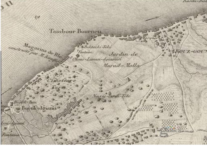
Harita 2. F. Kauffer'in İstanbul Planı. Bazı detaylar ve açıklamalar ile Barbié Du Bocage tarafından zenginleştirilmiştir. Yıl: 1817, ( http://gallica.bnf.fr/ark:/12148 ). F. Kauffer tarafından yapılan İstanbul haritasında buğday ambarlarını gösteren "Magasins de Ble construits par M. Kauffer" ifadesi okunmaktadır. Kuzguncuk sahili ve Tambur burnu boyunca kıyıya paralel uzayıp giden dikdörtgen ve tarak tipi planlar dikkat çekicidir.

Saltanatı kaldığı süre boyunca, Fransız, İngiliz ve Rus tehdidi altında bulunan imparatorluğun savunulmasında kale yapımlarına ve tamirlerine özen göstererek, inşaat 20 işlerinin zamanında bitirilmesi için emirler verdiği Hatt-ı Hümayûnlarından anlaşılmaktadır. Sözelimi, Tophane'nin tüm binasına ait sorunların bir an evvel bitirilmesini isteyen bir emri dikkat çeker (BOA., HAT., Dosya no:1433, Gömlek no:58793). 'Tabya' inşalarına vakit geçirmeden başlanması konusundaki ısrarı her an savaş halini alma tehlikesine karşı temkinli davranması sebebiyle olmalıdır. Telli Tabya'nın dar yapılması hakkındaki kararı ve inşaatların yapım teknikleri için sık sık müdahalede bulunarak, kâğır bina inşa edilmesi hakkındaki görüşleri dikkat çekmektedir. Nerede olduğu belgede yazmayan bir karakol binasından