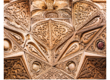
Giriş kapısı detay