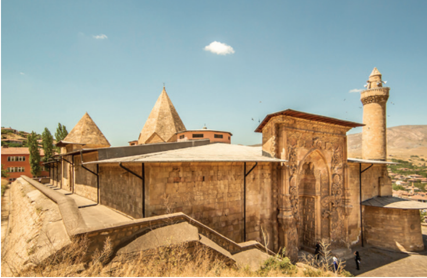
Sivas, Divriği Ulu Camii ve Darüşşifası