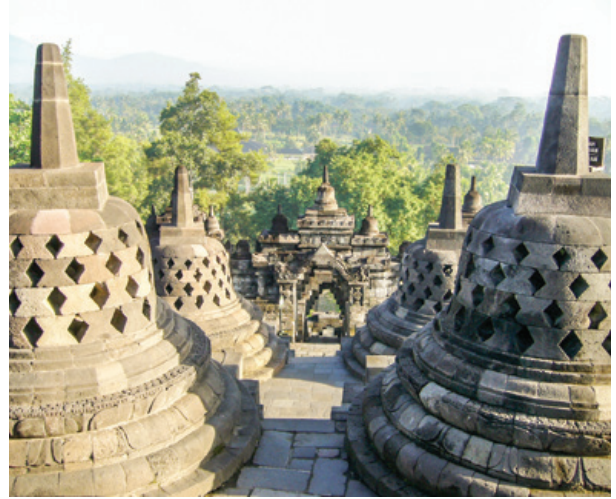
Borobudur Tapınağı detay, Kaynak: http://whc.unesco.org/en/list5/92/gallery/