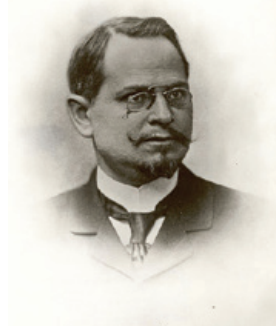
Alois Riegl (1858-1905) http://en.wikipedia.com/wiki/Alois_Riegl

Alois Riegl, anıt eserler ve tarihi anıtlar arasındaki farklılığı ilk işaret eden kuramcıdır ve tarihi anıtların tanımını farklı bir açıdan ele almıştır. Riegl, her iki kategoride de anıt tanımını, belirleyici olarak toplumsal bellekle ilişkilendirir: Anıt olarak tasarlananlar ( Das gewollte Denkmal ) ve tasarlanmayanlar ( Das ungewollte