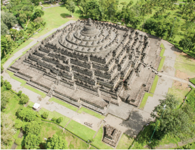
Borobudur Tapınağı, Endonezya

da yazılar zamanın etkisi ile silinince, o yapıt anımsama değerini yitirir. Buna dayanarak Riegl şunu söyler: Bir anıtın eskilik değeri, anımsama değerinin düşmanıdır; anıtların sayısal varlığı, doğaldır ki geçen zamanla birlikte tarihi eser kategorisine girmiş bulunan yapıtların sayısından çok daha azdır.