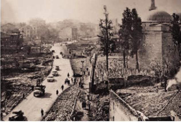
Aksaray, 1950, (Dünden Bugüne İstanbul Ansiklopedisi)