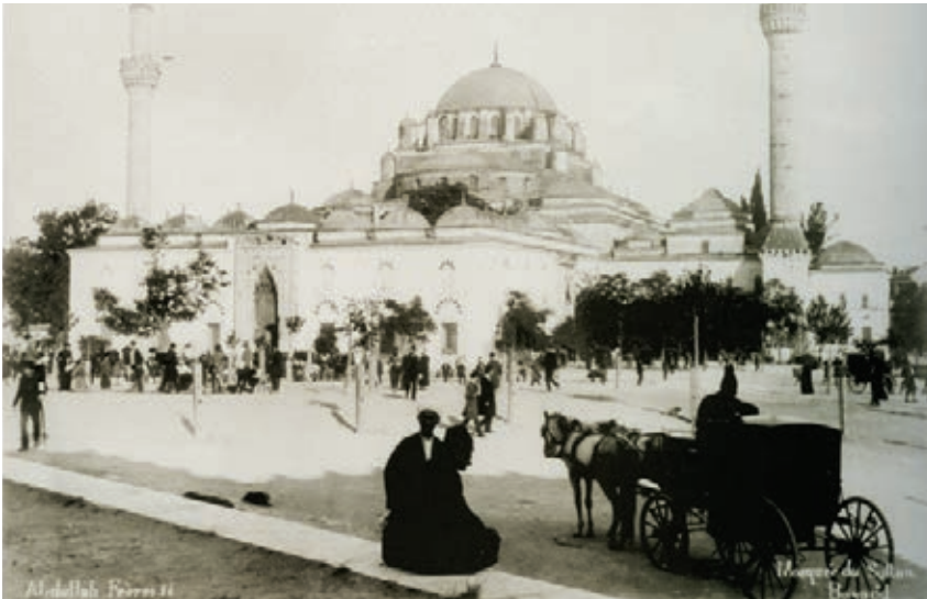
Beyazıt Camii, Abdullah Frères, Sultan II. Abdülhamid Arşivi İstanbul Fotoğrafları

tir. Dönemin imar planları Prof. H. Högg tarafından hazırlanmış (Altınyıldız 1997, s. 90); daha sonra Prof. Högg'ün yönetiminde bir planlama bürosu kurulmuştur. Planlamada çok başlılık eleştiri toplarken, 1958 yılında Prof. L. Piccinato yönetiminde yeni bir planlama bürosu kurulmuştur (Tekeli, 1994, s. 125).