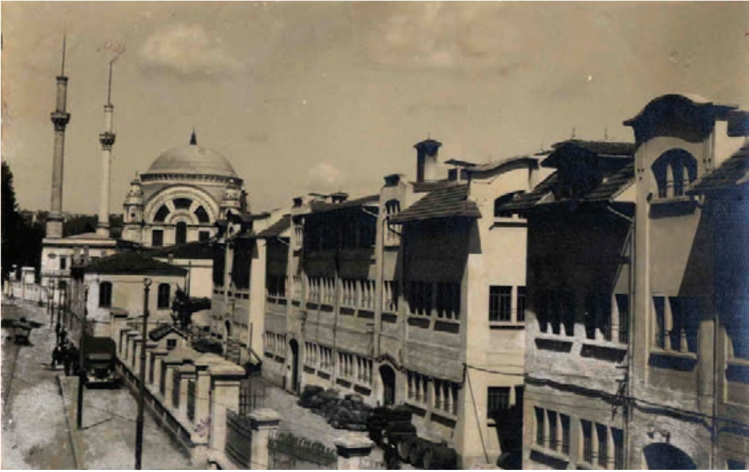
Dolmabahçe (Bezm-i Âlem Valide Sultan) Camii, 1936