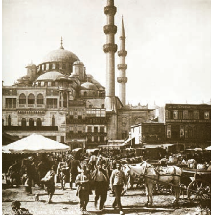
Eminönü, 19.yüzyılda İstanbul hayatı, Renate Schiele,Wolfgang Müller-Wiener, İBB Arşivi

Osmanlı döneminde anıt yapıların korunması ve onarılması, vakıf