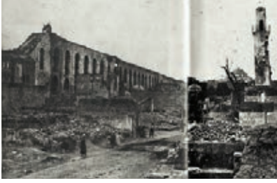
Sarachane, Muhtesip Karagöz Camii, İbrahim Paşa Hamamı, Firuzağa Camii, 1919, İBB Arşivi