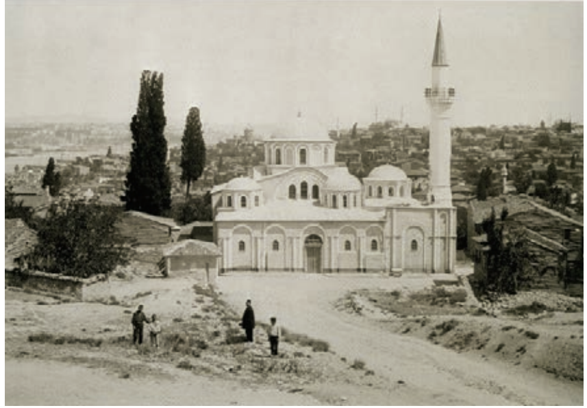
Kariye Camii

Vakıf eserlerinin kiraya verilmesi bu yapıların farklı işlevlerle kullanılmasına neden olmuştur. Silivrikapı Sünnî Hatun Camii ahır, Dolmabahçe Külliyesi Deniz Müzesi haline getirilmiş; kamuoyunda önceleri fark edilmeyen bu durum, Sirkeci'deki Merzifonlu Kara Mustafa Paşa Camii'nin bir meyhaneye kiraya verilmesiyle büyük tepki toplamıştır. Medreseler eski işlevlerini yitirdiklerinden, süt deposu, öğrenci yurdu, okul, sağlık merkezi, depo vb. olarak yeniden kullanılmışlardır. 1970'lerdeki düzeyde olmasa da, apartmanlaşma olgusu İstanbul'u betonlaştırmaya başlamıştır. Ahşap ve kârgir eski yapılar, "mâil-i inhidâm" raporlarıyla yıkılarak yerlerine ilk betonarme apartmanlar inşa edilmeye başlanmıştır. Bu inşaatlarla; mimari kaygılardan uzak, daha ziyade uluslararası modern mimarinin etkisiyle inşa edilmiş olan "yeni zenginlerin" apartmanları İstanbul'un silüetini etkilemeye başlamıştır. Ülgen, bu nedenle, kentte adeta bir ağaç düşmanlığının başladığından yakınmış (Ülgen, 1943); Haluk Şehsuvaroğlu da aynı hususla ilgili olarak benzer şekilde şikâyetinde bulunmuştur (Altınyıldız, s. 80; Cumhuriyet, 8 Ocak 1950, s. 5)