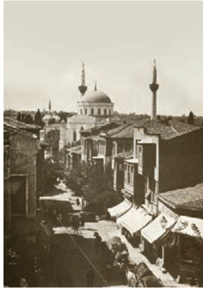
Aksaray