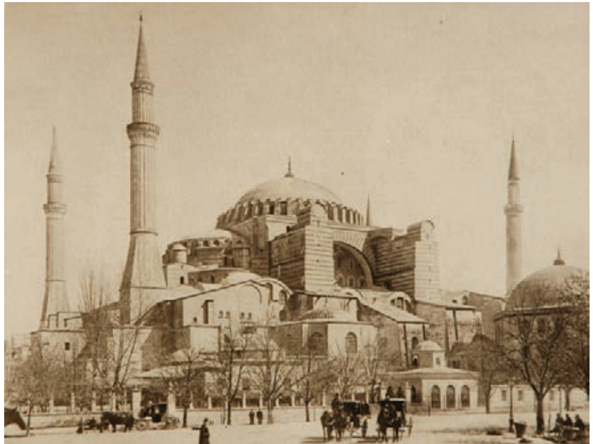
Ayasofya (Glück, 1920, Alt Konstantinopel )

güç kazandığı ve savaşın ayak seslerinin duyulduğu karanlık ve bulanık bir dönemdir. Siyasi ortamdaki ulusalcılık, mimarlar ve şehir plancıları arasında da vücut bularak yabancı mimarlara karşı tepkiyi