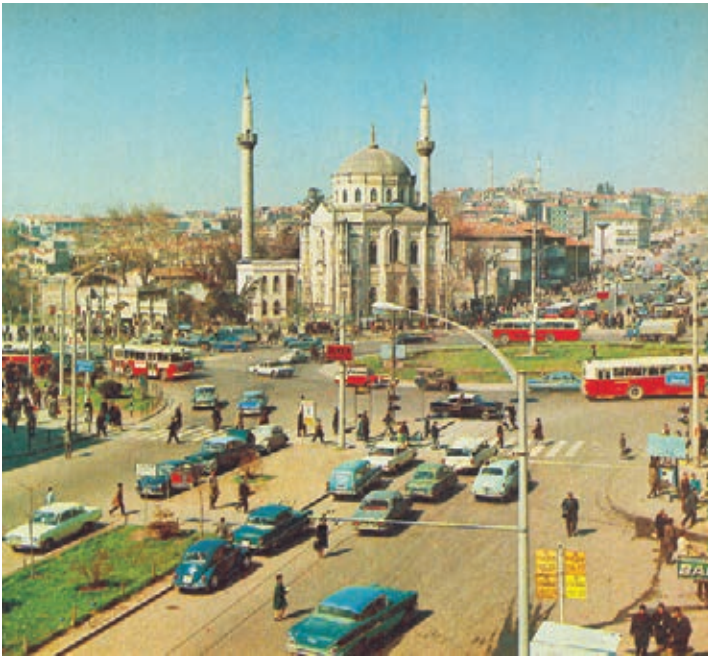
Aksaray Meydanı, 1968, (Hayat Tarih Mecmuası, Sayı 4)

Bakanlığı kurulmuştur. Yüksek Kurul'un aldığı ilk önemli karar, tarihi eserlerin "mâil-i inhidâm" yani "yıkılmak, çökmek üzere" olsa da, yıkılmamaları ve onarımları doğrultusundadır (Akozan, 1977). Bakanlar Kurulu'nca 1957 yılında çıkarılan 9153 sayılı karamname ile kabul edilen İmar Nizamnamesi'nin 39. maddesine göre, anıtsal yapıtların ve arkeolojik alanların civarından geçirilecek yolların inşasından önce, Yüksek Kurulun "mütalaası" alınacaktır (Akozan, 1977, s. 43).