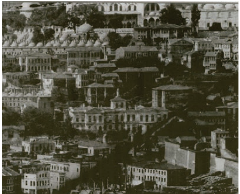
Edhem Paşa Konağı