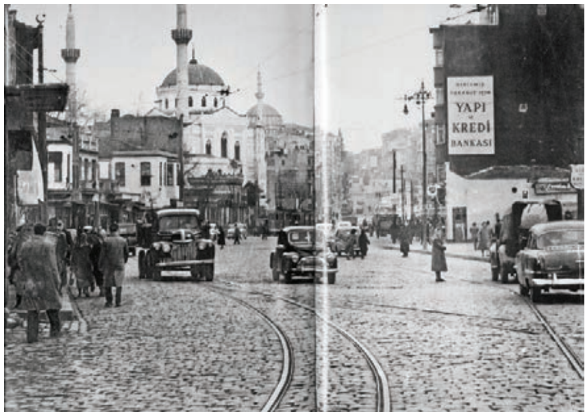
Aksaray, İBB Arşivi