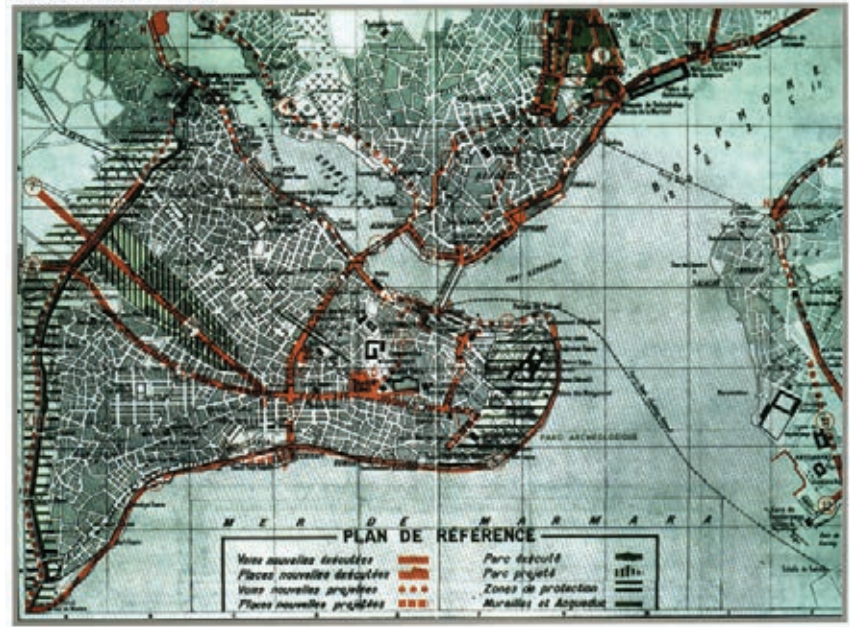
Prost Planı (1936)

İstanbul'un fethinin sembolü olan Ayasofya'nın kubbesindeki çatlaklar, Mimar Kemaleddin tarafından 1926 yılında onarılmıştır. Dumbarton Oaks Bizans Araştırmaları Merkezi'nden Thomas Whittemore, 1932 yılında Ayasofya'nın siva altında kalan mozaiklerini açığa çıkarmak için raspa çalışmalarına başlamış, yapı 1934 yılında müzeye dönüştürülmüştür. Bu konu; Ayasofya'nın 1453'ten bu yana cami olarak kullanılması nedeniyle basında ve halk arasında ciddi tartışmalara yol açmıştır. Ancak Ayasofya'nın, çevresindeki Osmanlı etkilerinden temizlenmesini savunan düşünceler de vardır. Yunus Nadi, 14 Kasım 1932 tarihli Cumhuriyet Gazetesinde, "Bu kaba taassup ve cehalet eseri siva ve badanayı bizzat biz temizlemeliydik, Ayasofya'yı badanalayan imparator yerinde, artık Avrupa'ya ayak uydurmaya çalışan Türk milleti var. Etrafı o yüksek bina ile münasebet almayacak bayağı ilavelerle bozmuşuz. Amerikalı âlim mozaikleri temizlerken, biz de etrafındaki müzahrefatı ortadan kaldırarak insanlığa olduğu kadar memleketimize de şeref olan bu yüksek medeniyet eserini Türklüğe şeref verecek bir vaziyete ifrâğ etmiş olalım; artık Ayasofya dinî bir mabet olmaktan ziyade insanî ve tarihî bir âbidedir." derken, Türk dönemine ait eklerin kaldırılması yönünde kamuoyu oluşturmaya