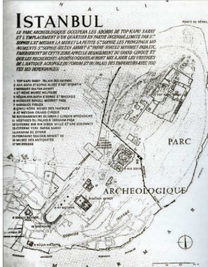
Prost Planı (Arkeolojik saha)

çalışmaktadır. Ayasofya, 10 Aralık 1934'te Müzeler Müdürlüğü'ne bağlanmıştır.