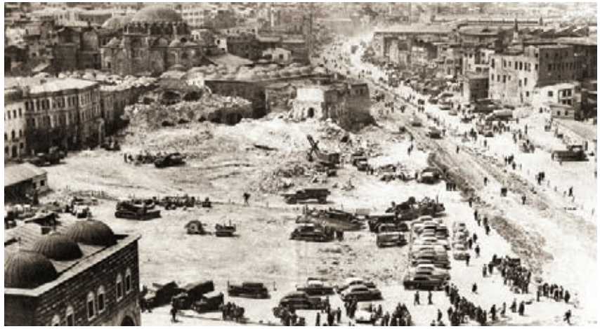
Adnan Menderes'in yıkım ve imar hareketi, Eminönü, 1957 İBB Arşivi

nin çokluğu nedeniyle bir seçime tabi tutulmaları ve kısmen korunmaları düşüncesini savunan bir yapı da vardı. Encümen'in eski eserleri yıkarak kentin gelişip değişmesi düşüncesi yerine, onları koruyarak gelişme ilkesini benimsemesi olumlu bir gelişme olmuşsa da, "köhnepereçlik" ile suçlanan Encümen'in kararlarına her zaman uyulmamıştır.