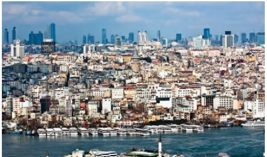
Galata ve gökdelen silüeti, 2012