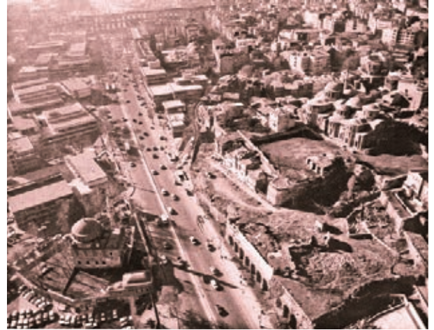
Zeyrek, 1970

zenginleri biriktirdikleri sermayeyi inşaata yatırmaya yönelmişlerdir. Tercih edilen inşaat alanları; Tarihi Yarımada veya eski İstanbul dışındaki bölgeler değil, özellikle yangın yeri ve çöküntü mahalleri olarak tanımlanan ahşap evlerin kümelendiği İstanbul'un eski kentsel dokusudur. Prost, İstanbul'un Türk döneminden ziyade Roma ve Bizans dönemlerine önem vermekle eleştirilmektedir (Kuban, 1987, s. 66). Sanayinin Haliç'e yerleşmesi, ticaret merkezinin Eminönü ve Karaköy'de bırakılması, yıkımlarla anıt eserlerin çevre bağlamından koparılması, bu dönemin ciddi hatalarıdır. Sekbanbaşı