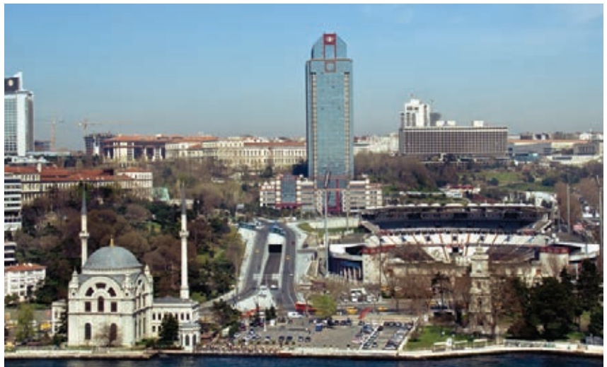
Dolmabahçe, 2010