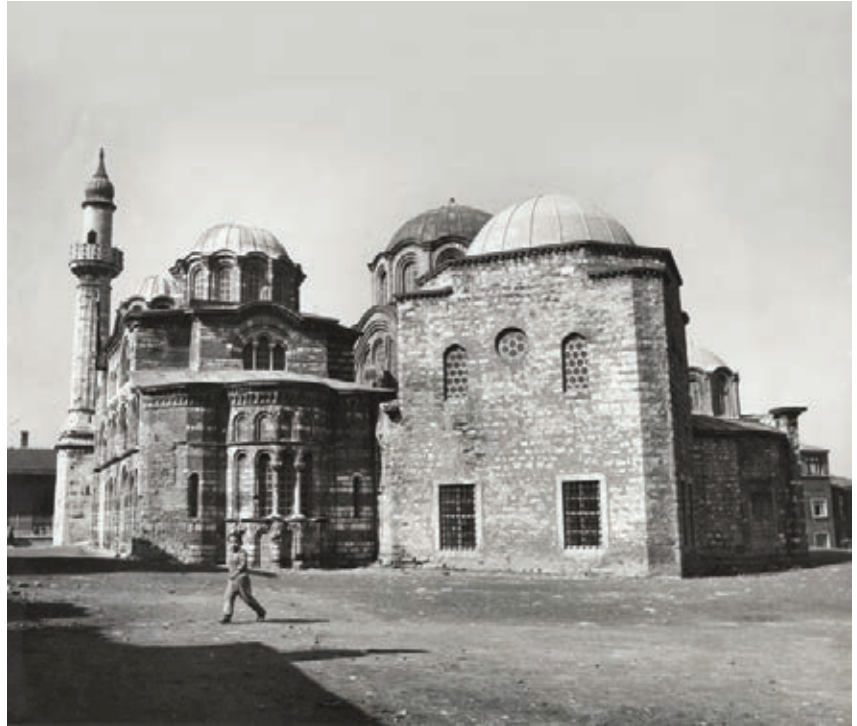
Fethiye Camii