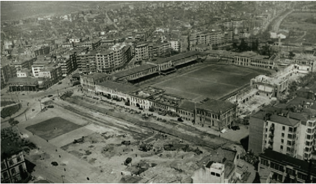
Taksim Topçu Kışlası

oluşması için hükümetin müdahalesinin gerekliliğine değinmiştir. Halkevlerinde ve parti yapılarında 2. Ulusal Mimari üslubun kullanılması tercih edilmiş; bu tutum, “kendimize dönüş hareketi” olarak yorumlanmıştır. Ata yadigârı anıt eserlere Cumhuriyet dönemi öncesinde iyi bakılmadığı, ancak Cumhuriyetin yapıcı ruhuyla eski eserlere sahip çıkıldığı hususuna gazete makalelerinde sık sık yer verilmiştir. Bu dönem; milli gurur kaynağı olarak eski eserlere soyut bir sevginin canlandırılmaya çalışıldığı, ancak Türk kültürel kimliğinin sürekliliğinin