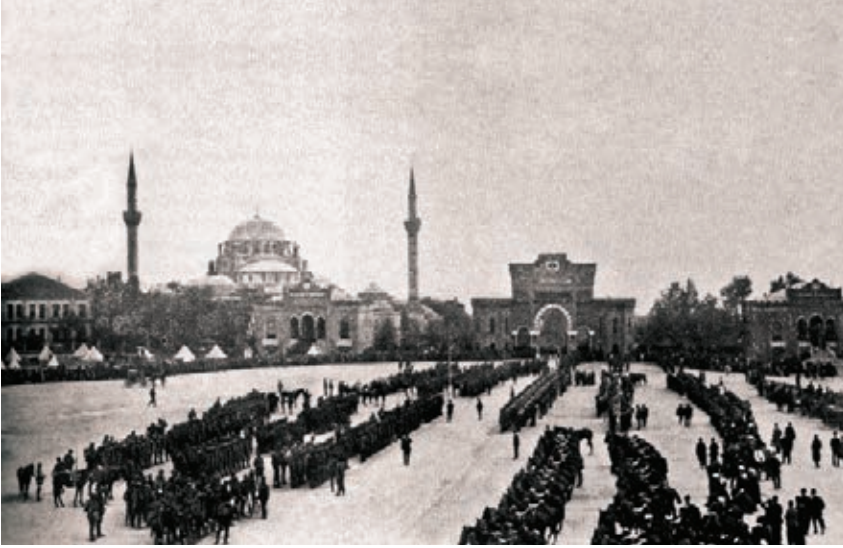
Bâb-ı Seraskeri önünde askerler, 1912