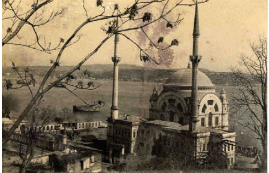
Dolmabahçe (Bezm-i Âlem Valide Sultan) Camii, 1945, Encümen Arşivi

1946'dan sonra Yedikule-Kazlıçeşme ve Zeytinburnu'nda gecekondulaşma başlamış; 1949'da ilk imar affı çıkarılarak yasa dışı yapılaşmanın ilk kapısı açılmıştır. Bu dönem, 2.Dünya Savaşı sonrasıdır ve savaş döneminin karaborsacı