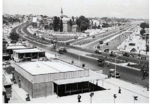
Aksaray-Muratpaşa (Hilmi Şahenk, 1996, Bir Zamanlar İstanbul)