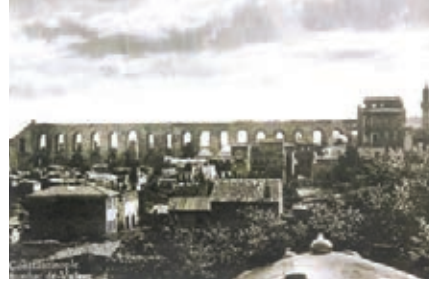
Unkapanı, 1924