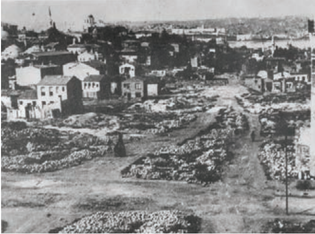
Sarachane Unkapanı yolu, 1929