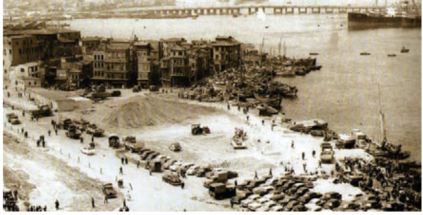
1956 İmar Hareketleri, Eminönü

1913 yılında İstanbul'da kurulan Âsâr-ı Atîka Encümeni, " Tarihe, âsâr-ı atîkaya, memleketin coğrafyasına, sanâyi-i nefîseye, mimariye ve âsâr ve mebain-i kadîmiye vâkıf " dört üye, bir kâtip ve bir müze mimarından oluşmaktaydı. Bu Encümen, 1924'te çıkarılan bir nizamnâme ile görevini Cumhuriyet Dönemi'nde sürdürmüştür. Farklı uzmanlıklar gerektiren koruma disiplininin basite alınmasının ilk örneği, kayda değer bir merkezîyetçi anlayışın benimsenmesidir. Âsâr-ı Atîka Encümeni'nde, sivil mimarinin korunması düşüncesi gündeme gelmişti; ancak o zaman Encümen içinde sivil mimarî örneği-