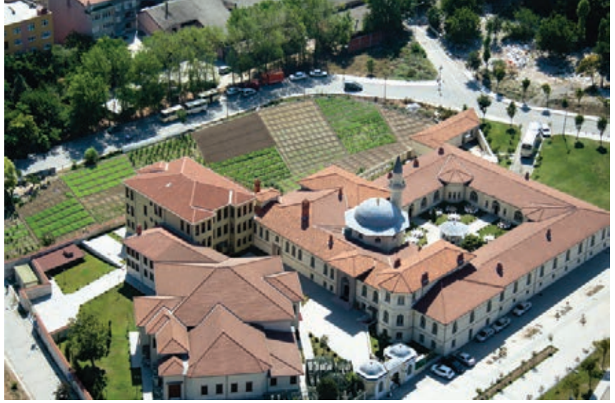
Bir rekonstrüksiyon örneği, Yenikapı Mevlevihânesi, 2011

A.B.D.’de yaygın olarak görülen, Avrupa’da veya dünyanın başka yerlerindeki anıtların kopyalarının yapılması o kültürler için normalde de, bu durum 8000 küsur yıllık tarihi olan İstanbul için uygun değildir. Bu makalenin uzunca bir bölümünü oluşturan İstanbul’un koruma(ma)tarihi ve kaybolan eski eserler, geleneksel mahallelerin hâlâ sistemli olarak yitirilmesi, kentin kıyısında köşesinde kalmış ve kent dokusundaki yerinden ve bağlamından kopmuş yitik yapılar, yeniden inşayı haklı göstermektedir. Böylece, belki de yıkıcı anıtların üzücü izleri bir miktar ortadan kaldırılacaktır. Ancak yitirilen yapıların yerlerinde bugün başka yapılar veya yollar vardır. Kent dokusu bağlamından kopmamış Pîrî Mehmet