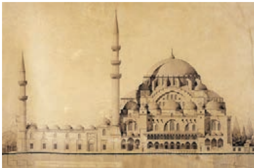
İstanbul Şehzade Camisi, çizim; Sedat Çetintas İTÜ Mimarlık Fakültesi Arşivi

29 Haziran 1933 tarihinde çıkarılan bir kararname ile Maarif Vekâleti Âsâr-ı Atıka ve Müzeler Dairesi'ne bağlı olarak Anıtları Koruma Komisyonu kurulmuştur. Bu komisyon; bir yabancı arkeolog, iki yerli mimar, bir yerli veya yabancı fotoğrafçı, bir tasnif memuru ve yazı işleri şefinden oluşmaktaydı. Komisyonun üyeleri;