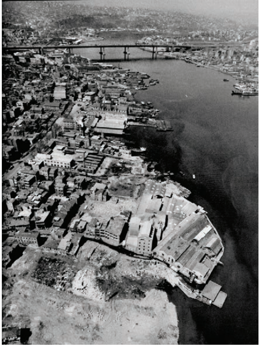
Haliç yıkımları, 1985

Carta del Restauero” adlı makalesi, gerekse Cevat Erder’in “Venedik Tüzüğü Uluslararası Tarihi Anıtları Onarım Kuralları” tanıtım yazısı, o dönemde mimarlar arasında tam olarak anlaşılmamış; her yaşta ve estetik değerdeki yapı için fark gözetmeksizin aynı müdahalelerin yapılabileceği veya rekonstrüksiyonların bütünüyle reddolunacağı zannedilmiştir.