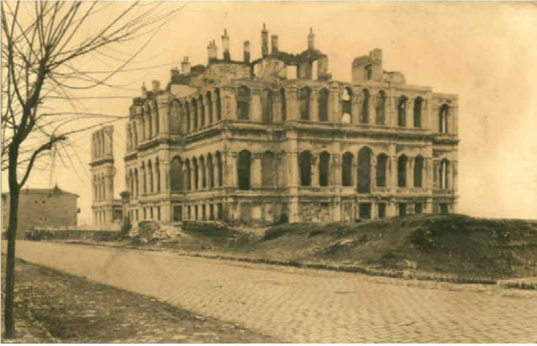
Ali Paşa Sarayı Eski Eser Encümeni Arşivi