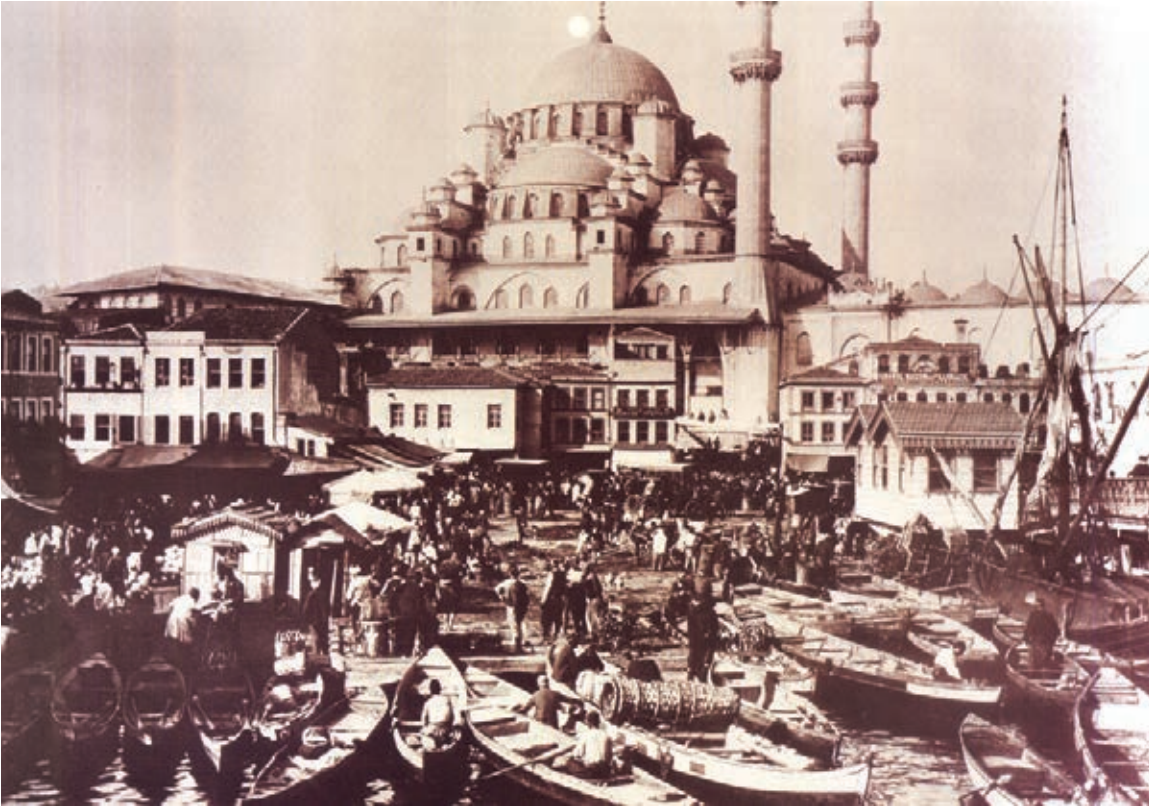
Eminönü Unkapanı

sosyal ortamın belirlediği güncel işlevlere göre ortaya çıkan yapı tiplerini geleneksel formlarda tasarlayan bir mimari anlayışı, Cumhuriyetin ilk yıllarında da bir müddet varlığını sürdürmüştür.