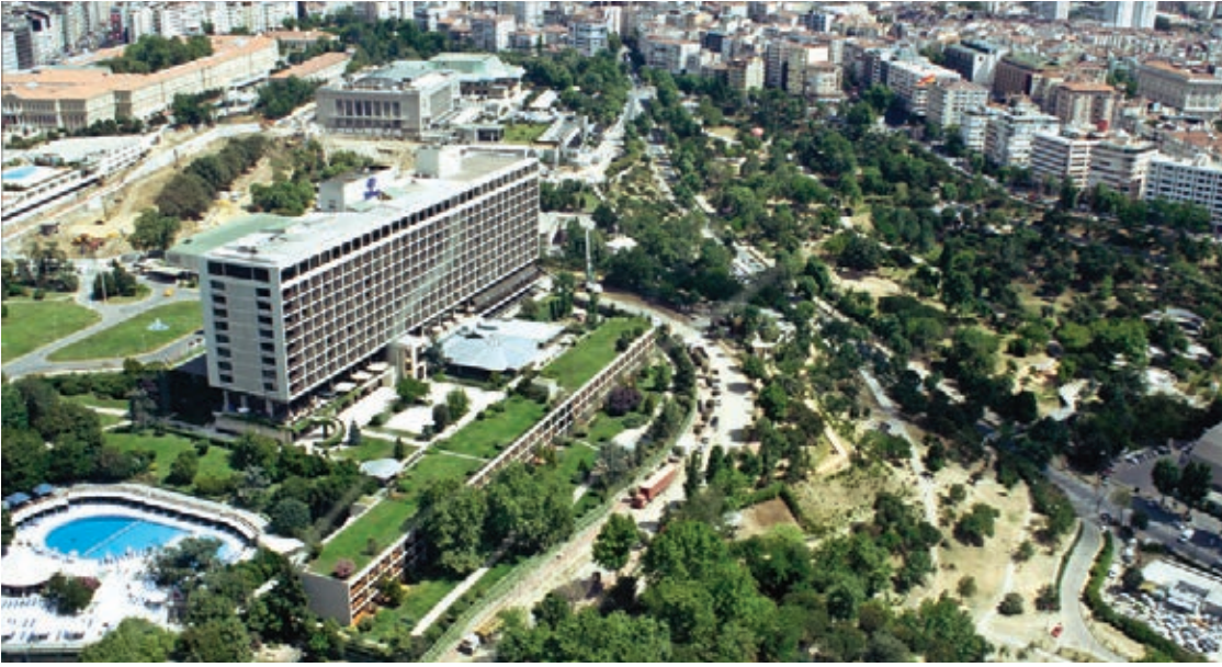
Hilton Oteli, 2008

Amerika kökenli, uluslararası modernist örneklerdir. Kübik kütleleri, donuk cam cepheleri ve teras çatılarıyla İstanbul'un eski kent dokusuna ters düşen bu üslubun simgesi, Hilton Oteli'dir. Hilton örneği, Kuban'a göre Türkiye koşullarına uygun bir mimarinin gelişmesine engel olmuştur (Kuban, 1981). Betonarme yapıım tekniğiyle yapılmış, modern ve çevre bağlamından kopuk bu mimari, daha sonraki yıllarda kalfaların elinde giderek daha da olumsuz sonuçları nortaya çıkmasına neden olmuştur.