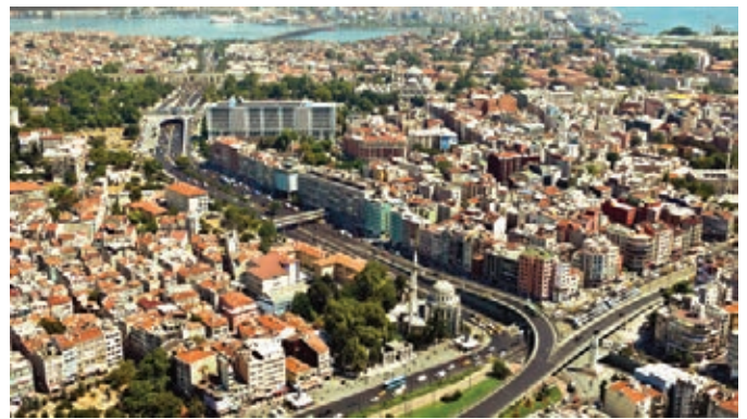
Aksaray, 2007

kara ve İstanbul'da yeni taşıt yolları açmak, anıtların etrafını yıkmak ve camileri onarmak şeklinde uygulamalar yapmıştır. Vatan ve Millet caddelerinin açılması, 60 metreye genişletilen Vatan Caddesi'nin iki yanına yüzer metre ara ile 16 katlı