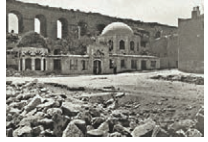
Gazanfer Ağa Medresesi