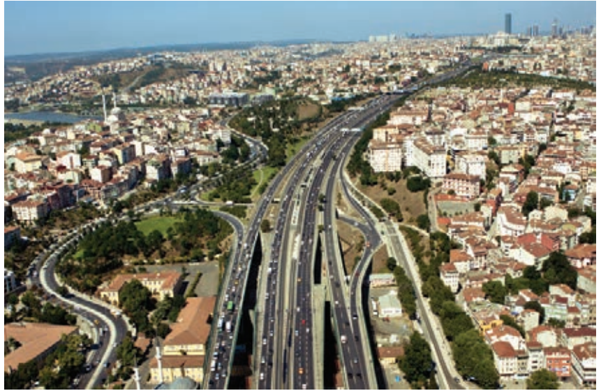
İstanbul Çevre Yolu, Halıcıoğlu, 2011