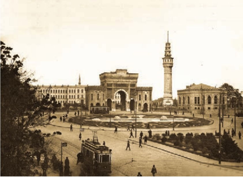
Beyazıt Meydanı, 1940'lar (Ousterhout, Başgelen, Monuments of Unaging Intellect: Historic Postcards of Byzantine Istanbul )