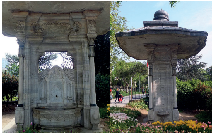
Şekil 16. II. Abdülhamit Çeşmesi Genel Görünüş

Sultan II. Abdülhamit'in H.1319 (M.1901) yılında yaptırmış olduğu II. Abdülhamit Çeşmesi, XIX. yüzyıl çeşmeleri için güzel bir örnektir. Beşiktaş İlçesi, Maçka Silahhanesi'nin karşısında yer alan eser, İtalyan Mimar Raimondo d'Aronco'nun eseridir. Eser, 1957 yılında yapılan yol genişletme çalışmaları esnasında asıl yeri olan Tophane Nusretiye Camii önünden taşınarak bugünkü yerine nakledilmiştir (Demirsar, 1994, C.I, s.43). Tamamen mermer malzemeden inşa edilmiş olan bu dört yüzlü küçük meydan çeşmesinin, dört yüzünde de Talik hatla yazılmış kitabesi yer almaktadır. Üsküdarlı Ahmet Tâlât tarafından yazılan kitabe şu şekildedir: "Sayesinde ol şehinşah-ı mu'alla meşrebin / Teşnegâna böyle dil-cû çeşmeler oldu bedid Âb-ı şerbetin içüb birle Didim târihini / Eyledi bu çeşmeyi bünyâd Han Abdülhamid" (Talasoglu, 1994, s.86).