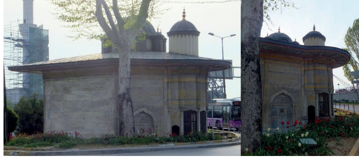
Şekil 12. Azapkapı Saliha Sultan Çeşmesi Genel Görünüş

XVIII. yüzyıl meydan çeşmelerinin diğer bir örneği de Azapkapı Saliha Sultan Çeşmesi'dir. Galata'da Sokullu Mehmed Paşa Camii'nin arkasında bulunan eser, I. Mahmud'un annesi Saliha sultan tarafından H. 1145 (M.1732) yılında yaptırılmıştır (Barışta, 1995, s.70). Çeşme şehrin hareketli bir noktasında küçük bir meydana inşa edilmiştir ve bu meydan daha sonraları "Çeşme Meydanı" ismiyle anılmıştır (Talasoglu, 1994, s.44).