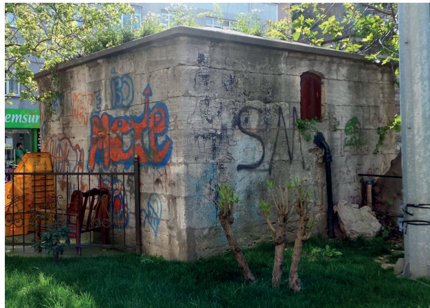
Şekil 6. Mustafa Ağa Meydan Çeşmesi Arka Cephe Görünüşü

Kitabenin iki yanına birer adet gülbezek motifi işlenmiştir. Çeşme nişinin üzerini örten sivri kemerin kilit taşı üzerinde de bir adet gülbezek motifi bulunmaktadır. Çeşmenin kemeri yarlarda bulunan yığma ayaklar tarafından taşınmaktadır. Çeşme nişinin iç kısmı kemerin ayaklara oturduğu hizada iki sıra bezemesiz düz silme ile iki bölüme ayrılmıştır. Eserin ayna taşı üzerine sepetkulpu kemer motifi kabartma tekniğiyle işlenmiş olup bu kemer motifinin hemen alt orta kısmına bir adet gülbezek motifi yapılmıştır. Ayna taşının iki yanında selvi ağacı motifleri yer almaktadır. En üstünde ise kıvrık dallar ve çiçeklerle bezenmiş bir bordür bulunmaktadır. Ayna taşının iki yanında birer adet kaş kemerli tas yuvası yer almaktadır.