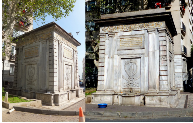
Şekil 14. Bezmi Alem Valide Sultan Çeşmesi Genel Görünüş