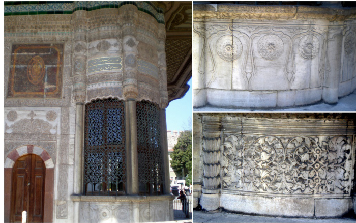
Şekil 8. III. Ahmed Meydan Çeşmesi Sebil Ve Sebil Etekleri