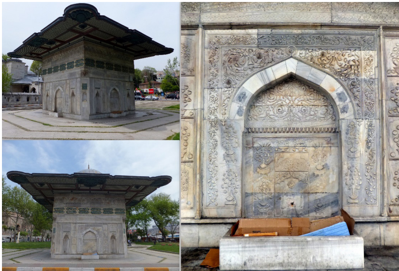
Şekil 11. Tophane Meydan Çeşmesi Genel Görünüş ve Detay Görüntüleri