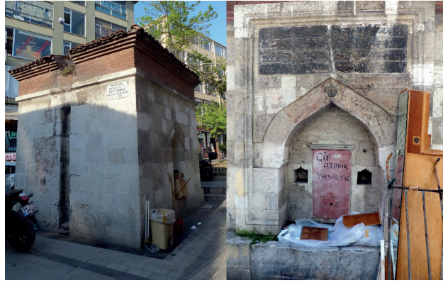
Şekil 1. Güzelce Mahmud Paşa Çeşmesi Genel Görünüş ve Ön Cephesi

Kitabeden de anlaşılacağı üzere eser, M.1622 yılında Babüssaade Ağası Mısırî Osman Ağa tarafından tamir ettirilmiştir. Birden fazla onarım gören eser sırasıyla H.1031 yılında II. Osman, H.1172 yılında III. Mustafa ve bilinmeyen bir tarihte Sultan Abdülmecit döneminde de onartılmıştır (Talasoğlu, 1994, s.11).