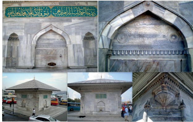
Şekil 10. Emetullah Gülnuş Valide Sultan Çeşmesi Genel Görünüş ve Detay Görüntüleri

XVIII. yüzyılın diğer bir önemli örneği ise; Üsküdar İskele Meydanı'nda yer alan Emetullah Gülnuş Valide Sultan Çeşmesi'dir. Eser, Sultan III. Ahmed'in emriyle H.1141 (M.1729) yılında, Sultan III. Ahmed'in annesi Rabia Emetullah Gülnuş Valide Sultan'ın hayratı olarak Sadrazam Damad İbrahim Paşa tarafından yaptırılmıştır (Eyice, 1955,s.39). Dört cepheli bir meydan çeşmesi olan Emetullah Gülnuş Valide Sultan Çeşmesi, kare bir plan üzerine oturmaktadır ve eserin dört cephesinin ortalarına gelecek şekilde birer adet çeşme ve çeşmenin pahlanmış olan köşelerine de birer adet suluk yerleştirilmiştir. Köşelerdeki bu suluklar sayesinde çeşmenin keskin hatları