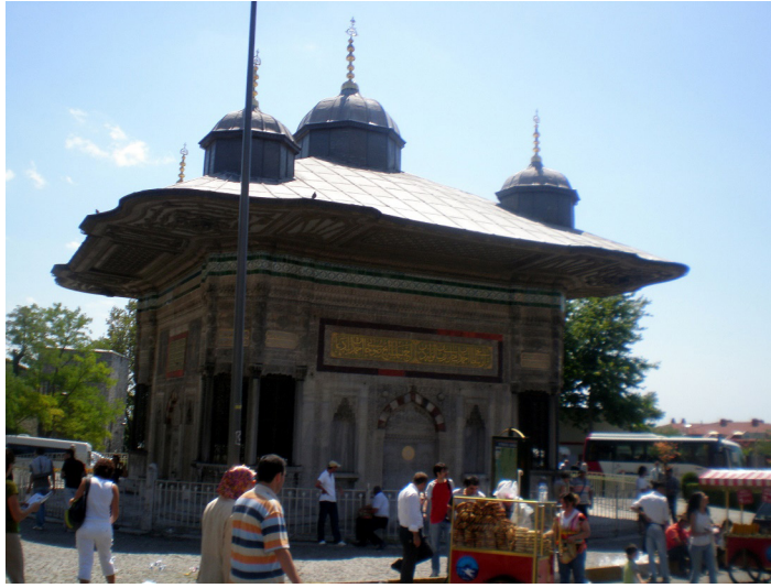
Şekil 7. III. Ahmed Meydan Çeşmesi Genel Görünüş