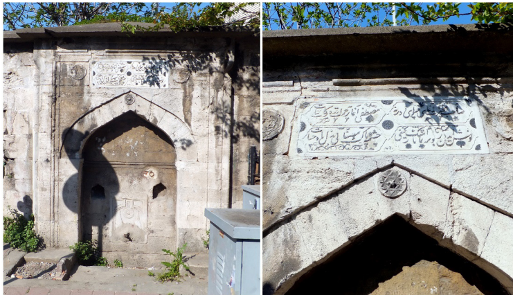
Şekil 4. Mustafa Ağa Meydan Çeşmesi Ön Cephe Görünüşü ve Kitabesi