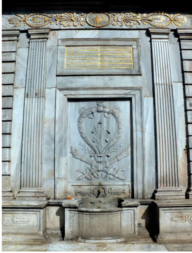
Şekil 15. Bezmî Alem Valide Sultan Çeşmesi Ön Cephe Görünüşü