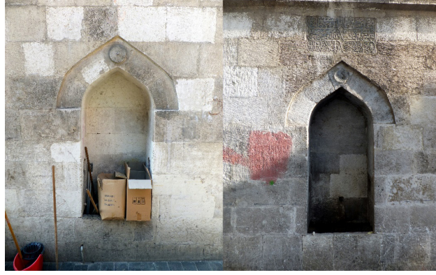
Şekil 2. Güzelce Mahmud Paşa Çeşmesi Yan Cepheleri