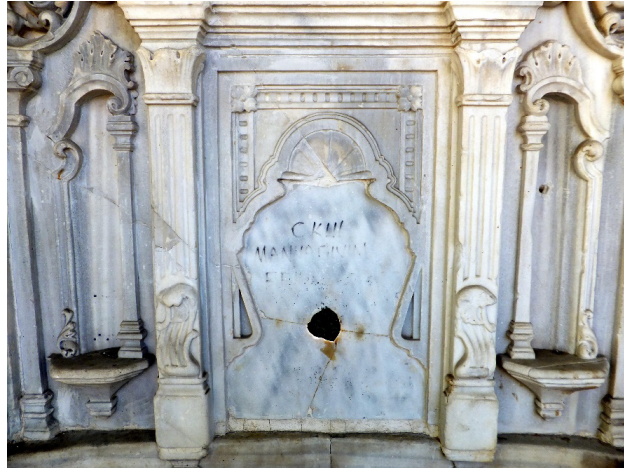
Şekil 17. II. Abdülhamit Çeşmesi Detay Görüntüsü

Dikdörtgen bir plana sahip olan eserin üzeri iki katlı bir çatı ile örtülmüş olup, çatının da üzerinde kule görünümlü bir yalancı kubbe yer almaktadır. Geniş saçaklı çeşmenin dört köşesine birer adet sütun yerleştirilmiştir. Sütunlarla saçak arasında kalan yüzeyde eserin kitabeleri bulunmaktadır. Kitabeler kıvrımlar yapan kenger yaprakları ile çerçeve içerisine alınmıştır. Kitabelerden sonra çeşme bezemesiz, iç ve dış bükey silmelerle çevrelenmiştir. Eserin geniş yüzeylerinde yer alan çeşmelerinin üst kısmı bu silmelerden sonra tamamen boşaltılmış olup, bu boş çerçevenin üst iki köşesine de volütlü konsollar yapılmıştır. Çeşmenin ayna taşının tacı korint yaprakları, S ve C kıvrımları yapan bitkisel motiflerle grift bir şekilde bezenmiştir. Bu tacın orta kısmında ise bir adet vazoda çiçek motifi bulunmaktadır. Tacı, yanlarda yer alan gövdesi yivlendirilmiş iki adet dekoratif sütun taşımaktadır. Bu sütuncelerin yanlarında da birer adet suluk bulunmaktadır. Çeşmenin yalağı dalgalı olup üzeri silme ve kıvrımlar yapan bitkisel motifler bordürüyle bezenmiştir. Tüm bu bezeme öğeleri ile eser Barok Dönem özellikleri göstermektedir.