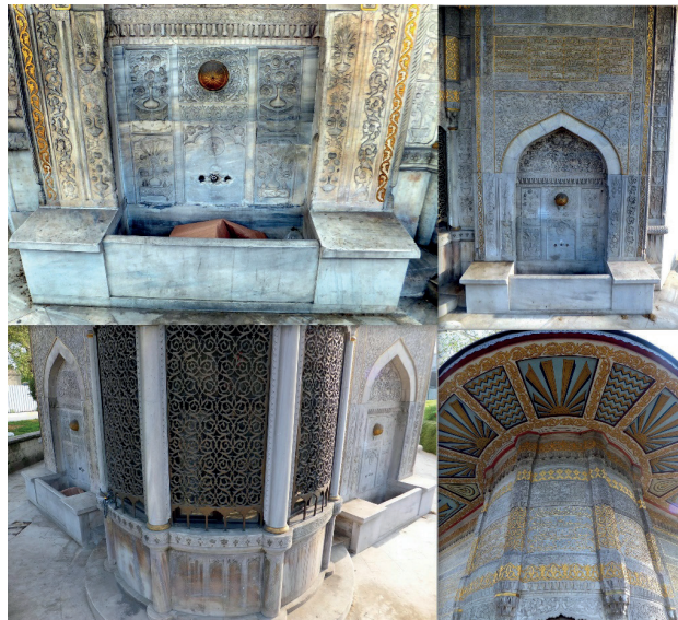
Şekil 13. Azapkapı Saliha Sultan Çeşmesi Detay Görüntüleri

İhtişamlı bir görünüme sahip olan eserin üzeri; geniş saçaklı ve üzerinde yüksek kasnaklı yalancı kubbelerin yer aldığı bir üst örtüyle kapatılmıştır. Düzgün geometrik bir plan arz etmeyen eserin iki yanında birer adet çeşme ve bunların ortasında geometriyi bozan daire planlı bir sebül yer almaktadır. Sebülün gövdesi, sebül eteği üzerinde yükselen mukarnas başlıklı sütunlarla beş parçaya bölünerek cepheye hareketlilik kazandırılmıştır. Sebül cephesini bölen her bir parçanın üzerinde ise dörder satırlık inşa kitabeleri yer almaktadır. Sebülün iki yanında yer alan çeşmeler klasik üslupta sivri kemerli inşa edilmişlerdir. Prizmatik dikdörtgen formunda olan bu çeşmeler benzer şekillerde bezenmiş olup aşırı derecede süsleme ögesi içermektedirler. Çeşmelerin etrafını çevreleyen silmeler ve bordürler bitkisel formlardan oluşan grift örgülerle bezenmiştir. Çeşmeler iki yandan burmalı sütuncelerle sınırlandırılmıştır. Çeşme nişlerinin üzerini örten kemerlerin, kemer köşeleri ve kemer aynaları rumi, palmet ve lotuslarla elde edilmiş grift bir bezeme ile bezenmiştir. Çeşme nişlerinin iç kısmı, üzenği taşı hizasında bir sıra mukarnas dışı frizi ile iki bölüme ayrılmıştır. Çeşmelerin ayna taşlarına altlı ve üstlü olmak üzere bir sehpa üzerine konumlandırılmış vazo içinde çiçek motifleri tasvir edilmiştir. Bu motiflerin ortasında ise altın yaldıza boyanmış birer adet kabara bulunmaktadır.