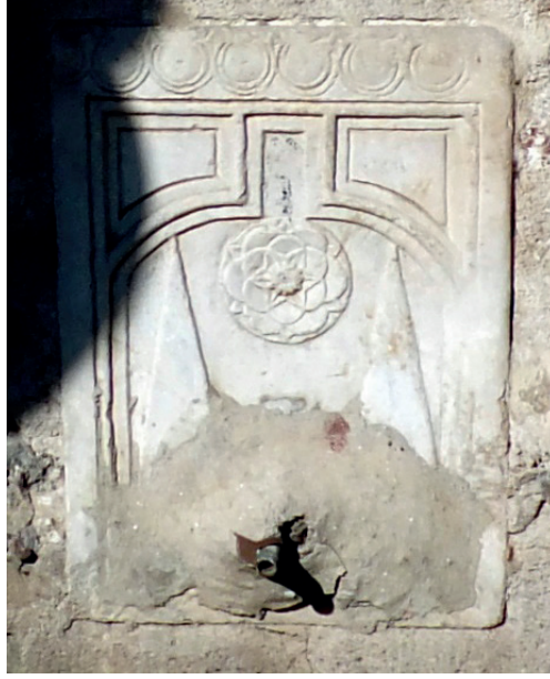
Şekil 5. Mustafa Ağa Meydan Çeşmesi Ayna Taşı

Kesme taş malzeme ile inşa edilmiş olan eser, tek yüzlü bir meydan çeşmesidir. Eserin üzeri dört yöne eğimli kırma bir çatı ile örtülüdür. Klasik üslupta sivri kemerli yapılan çeşme cepheden hafif taşırılarak vurgulanmıştır. Üç yandan bezemesiz silmelerle çevrili olan eserin kitabesi, iki sütun ve iki satır şeklinde düzenlenmiş olup yazılar kartuş içerisine alınmıştır. Çeşme nişinin üzerini örten kemerin hemen üzerine yerleştirilen kitabe;