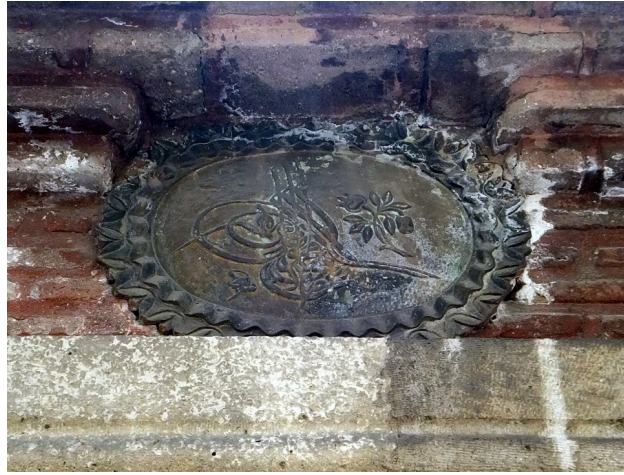
Şekil 3. Güzelce Mahmud Paşa Çeşmesi Sultan Abdulmecid'in Tuğrası