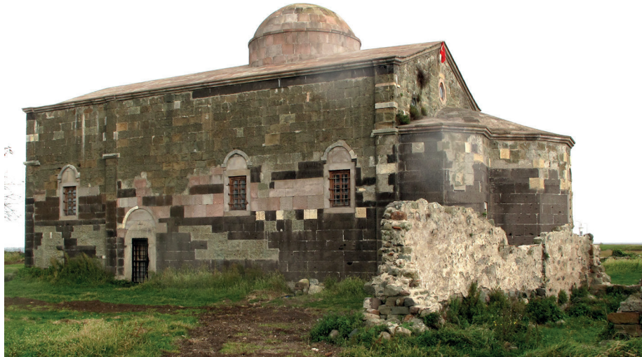
Resim:3 , Güney Cephesi