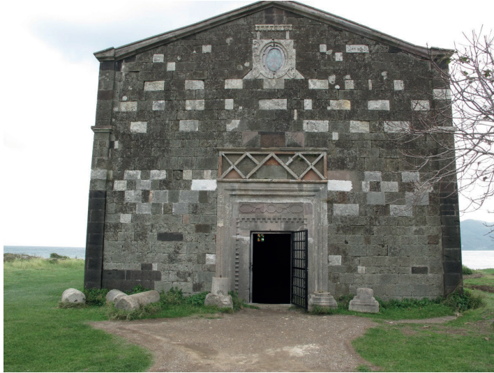
Resim:2 , Batı Cephesi