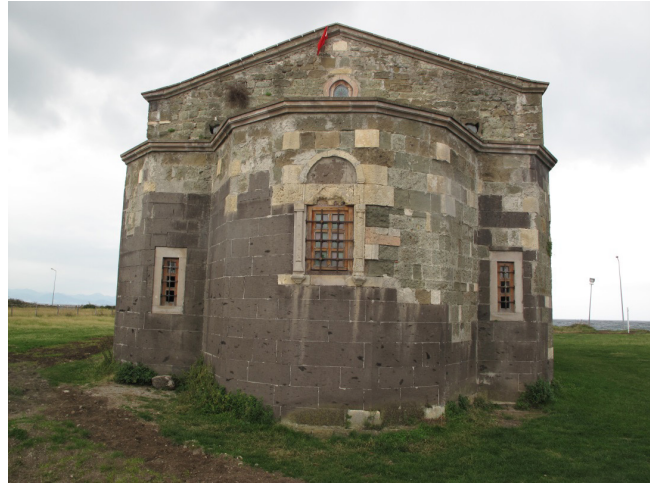
Resim:5, Doğu Cephesi