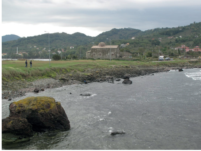
Resim:1 , Yason Kilisesi Genel Görünüm.