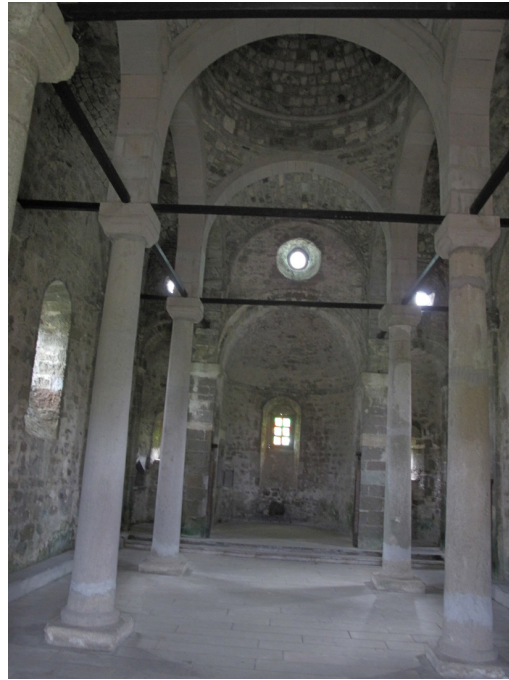
Resim:6, İç Mekân