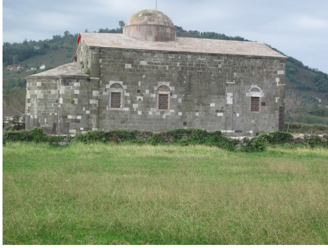
Resim:4, Kuzey Cephesi