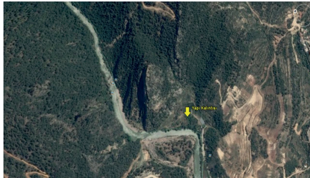
Harita 2: Yapı Kalıntısı, 103 Ada 4 Parsel ( Google Earth)