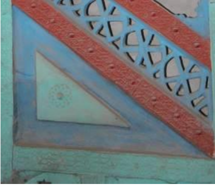
Fotoğraf 19: Minber aynası ve korkuluğu