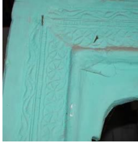
b) Kapı sövelerindeki süslemeler.