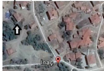
Harita 2: İnaç Köyü Eski Cami konumu