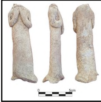
Resim 4: K-73 No.lu Mezardan Pişmiş Toprak Figürin (ETÇ IV)