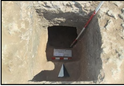
Resim 1: K-56 No.lu Kaya Oyuğu Mezarın Girişi