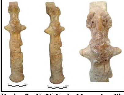
Resim 2: K-56 No.lu Mezardan Pişmiş Toprak Figürin (ETÇ IV Sonu)