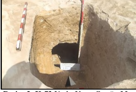
Resim 3: K-73 No.lu Kaya Oyuğu Mezarın Girişi