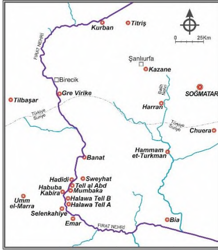
Harita 1: Metinde Geçen Yerleşimleri Gösteren Harita