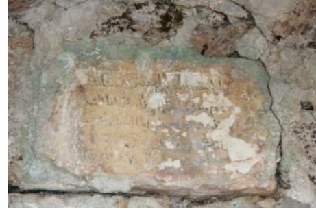
Foto.11. H. Mustafa Ağa Çeşmesi Foto.12. H. Mustafa Ağa Çeşmesi Kitabesi