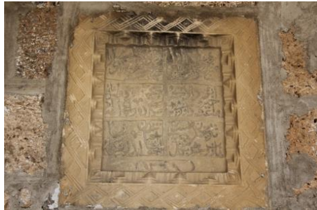
Foto.42. Hacı Hüseyin Efendi Çeşmesi Foto.43. Hacı Hüseyin Efendi Çeşmesi Kitabesi