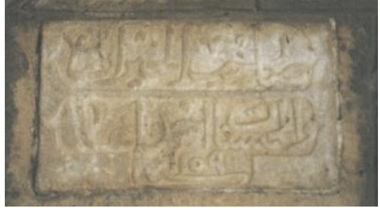
Foto.27. Ahmet Ağa Çeşmesi Foto. 28. Ahmet Ağa Çeşmesi Kitabesi (K.Pektaş)