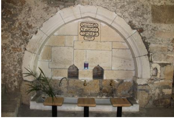
Foto.31. Apçağa Köyü Cami Çeşmesi

Yapı, ilçe merkezine 6 km. uzaklıkta bulunan Apçağa Köyü'nde, caminin bahçesinde, avlu duvarına bitişik olarak yapılmıştır. Tek cepheli, sivri kemerli nişe sahip olan çeşme düzgün kesme taştan inşa edilmiş, nişte modern iki musluk, kaş kemerli iki taslık nişi ve 4 satırlık kitabe panosu vardır (Foto.31). Yapının büyük oranda yenilediğini siva izlerinden ve malzemesinden anlamaktayız. Yenilenen teknesi ile çeşme günümüzde işlevini sürdürmektedir. Kitabesine göre çeşme, M. 1852-53 yılında yaptırılmıştır.