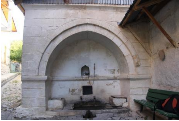
Foto.67.Yeşilyamaç Köyü Çeşmesi