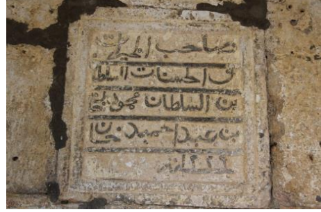
Foto.52. 2. Mahmud Çeşmesi Kitabesi