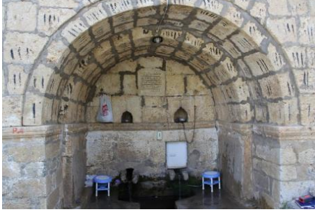
Foto.51. 2. Mahmud Çeşmesi