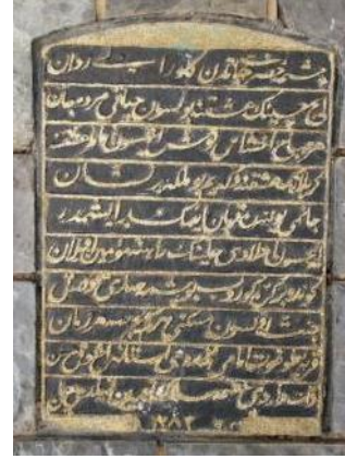
Foto.56. Ocak Köyü Çeşmesi Tamir Kitabesi