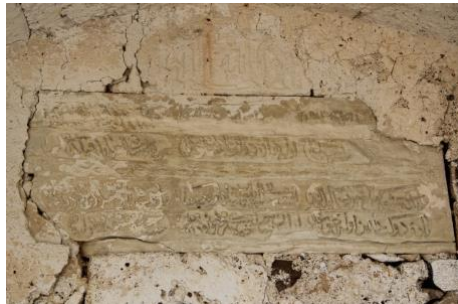
Foto.64. Tuğlu Köyü Çeşmesi Kitabesi