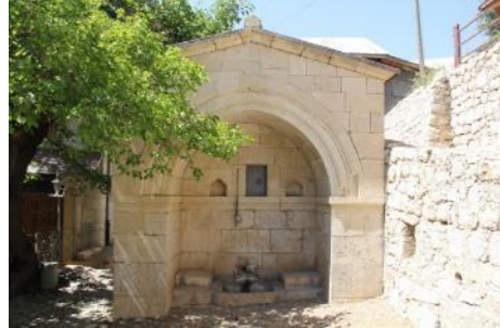
Foto.34. Arif Osman Ağa Çeşmesi, Batı Cephe Foto.35. Arif Osman Ağa Çeşmesi, Doğu Cephe