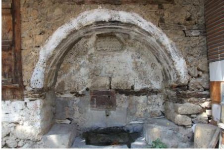
Foto.46. Hacı Ömer Ağa Çeşmesi