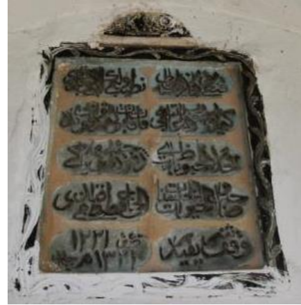
Foto.44. Hacı Mustafa Efendi Çeşmesi Foto.45. Hacı Mustafa Efendi Çeşmesi Kitabesi