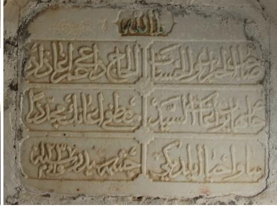
Foto.19. Seyyid Mustafa Ağa Çeşmesi 2 Foto.20. Seyyid Mustafa Ağa Çeşmesi 2 Kitabesi