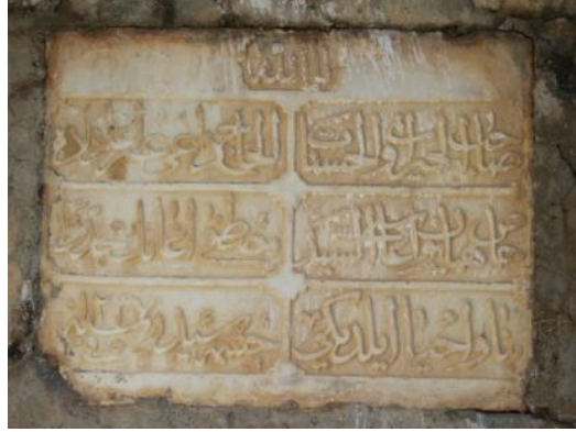
Foto.17: Seyyid Mustafa Ağa Çeşmesi 1 Foto.18: Seyyid Mustafa Ağa Çeşmesi 1 Kitabesi