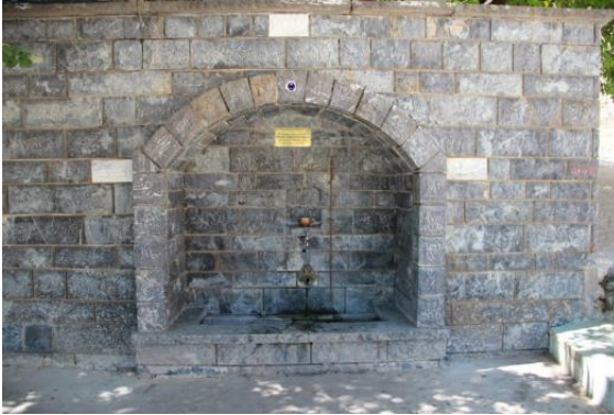
Foto.55. Ocak Köyü Çeşmesi

“Çeşme-i hasreti hayatımdan gelurâb-ı revân İç Hüseyin'in aşkına bulsun hayat-ı merde cân Her sabah akşam nûsetsun âlem aşkına Kerbelanın aşkına döktüm yolumuzdan şân Canım yolunda kurban etmek bir işimdir İçsunevlâd-ı Ali'nin rahuna (yoluna) mu'mîn olan Günde bir kere görüp bu çeşme seriserrâvî Cennet olsun meskeni her kim içerse her zaman Karye-i Aşutgaimamı mahdumu asitane-i şevk isen Zâtı vardı çeşmesinin tamirini eyledi hemân (hemen) Muharrem Sene 1283”