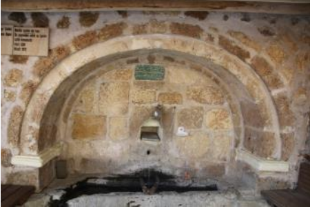
Foto.37. Bekir Ağa Çeşmesi