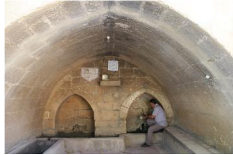
Foto. 26. Adak Köyü Çeşmesi