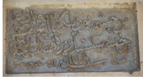
Foto.23. Usta Yusuf Çeşmesi Kitabesi