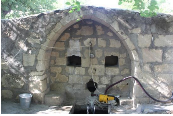
Foto.57. Salkımlı Köyü Çeşmesi