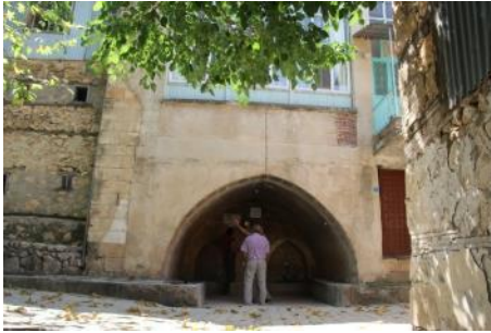
Foto.25. Adak Köyü Çeşmesi

Yapı, ilçe merkezine 40 km. uzaklıktaki Adak Köyü'nde caminin güneydoğusunda eyvan şeklinde sokağa açılmaktadır. Kuzeyden güneye doğru eğimli arazi üzerinde bulunan çeşme ve cami, Erzurum Kültür Varlıklarını Koruma Bölge Kurulu tarafından, 12.10.2012-499 sayılı tarih ve karar ile tescil edilmiştir. Yapı, arka taraftaki evlere bitişik olarak sokağa doğru uzanmaktadır. Çeşme, düzgün kesme taştan inşa edilmiştir (Foto.25). Eyvan tipli çeşmeler grubunda olan yapının üzeri beşik tonozla örtülüdür. Sivri kemerle açılan eyvan, doğu-batı yönünde dikdörtgen planlıdır. Eyvanın batısındaki duvarda iki adet sivri kemerli niş vardır. Bu nişlerin önündeki teknelerden havuzlara su akmaktadır. Eyvanın kuzeyindeki duvar boyunca uzanan oturma sekisi vardır (Foto.26). Çeşmede kitabe yoktur. Ancak çeşmenin hemen kuzeyinde bulunan caminin 19.yüzyıl sonlarında ve hemen karşısında bulunan köy odasının da üzerinde bulunan kitabeye göre 1872-73 yılında yaptırılmış olması çeşmenin de 19.yüzyıl sonlarında yaptırıldığı düşünülebilir.