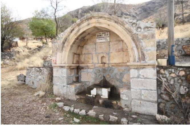
Foto.41. Esertepe Köyü Çeşmesi

Kitabeye göre çeşme, M.1870-71 yılında yaptırılmıştır. Ancak kim tarafından yaptırıldığı belli değildir.