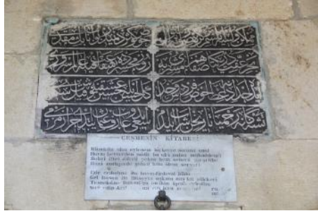
Foto.32. Arif Osman Ağa Çeşmesi Güney Cephe Foto.33. Arif Osman Ağa Çeşmesi Kitabesi