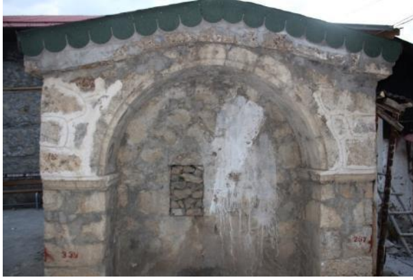
Foto.62. Toybelen Köyü Cami Çeşmesi