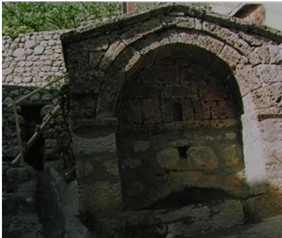
Foto.21. Taşdibi Mahalle Çeşmesi

Taşdibi Mahallesi Nalbant Sokak'ta bulunan çeşme, bağımsız çeşmeler grubunda olup tipik bir mahalle çeşmesidir. Yapı, Erzurum Kültür Varlıklarını Koruma Bölge Kurulu tarafından, 25.11.2005-234 sayılı tarih ve karar ile tescil edilmiştir. Çeşme nişi iki yanda ayaklara oturan yuvarlak kemerli olup yapı tek cephelidir. Üstü iki yana eğimli kırma çatı ile örtülüdür. Nişte modern bir musluk üzerinde kare biçimli taslık nişi bulunmaktadır (Foto.21). Düzgün kesme taştan inşa edilen yapı günümüzde işlevini sürdürmektedir. Üzerinde inşa kitabesi bulunmayan çeşme mimari özelliklerinden 19.yüzyıla tarihlendirilebilir.