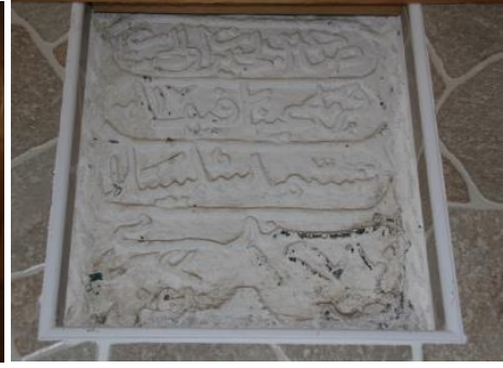
Foto.49. Kozlupınar Köyü Cami Çeşmesi Foto.50. Kozlupınar Köyü Cami Çeşmesi Kitabesi