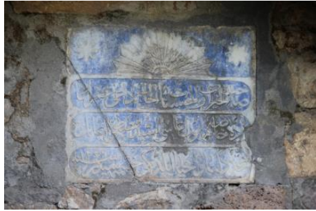
Foto.58. Seyyid Mustafa Ağa Çeşmesi 3 Foto.59. Seyyid Mustafa Ağa Çeşmesi 3 Kitabesi