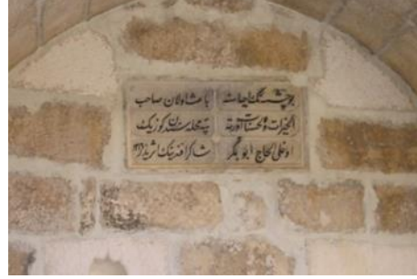
Foto.9: H. Ebubekir Şakir Efendi Çeşmesi Foto.10:H.Ebubekir Şakir Efendi Çeşmesi Kitabesi