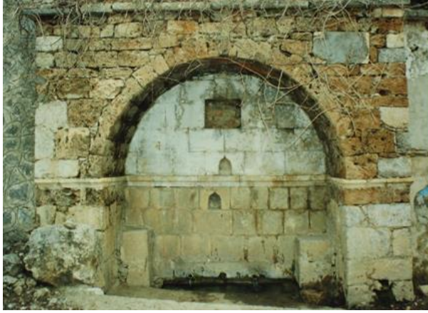
Foto.65. Yaka Köyü Çeşmesi

yaslandırılmış yapı, tek cephelidir. Çeşme nişi, profilli silmelerin çevrelediği yuvarlak kemerlidir. Nişte bir lüle, taş kemerli iki taslık nişi bulunmaktadır (Foto.65). Kitabesi yerinden sökülüştür. Çeşmenin üzeri düz bir saçakla sonlanmıştır. Bu nedenle inşa tarihi ve kim tarafından yaptırıldığı bilinmemektedir. Ancak benzer çeşme örnekleri ve mimari özelliklerden hareketle 19.yüzyıla tarihlemek yerinde olacaktır. Günümüzde işlevini sürdürmektedir.