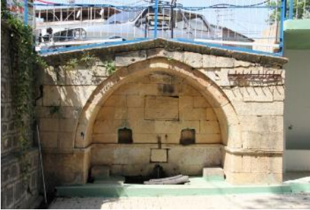
Foto.39. Dutluca Köyü Cami Çeşmesi Foto.40. Dutluca Köyü Cami Çeşmesi Kitabesi

Çeşme, ilçe merkezine 34 km. uzaklıkta Dutluca Köyü'ndedir. Köy meydanında Tevfik Ertürk Caddesi üzerindeki caminin güneyinde, kot farkından dolayı zemin seviyesinden aşağıda yola yaslı bir şekilde yapılmış çeşme, camii çeşmesidir. Tek cepheli çeşmenin profilli silme ile çevrelenen yuvarlak kemeri iki yanda ayaklara oturmaktadır. Nişte bir lüle, üzerinde kaş kemerli iki taslık nişi ve ortada kare biçimli taş kitabesi vardır. Teknenin iki yanında oturma sekileri bulunmaktadır. Yapının üzeri iki yana eğimli çatı ile örtülmüştür (Foto.39). Düzgün kesme taştan inşa edilmiş çeşme, günümüzde işlevini sürdürmektedir. Kitabesi okunmayacak durumda olup sadece inşa tarihi okunabilmiştir. M. 1907-08 tarihinde yapılmıştır (Foto.40).