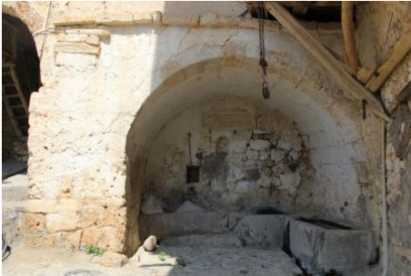
Foto.63. Tuğlu Köyü Çeşmesi

Bâd-u devlet derin ola...Sahiphayıra...olur da dua Hasan Hüseyin aşkıma...