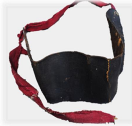
Fotoğraf 4. Rohati / Rohat (Rize-Çayeli, A.H.İ. Doğal Yaşam Özel Müzesi)