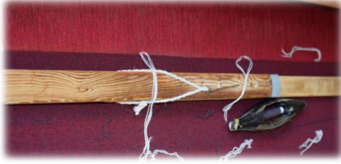
Fotoğraf 22. Mitit (Cımbal) (Bayburt Üniversitesi Baberti Külliyesi Dokuma Atölyesi)

getirilip kürdan veya ucu eğri bir metalle sabitlenerek kumaşın hep aynı ende olmasını sağlamaktadır (Fotoğraf 22). Tezgâhta bulunan “pedal (ayakçalık)”, iki adet olup, dokumada kullanılan çözgü çiftlerinin alt üst olmasını sağlayarak mekiğin atılması için ağızlık açmaya yardım etmektedir (Fotoğraf 23). İki adet olan ve “eşek” adı verilen pedallara bağlı ahşap parçalar ise dokuyucunun ayağını bastığı aletlerdir. Tezgâhtaki çözgülerin hareketi bu parçalara basılmak suretiyle sağlanmaktadır (Fotoğraf 24).