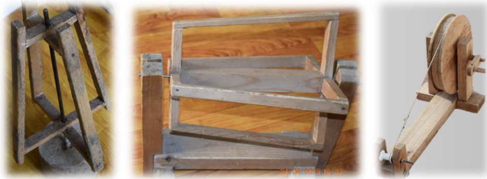
Fotođraf 17. Nezük, Kelepçe ve Çıkırık (Çıyrık) Sevim Ataner Dokuma Atölyesi

Hazırlanan çözü masuraları “uzatma çağına” geçirilmektedir. Bu alet, çözü aparatının etrafında bir baştan diđer başa kadar gidip gelerek çözülerin çapraz bir şekilde hazırlanmasında kullanılmaktadır. Uzatma kazığı ise çözüünün çözümesi işleminde kullanılan ve üç adet olan bir alet olup, bunlardan biri üçlü diđerleri ikilidir (Fotođraf 18). Uzatma kazığında hazırlanan çözü aparat üzerinde kuruması için bekletildikten sonra tezgâh üzerine aktarılarak düzen alması için gerekli işlemler yapıp dokuma işlemine geçilmektedir.