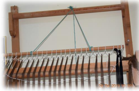
Fotoğraf 28. Tahsil Değneği, Tahsil İpi ve Urubat (Bayburt Halk Eğitim Merkezi)

Bayburt'ta yapılan araştırma sonucunda tespit edilen ehram dokumaların bölgeye ait özellikleri bünyesinde taşıdığı gözlemlenmiştir. Bu dokumalardan biri olan ve XX. yüzyıla ait 200x225 cm ebatlarındaki ehram, doğal renkli yünden dokunmuştur (Fotoğraf 29). Bu ehramda kullanılan renk çok az bulunmakta, 50 kg yünden ancak 2 kg elde edilebilmektedir. Dokumanın bir kanadında ende 6, boyda ise 14 adet elma şeleği motifi kullanılmıştır. Elma şeleği, ehram dokumalarda dökülmesi en zor olan, ancak en çok tercih edilen motiftir. Bayburt'un özelliklerini taşıyan bu dokumanın alt ve üst kenarında, yani saçak üstü nakışlarında Bayburt gordası motifi, yan kenarlarında ise mercimekli zincir görülmektedir. Bayburt gordası motifi ile felemenk arasında kalan bölümde 9 adet hanımgöbeği motifi sıralanmıştır (Emir, 2005: 107).