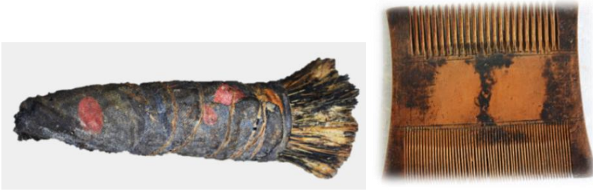
Fotoğraf 1-2. Vurçi / Şimşir tarak (Rize-Çayeli, A.H.İ. Doğan Yaşam Özel Müzesi)

Bir dokumada en önemli malzeme ipliktir. Feretiko (Rize bezi) dokumada kullanılan kenevirin yetiştirilmesi ve ipliğin elde edilmesi oldukça zor ve zahmetlidir. Kenevir bitkisinin yetiştirildiği Rize’nin yağışlı iklimi, ince ve uzun liflerin elde edilmesini sağlamakta ve bu liflerle daha ince bez dokumalar yapılabilir. Kenevir bitkisinin tohumları nisan ve mayıs aylarında toprağa ekilmektedir. Ekilen tohumlar beş ay sonra ağustos-eylül aylarında olgunlaşmakta ve yetişen bitkinin bir bölümü tohum için bırakılırken, iplik yapımında kullanılacak bitkiler ise sökülür. Sökülen kenevir bitkisinin kökleri bir ağaç kütüğünün üstüne konularak kesilir. Dal, yaprak ve başları kılıçla temizlenip bağ yapılarak soldurmaya bırakılır. Soldurma sonunda olgunlaşan kenevirler, elle kırılıp, lifler odunsu kısımdan soyularak alınmaktadır. Kenevir kesilip kurutulduktan sonra değirmen çarkında veya yağmur altında çürütülür, yörede “kopali” adı verilen bir el tokmağı veya su tokmağıyla dövülür suretiyle ıslatılıp yumuşatılmaktadır. Bu işlem genellikle bölgede dere kenarlarında yapılmakta ve yumuşatılan kenevirin üzerindeki lifler odun kısından ayrılmaktadır. Ayrılan bu kabuğa “kendir”, kabuğun alınması yani soyulması işlemine “kendir soymak”, dövülen kenevire ise “uskuli” denilmektedir. Uskuli adı verilen küçük yumaklar, önce “vurçi” ile daha sonra “şimşir” veya “kemik tarakla” taranmaktadır. Bu yumakların iyisine “ros”, kötüsüne de “ifale” adı verilmektedir (Fotoğraf 1-2).