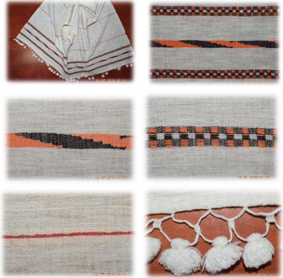
Fotoğraf 13. Feretiko Dokuma Peşkir ve Detayları (Rize-Güneysu İlçesi, Yücel Bayraktar Koleksiyonu)

kullanılarak tekrarlanmıştır. Peşkir olarak kullanılan bu dokumada turuncu renkli iplikle ince şeritler yer almaktadır. Bu şeritlerin her iki kenarında yine dokuma esnasında ipek iplikle yapılan küçük lokum motifleri tekrarlanmıştır. Dokumanın kısa kenarlarında pamuk ipliği ile yapılmış püsküller bulunmaktadır (Fotoğraf 13).