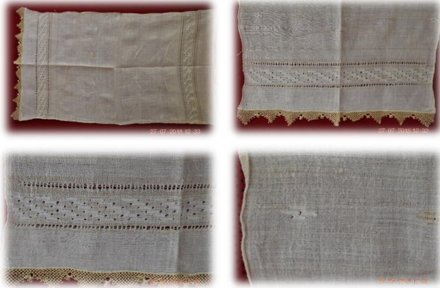
Fotoğraf 14. Feretiko Dokuma Peşkir ve Detayları (Rize-Güneysu ilçesi, Fatma Kapıcıoğlu)

genellikle askere gitmemiş olurdu. Bu kişiler askere gittiklerinde, asker yolu bekleyen eşler de yaptıkları dokumalarda kullandıkları apolete benzeyen bu motife “çavuş deseni” adını vermişlerdir.