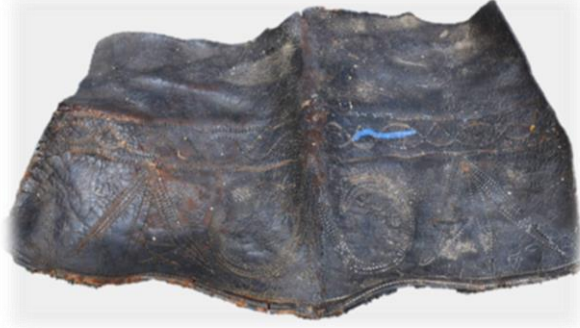
Fotoğraf 3. Peç / Peçi / Tomar / Deri (Rize-Çayeli, A.H.İ. Doğal Yaşam Özel Müzesi)