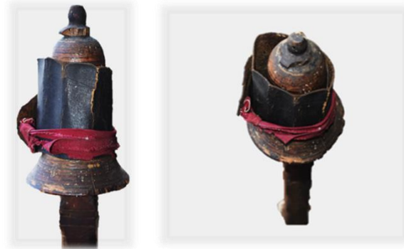
Fotoğraf 5. Rohati'nin Rokaya Bağlanması (Rize-Çayeli, A.H.İ. Doğal Yaşam Özel Müzesi)