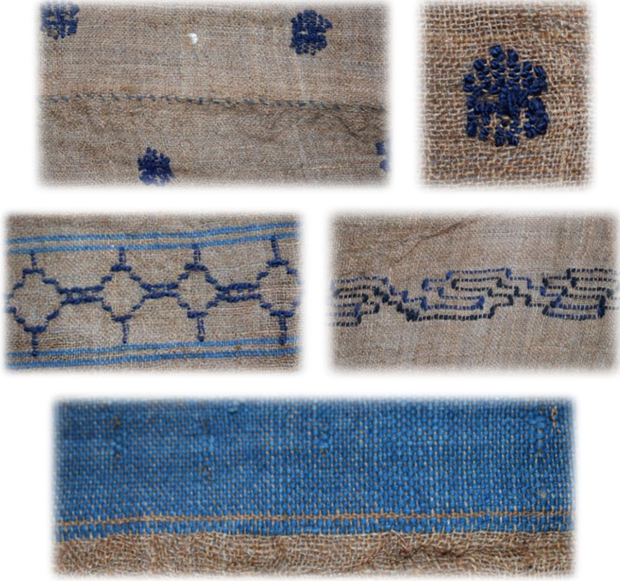
Fotoğraf 30. Ehram ve Detaylar (Zümriye Aslan, Bayburt Harmanözü Mahallesi)