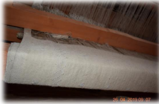
Fotoğraf 25. Selman (Kumaş levendi) (Bayburt Öğretmenevi Şark Köşesi)

Selmana sarılan kumaşın sıkıştırılmasını ve sabit durmasını sağlamak için selmanın sağ tarafında bulunan yuvasına takılan ve boyu yaklaşık 35 cm olan sabitleme demiri (el demiri) kullanılmaktadır (Fotoğraf 26). Tezgâhta bulunan aletlerden biri de kuş adı verilen mekanizmadır. Bir tezgâhta iki adet olup, ortalarında makaraya benzeyen bir düzeneğe sahiptir. Makaraların ortasındaki hareketli bir iplikle gücülere bağlanmakta ve gücülerin aşağı yukarı hareket etmesini sağlayarak ara açılmasını sağlamaktadır (Fotoğraf 27).