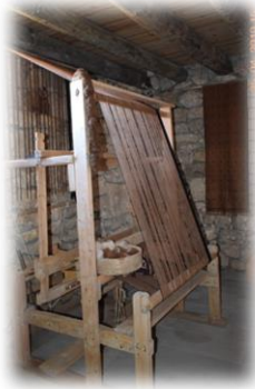
Fotoğraf 19. Ehram Dokumada Kullanılan Yüksek Tezgâh (Bayburt-Demirözü İlçesi Beşpınar Beldesi, Kenan Yavuz Kültür Evi)

“Tüfe (tefe)”, atkı ipliklerinin sıkıştırılmasını sağlamaktadır. Çözümlerin arasından mekikle geçirilen atkı ipliğinin dokumayı oluşturması için dokuyucu tüfeyi kendine doğru sertçe çekerek ipliği oturtmaktadır (Fotoğraf 20). Dokumada kullanılan “gücü”, çözümlerinin düzenli durmasına yardım etmektedir (Fotoğraf 21). Kumaş dokuma tezgâhında iki adet olan gücü, yukarıdan iplerle kuşlara, aşağıdan ise ayakçalara bağlanmaktadır.