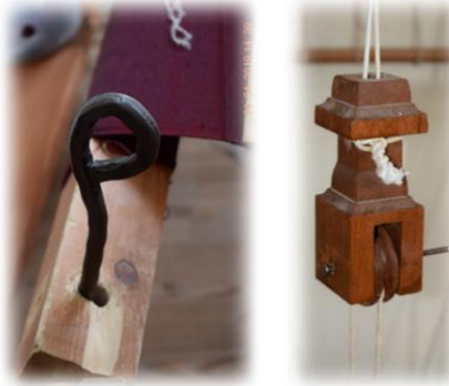
Fotoğraf 26-27. Sabitleme demiri / Kuş (Bayburt Üniversitesi Baberti Külliyesi Dokuma Atölyesi)

Selmana sarılan kumaşın sıkıştırılmasını ve sabit durmasını sağlamak için selmanın sağ tarafında bulunan yuvasına takılan ve boyu yaklaşık 35 cm olan sabitleme demiri (el demiri) kullanılmaktadır (Fotoğraf 26). Tezgâhta bulunan aletlerden biri de kuş adı verilen mekanizmadır. Bir tezgâhta iki adet olup, ortalarında makaraya benzeyen bir düzeneğe sahiptir. Makaraların ortasındaki hareketli bir iplikle gücülere bağlanmakta ve gücülerin aşağı yukarı hareket etmesini sağlayarak ara açılmasını sağlamaktadır (Fotoğraf 27).