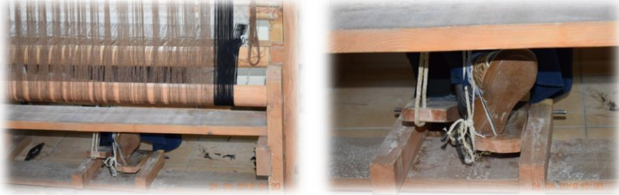
Fotoğraf 23-24 Pedal (Ayakçalık) / Eşek (Bayburt Halk Eğitim Merkezi)

Tezgâha aktarılan çözgünün bir ucu selman üzerinde bulunan “selman demirine” bağlanmaktadır. Dokunan ehram belli bir uzunluğa geldiğinde “selman” adı verilen kumaş levendine sarılıp dokumaya devam edilmektedir (Fotoğraf 25).