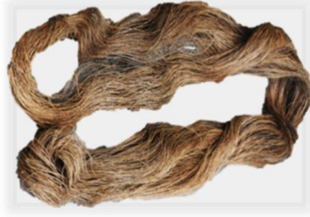
Fotoğraf 9. Kenevirden Elde Edilen İplik Çilesi (Rize-Çayeli, A.H.İ. Doğal Yaşam Özel Müzesi)

ölçü birimidir. Uzunluğu metre şeklinde olup tek en anlamına gelmektedir. Bir pitemi 50-60 cm, bir top keten 30-35 m olmaktadır.