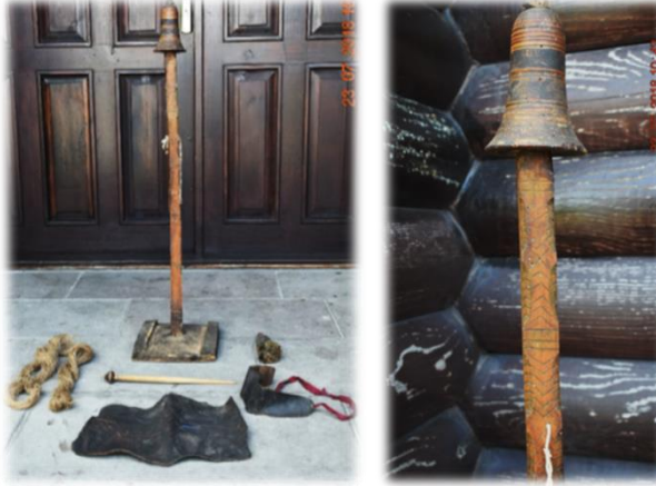
Fotoğraf 8. Kenevir Lifinin İplik Haline Getirilmesinde Kullanılan Rokopidi ve Yardımcı Malzemeler (Rize-Çayeli, A.H.İ. Doğal Yaşam Özel Müzesi)

Kenevir ipliğinin elde edilmesinde kullanılan rokopidi, roka, gövde ve rokopidi tahtası olmak üzere üç bölümden oluşmaktadır. Roka, gövdeye takılan ve gövde üzerinde dönerek lifin kolayca iğne sarılmasını sağlayan başlıktır. Gövde, 90 cm. uzunluğunda bir sopa olup, orta bölümünde bir delik bulunmaktadır. Deliğe iplik geçirilir ve uçlarına ağırlık yapması için boncuk takılır. Ayrıca ip eğiren kişi, eğirme işine ara verdiğinde iğne bu ipe takılmaktadır. Rokopidi tahtası ise gövdenin oturtulduğu dikdörtgen veya yuvarlak bir tahta olup, buna rokopidi patisi de denilmektedir (Fotoğraf 8). İplik eğiren kişi, sol ayağını bu tahtaya basarak suretiyle gövdenin hareket etmesini engellemektedir.