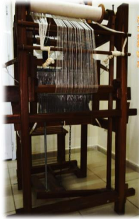
Fotoğraf 12. Kamçılı Yüksek Tezgâh (Rize İyidere İlçesi Halk Eğitim Merkezi)

sayesinde çözüğü ağızlığı açılıp araya masura takılı olan makoçi (mekik) geçirilmesi, atkı ipliğinin tarakla sıkıştırılması ve bu işlemin tekrar edilmesiyle dokuma yapılmaktadır. Masuralardan çıkan ve dokumanın bir ucundan diğerine giderek dokumanın oluşmasını sağlayan ipliklere atkı (ifali) denilmektedir. Bu iplikler kamçılı tezgâhlarda tutaç vasıtasıyla ağızlık arasından atılmaktadır. Feretiko (Rize bezi) dokumanın yapıldığı kumaş dokuma tezgâhlarında üç adet levent bulunmaktadır. Kumaş levendi, dokunan kumaşı sarmaya yarar. Çözüğü levendi çözüğünün sarılı olduğu leventtir. Dokuma yapıldıkça çözüğü verir. Üçüncü levent ise çözüğülerin düzgün bir şekilde dokumanın yapıldığı yere gelmesini sağlamaktadır. Çözüğü ipliğinin aynı gerginlikte durması fren sistemiyle yapılmaktadır. Dokuyucunun dokuma esnasında oturduğu koltuk biçimindeki sehpa ise istarina (salmi) adı verilmektedir.