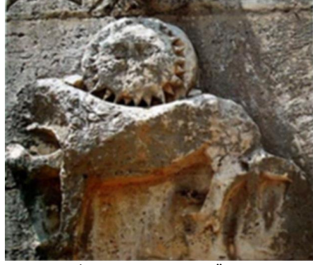
Fotoğraf 8. İncir Han Taç Kapısı Üzerinde Arslan ve İnsan Yüzlü Güneş Kabartması (Semra Ögel)