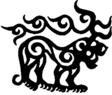
Fotoğraf 4. Altay Hun Çağı Tuyahta Kurganlarına Ait Geyik, Arslan, Kurt veya Kaplan Geyikler (Bahaeddin Ögel)