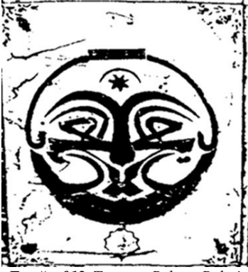
Fotoğraf 12. Tanrının Bektaşî Baba'nın Yüzünde Var Olduğu Şeklindeki İnanıcı Temsil Eden Kaligrafi (Frederick De Yong)