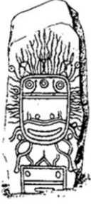
Fotoğraf 1. Karasuk Devrine Ait Taş Üstüne Oyulmuş Güneş Haleli Baş (Emel Esin)