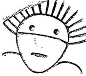
Fotoğraf 2. Türk Devrine Ait Taş Üstüne Oyulmuş Güneş Haleli Baş (Emel Esin)