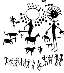
Fotoğraf 3. Güneş Başlı ve Dans Eden Figürlerin Betimlendiği Kaya Resimleri, Kazakistan (Mihaly Hoppal)