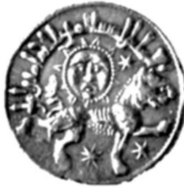
Fotoğraf 6. Arslan ve Güneş Tasarımlı Madeni Sikkeler, II. Gyaseddin Keyhüsrev, Anadolu Selçuklu Dönemi (Tolga Erkan)