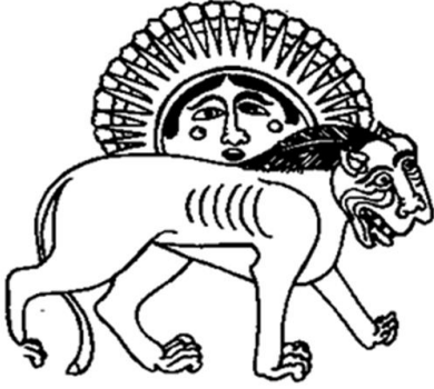
Fotoğraf 7. Alplik veya Hükümdarlık ile Özdeşleştirilen Çalışma (Çoruhlu)