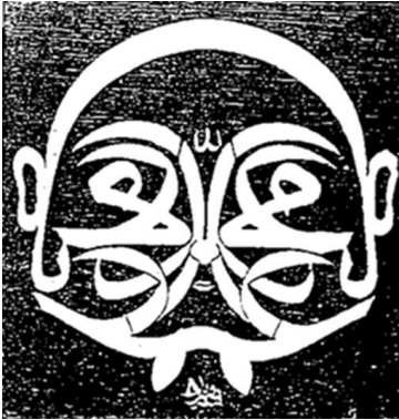
Fotoğraf 11. Cihar-ı Yar-ı Güzin ve Al-i Abanın Resmi (Malik Aksel)