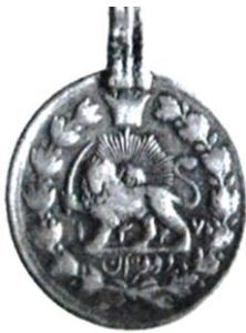
Fotoğraf 5. Güneşin Önünde Duran ve Kılıç Tutan Arslan Simgesi, 1327 İnan Madalyonu (Alexander Fodor)