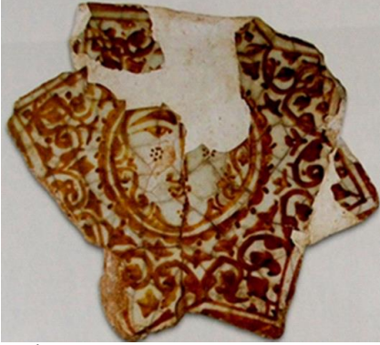
Fotoğraf 9. İnsan Yüzlü Güneş Figürü, Yıldız Biçiminde Çini Lüster, Kubad Abad, Büyük Saray (Rüçhan Arık)