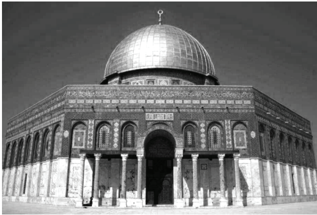
Resim 46 Mehmed Şefik Bey'in 8 cephesinde (20 X 8m) uzunluğunda Yasin suresini hazırladığı ve ustalar tarafından İznik çinilerine aktarılan Kudüs Beytülmakdis alanındaki Kubbetü's-Sahra yapısı