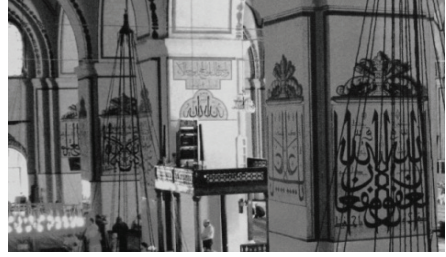
Resim 1 Bursa Ulucami'nin üzerinde Mehmed Şefik Bey ve Abdülfettah Efendi'nin yazıları bulunan mihrap ve çevresinin görünüşü