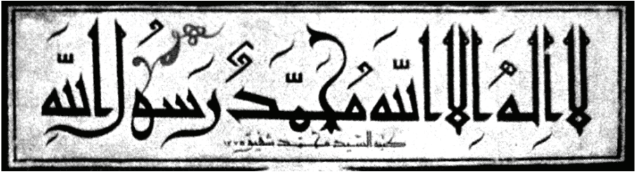
Resim 12 Mehmed Şefik Bey'in Bursa Ulucamiindeki 1275 / 1859 tarihli ve "Ketebehu es-Seyyid Muhammed Şefik" imzalı çiçekli küfî stildeki muhteşem Kelime-i Tevhid yazısı