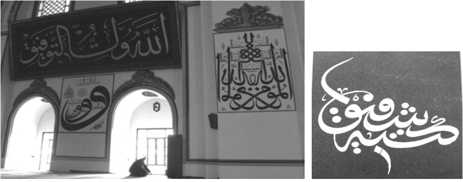
Resim 10 Bursa Ulucamii'nde Mehmed Şefik Bey'in 7 X 3.5m ebatlarındaki "Allahu Veliyyü't Tevfik" yazılı levhası ile diğer istiflerinden bazılarının uzaktan görünüşü Resim 11 Mehmed Şefik Bey'in bu levhadaki "Ketebehu Şefik" yazılı muhteşem imzası