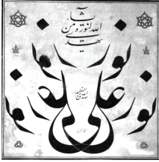
Resim 13 Mehmed Şefik Bey'in Bursa Ulucamii'ndeki çok hareketli Nur'un Alâ Nur yazısı