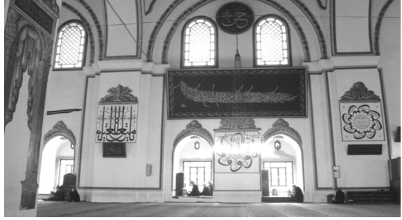
Resim 14 Mehmed Şefik Bey'in Bursa Ulucamii'ndeki 7m X 3.5m ebatlarındaki Hiz. İbrahim'in Duası muhtevalı muhteşem eserinin uzaktan görünüşü