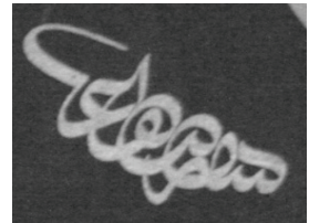
Resim 6-7 Bursa Ulucami'nde Mustafa İzzet Efendi'nin 7 X 3.5m ebatlarındaki "Vallahu Galibu'n Ala Emr" yazılı muhteşem celi sülüs levhası ve bu levhadaki MUSTAFA imzası