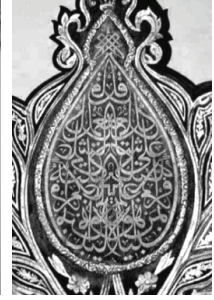
Resim 3 Ön cephesinde M. Şefik Beyin sülüs Ayete'l Kürsî yazısı bulunan Bursa Ulucami'nin mihrabı