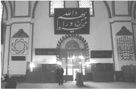
Resim 16 Mehmed Şefik Bey'in birçok eserde birlikte çalıştığı arkadaşı Abdülfettah Efendi'nin Bursa Ulucamii kuzey kapı girişi üzerindeki bir levhası ile bazı istiflerinin görünüşü