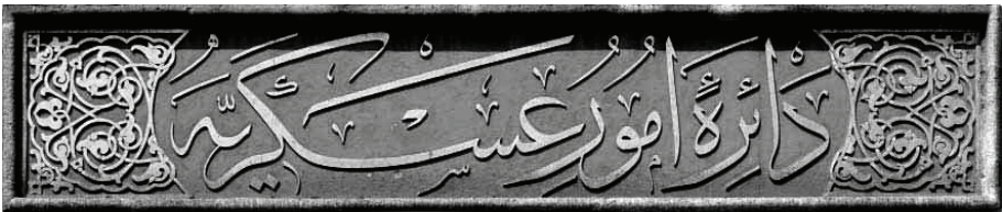
Resim 26 İstanbul Üniversitesi Taç kapısının dış cephesindeki Mehmed Şefik Bey'in meşhur "Daru'l Umur-i Askeriyye" yazılı celif sülüs yazıları