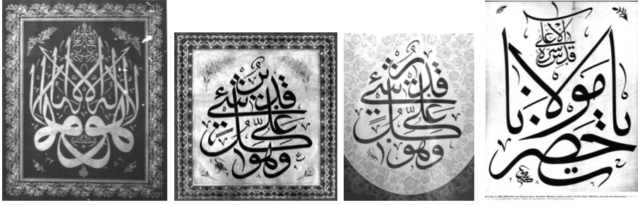
Resim 35 Şevket Rado'nun Türk Hattatları kitabına kapak olarak kullandığı Mehmed Şefik imzalı istifi