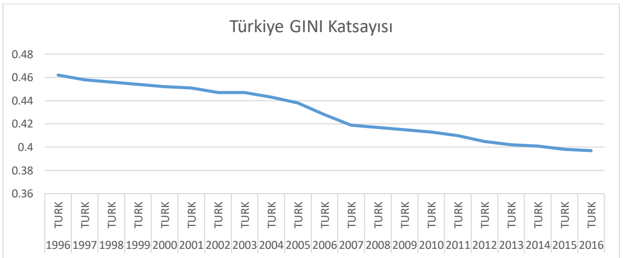
Şekil 3: Türkiye'de Gini Katsayısı (1996-2016)

Kaynak: https://dataverse.harvard.edu/dataset