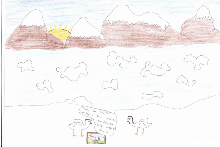
Şekil 2: Sınıf içi etkinlikte öğrenciler tarafından yapılan karikatüre bir örnek.

Elde edilen istatistiksel veriler dışında öğrencilerin iklim konusu ile ilgili karikatür çizimleri istenmiştir.